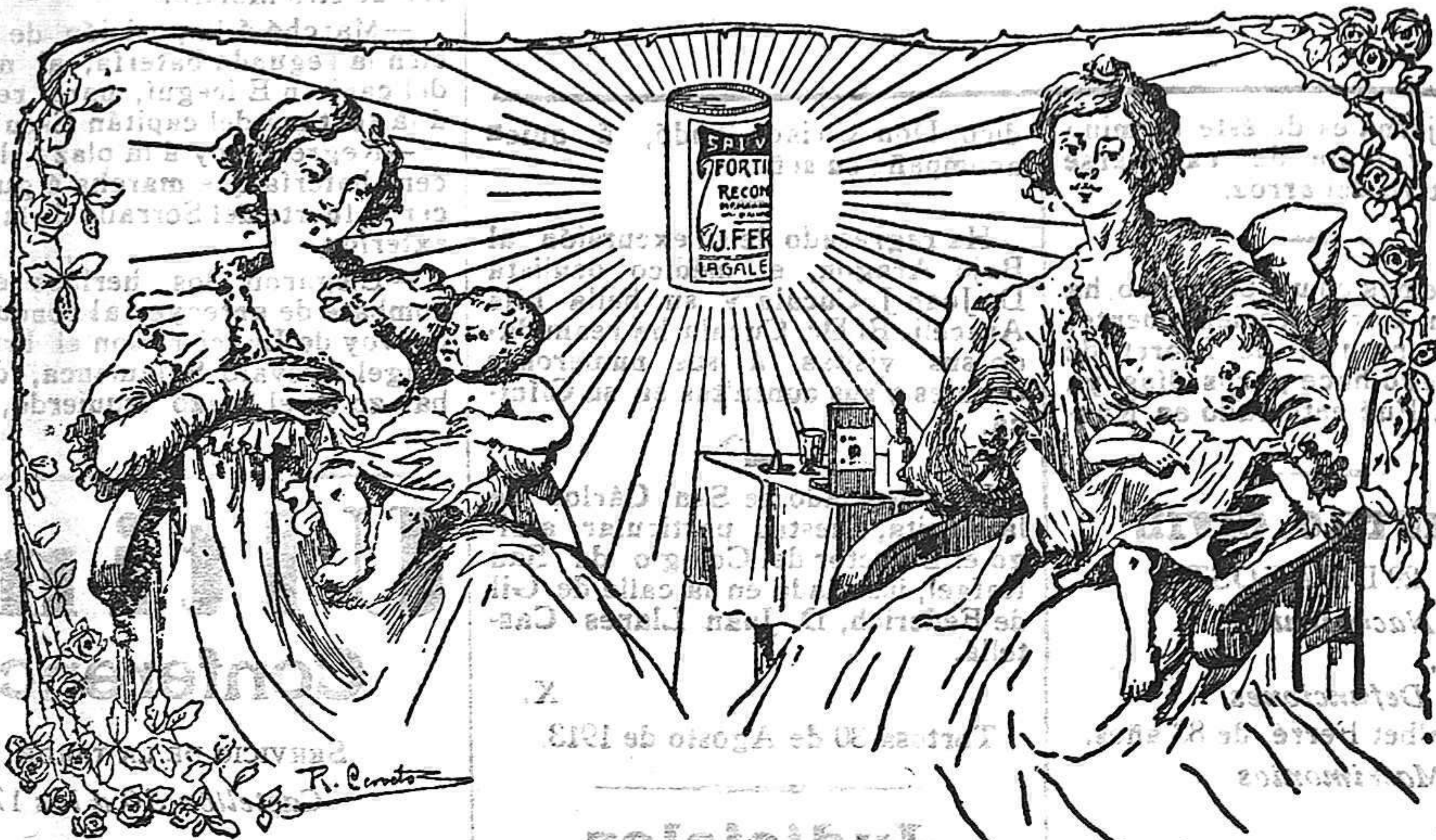
LA QUE TOMO EL "SALVEROL"

El ideal de la medicación externa, fortificante, resolutorio de primer orden. Previsor de las enfermedades de los pechos, alivia momentáneamente y cura todos los dolores localizados donde la sangre no circula, contusiones, humores herpéticos y todas las enfermedades subcutáneas que reconocen por causas, cambios atmosféricos, bajas temperaturas y corrientes de aire. Principales factores y generadores de los diabios orgánicos que atacan á la glándula celular.