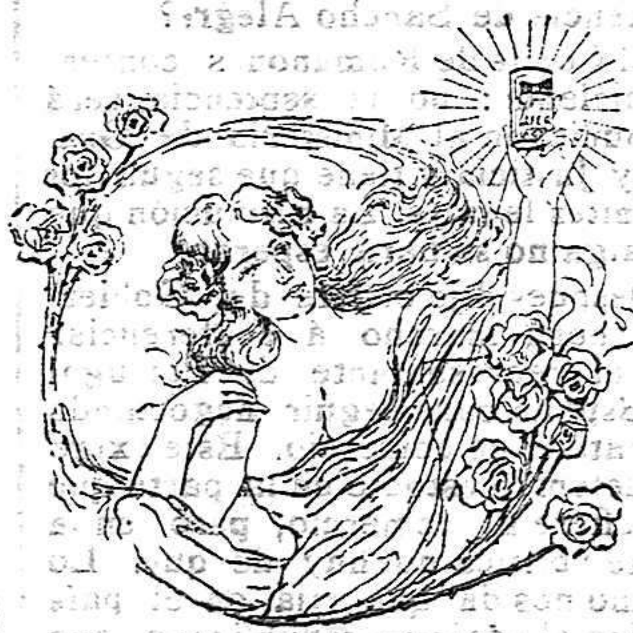
LA QUE TOMO EL "SALVEROL"

Al entrar en el 8.º mes del embarazo, to las mañanas se hará con una bayeta, un baño á los pechos con agua salada á saturación y á placer. Por espacio de 5 minutos, y enjuagá los después con una tohalla. Se pondrá un gramo de polvo en palmo de la mano y se restregarán por to la parte escorjosa y delantera de los pechos, hasta conseguir eructos en los poros del cutis, poniendo encima la misma bayeta dando dobles ligeramente mojada con la misma agua á placer y se abrochará el corsé.