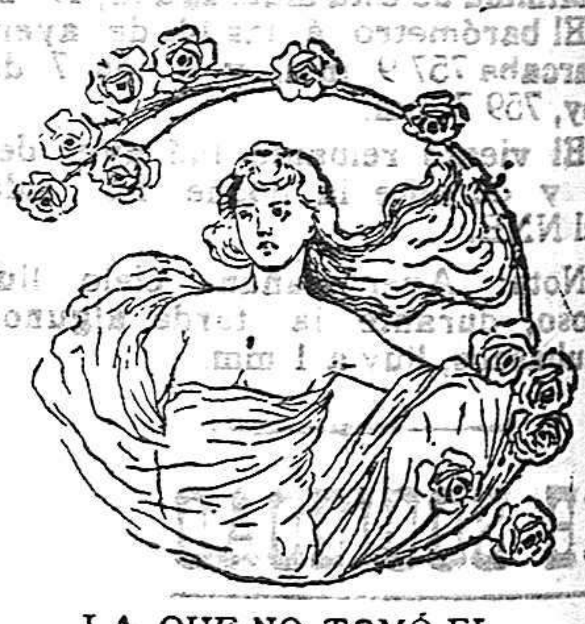
LA QUE NO TOMO EL "SALVEROL"

Conviene que por las noches estén libres los pechos, para el desarrollo y descanso consiguiente.