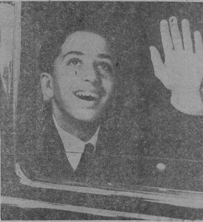
El joven monarca Feisal del Irak, acompañado de su tío, el embajador Amir Zaid Ibn al Hussein, llega a Tilbury, donde es aclamado por el pueblo inglés, correspondiendo con un cordial saludo. El rey Feisal, ingresará como alumno en el Canaroyd Preparatory School de Dorset.