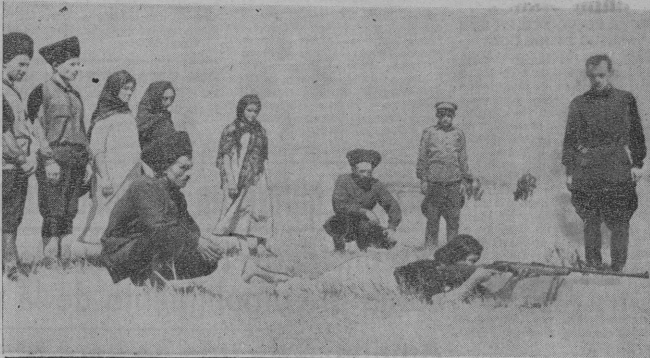
LAS GUERRILLAS SOVIETICAS.—Mujeres rusas del Cáucaso realizando ejercicios de tiro con fusil.

El clima se descompone en ocho zonas climatológicas