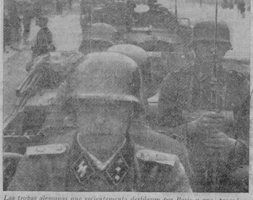
Las tropas alemanas que recientemente desfilaron por París y que, procedentes del frente Este, fueron llevadas a Francia. La marcha duró ocho días y los soldados venían preparados para hacer frente a un posible intento de invasión

Médico oculista. Reanuda su consulta diaria de once a dos. Calle de Colón 5. Telf. 203. Segovia. Consultorio Sanitario S. G.—9