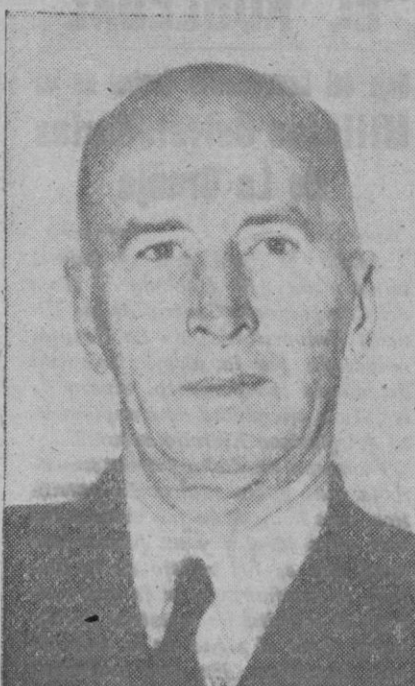
Almirante Ernest J. King, jefe de la flota de los Estados Unidos, que ha declarado que los combates navales que se desarrollan actualmente en aguas de las islas Salomón son las operaciones más difíciles y más complicadas de la presente guerra

Una alocución a los soldados indios. Bangkok, 25 (6 t.).—El portavoz de la Liga de la independencia india de esta capital, ha declarado en una alocución radiodifundida, dedicada a los soldados indios, que numerosos soldados originarios de la India serán utilizados en el mundo entero para ayudar a los británicos a conseguir sus fines. «No es para la creación de una fuerza defensiva de la India—puso de relieve el portavoz—por lo que los ingleses sostienen un ejército en las regiones hindúes, sino para utilizarlos como instrumento de opresión contra los indios que exigen su libertad. Muy pronto se pedirá a los soldados indios que aplasten a su propio pueblo. Este es el momento en que debéis tomar una resolución de la que depende vuestra vida o vuestra muerte. Nosotros conocemos vuestro carácter y sabemos que os salvaréis y haréis uso de las armas. Ha llegado el momento de poner vuestras armas al servicio de la patria. ¡Hijos valientes de la India, preparaos a defender vuestra patria! Todas las esperanzas de los indios están en vosotros y ellos están convencidos de que no les decepcionaréis.»