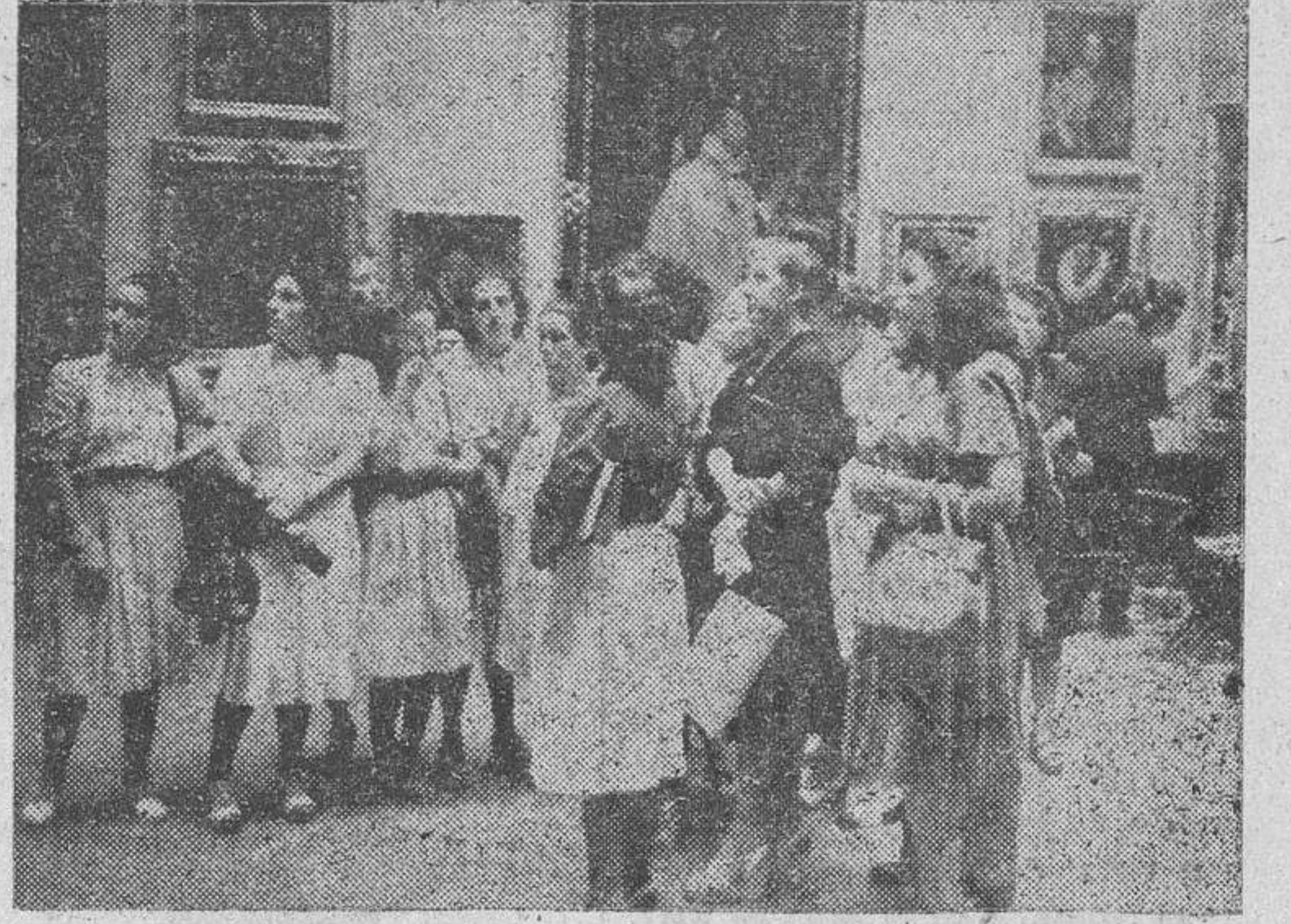
Las muchachas de las Mocidades Femeninas de Portugal, que se encuentran en Madrid en viaje de estudios y dentro de un plan de intercambio con las estudiantes españolas, visitan el Museo del Prado acompañadas de la regidora central del S. E. U. de la Sección Femenina.