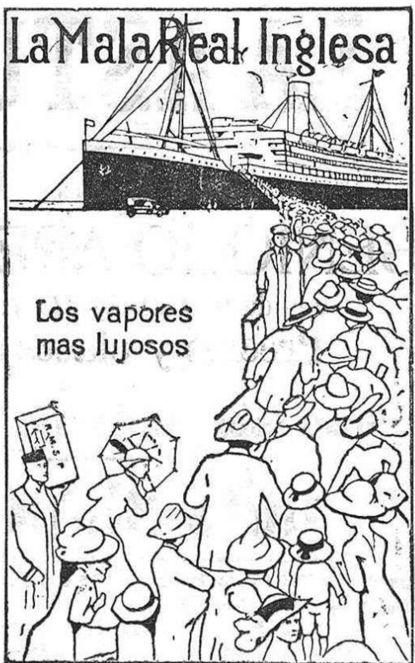
Los vapores mas lujosos

PERNAMBUCO BAHIA RIO JANEIRO SANTOS MONTEVIDEO Y BUENOS AIRES