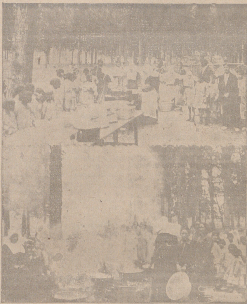
Dos aspectos de la fiesta en Fuentes Blancas.

a repartir la comida y durante la merienda repartió caramelos a todos los asilados. El administrador de los establecimientos de beneficencia provincial estuvo con su familia presenciando el reparto de la comida y ha permanecido toda la tarde acompañando a los asilados.