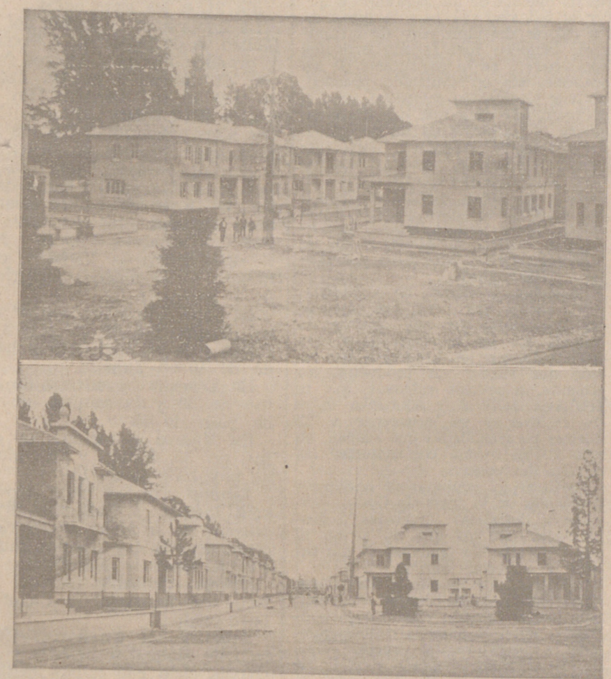
Fotografía de EL CASTELLANO. Arribar: Un grupo de casas para jefes y oficiales en la Plaza central. Abajor: Una calle de la barrada y al fondo la Iglesia.

Las casas vistas por dentro. :: :: tro. :: ::