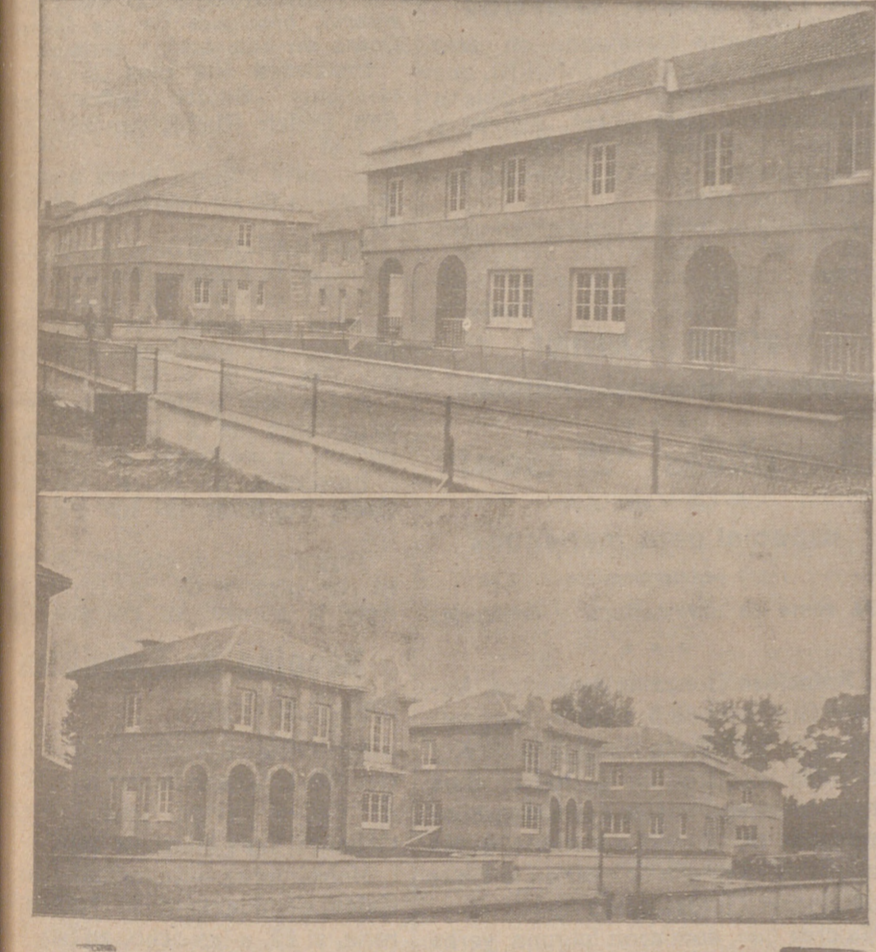
Arribar: Una casa bifamiliar. Abajor: Los dos edificios que los obreros conocen por el "Ayuntamiento" y la "Diputación"