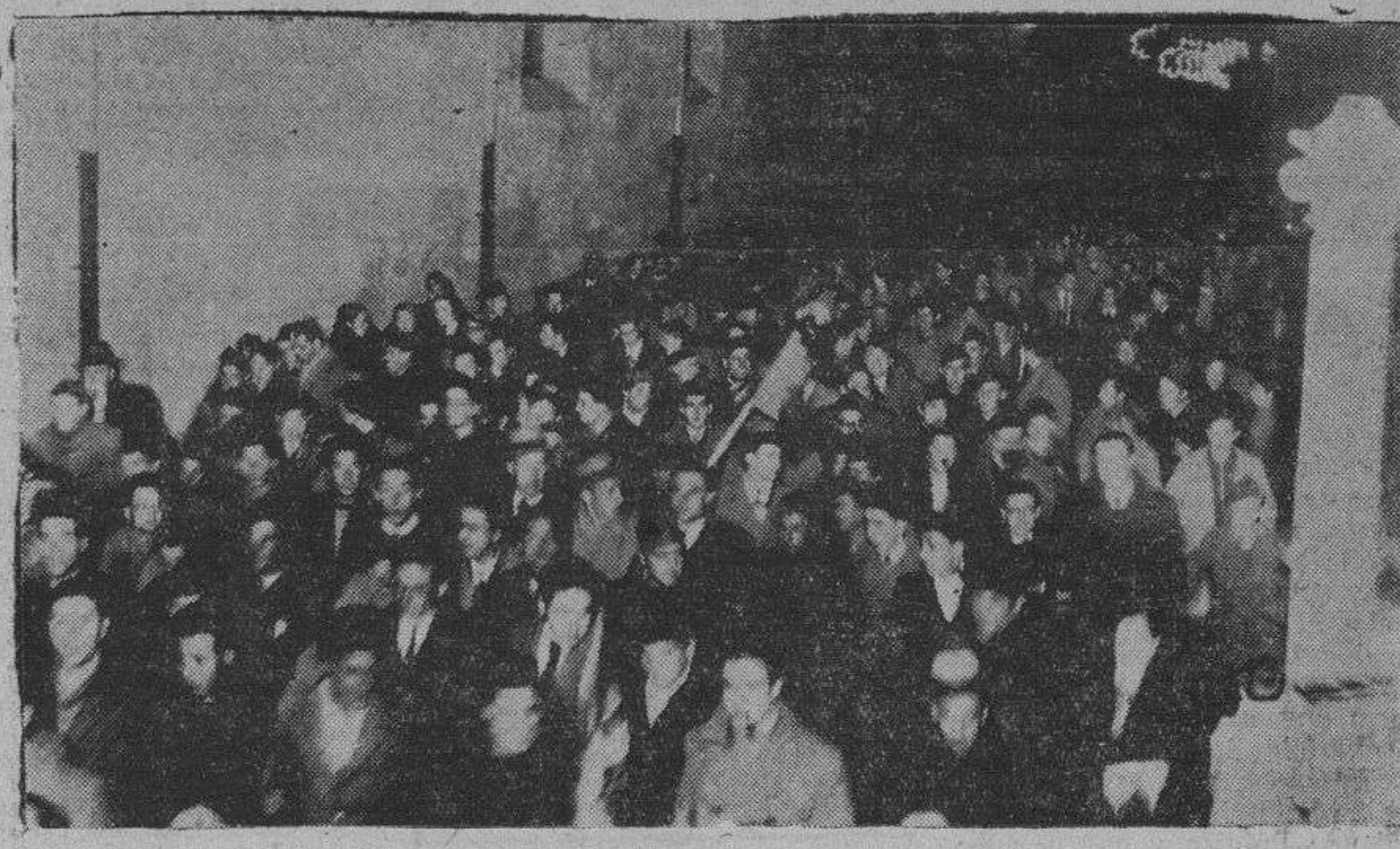
Un aspecto de los alrededores del Palacio del Generalísimo durante la imponente manifestación organizada en la noche del jueves en honor de Portugal, la nación hermana

A esta fiesta han sido invitados S. E. el Generalísimo Franco, su esposa, el Cuerpo Diplomático y las Autoridades Militares y Civiles.