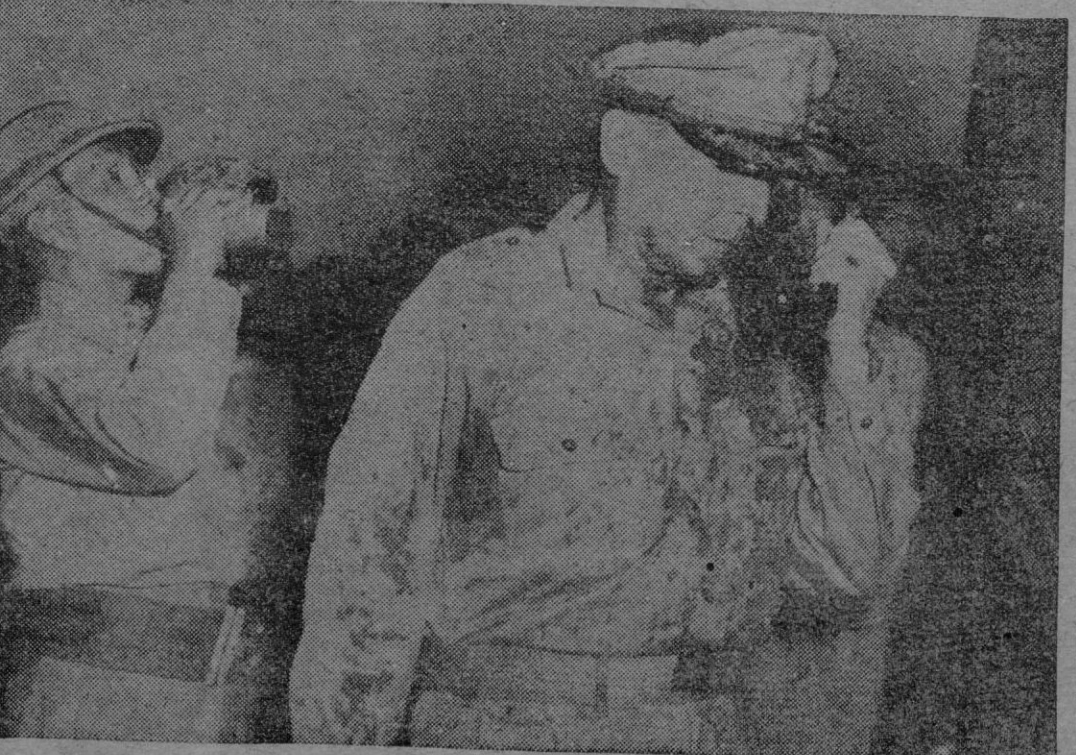
El general Mac Arthur, con su uniforme salpicado de agua de mar habla por radio al pueblo filipino para decirle: «He vuelto». A la izquierda, el Presidente de Filipinas Sergio Osmeña bebe en una cantimplora de un soldado americano.