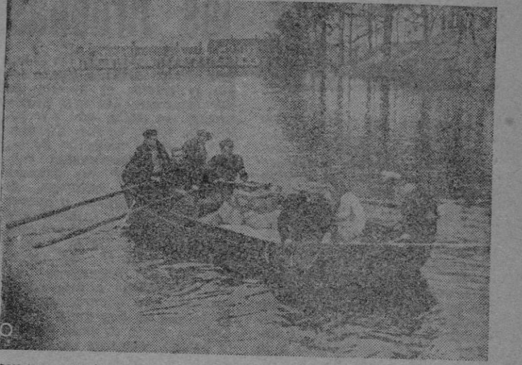
Miles y miles de refugiados han quedado en gran parte sin hogares debido a las inundaciones producidas por la acción de las bombas de aviación atacante, y con lo poco que pueden salvar, se trasladan a lugares seguros.