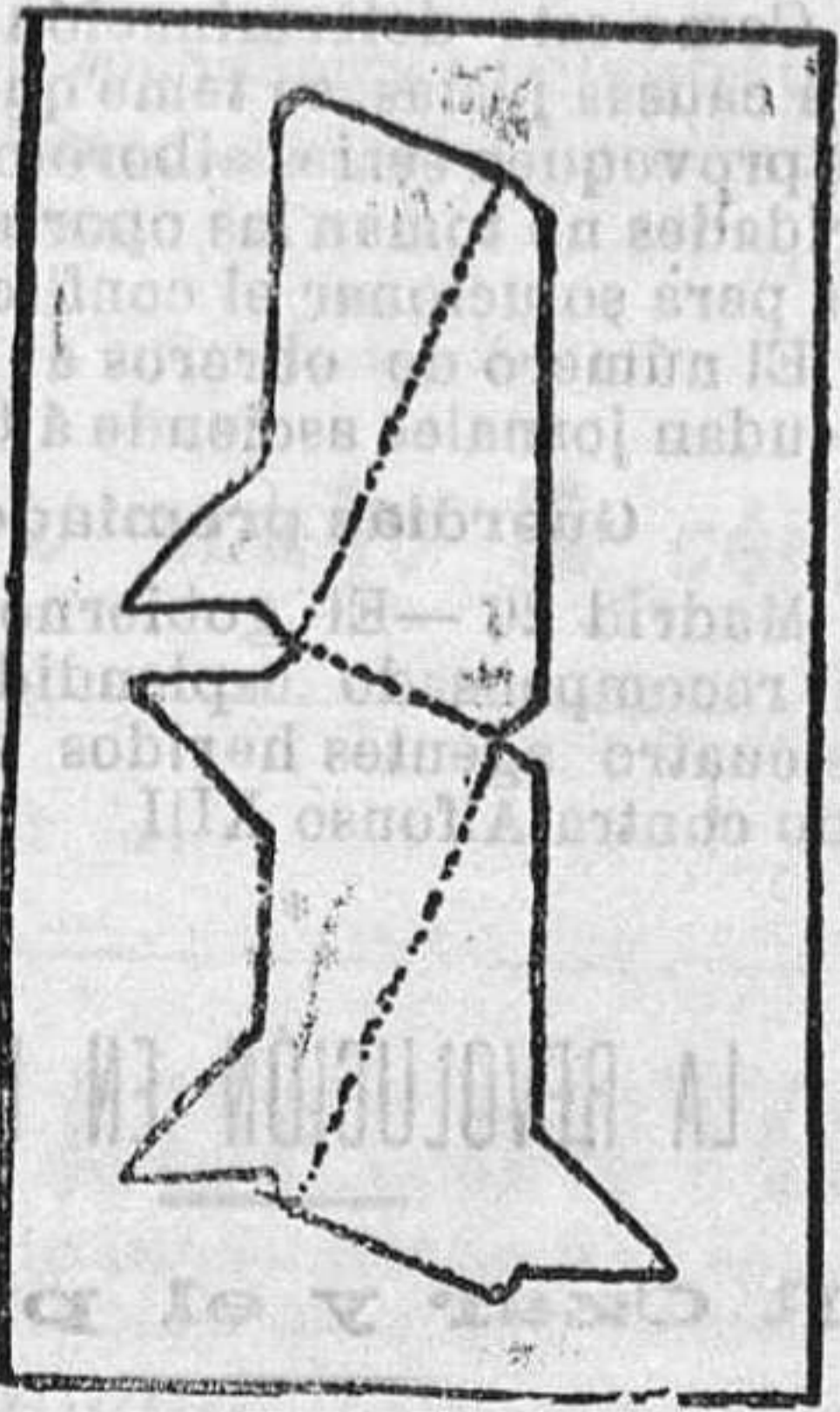
Cómo se tiene que efectuar el corte de la figura.