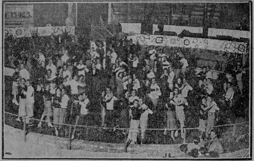
En la pista de un teatro de Madrid ha comenzado el campeonato de resistencia de baile, concourriendo representaciones de varias capitales de Europa.—Aspecto de la sala al comenzar el campeonato.

La casa de la Bolkerstrasse, en Dusseldorf, donde habitaron Heine y su familia, va á ser restaurada y restablecida en su estado primitivo, como homenaje á la memoria del gran poeta que en Dusseldorf vivió la primera luz. Las obras de restauración han empezado ya y el interior de la casa será decorado con muebles y recuerdos de la época de Heine. La casa, que está abierta á los visitantes como Museo y junto á la Biblioteca Municipal de Dusseldorf, donde se guardan, con otros recuerdos los libros y la mascarilla del ilustre hijo de la ciudad, constituirá un nuevo lugar de peregrinación para los admiradores de Enrique Heine, poeta alemán y espíritu anclado en un glorioso sentimiento de Humanidad.