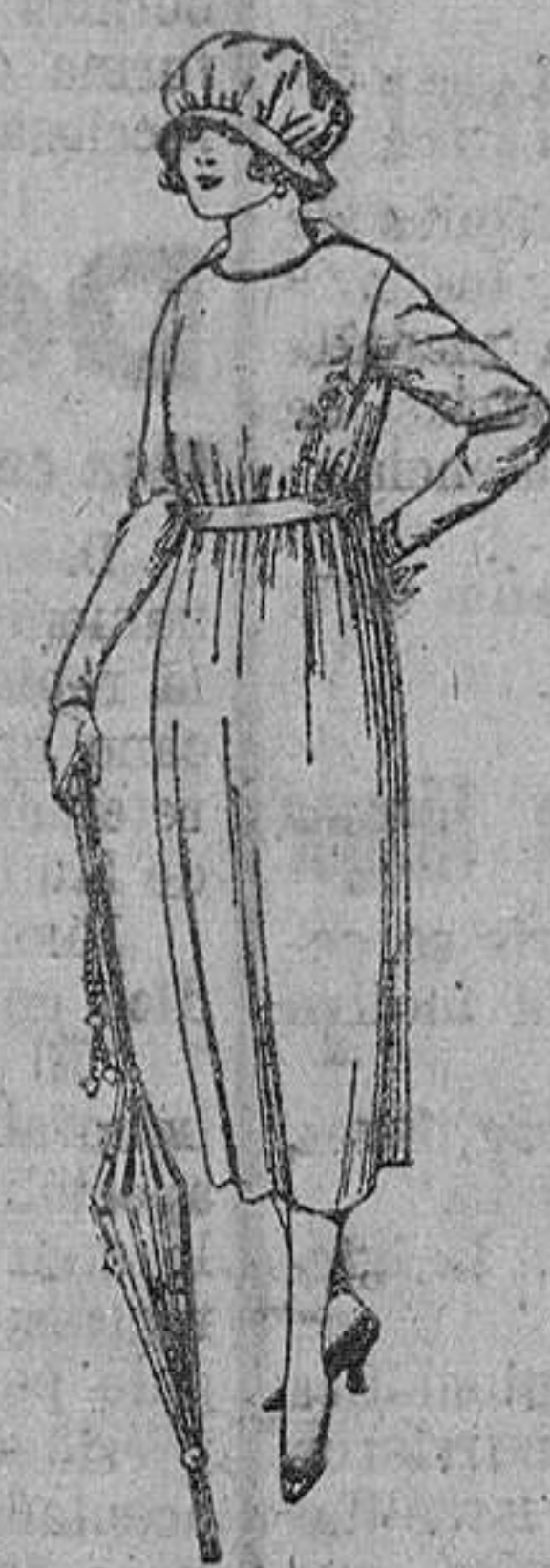
Vestidos de estambre, lanilla, etc., en azul y colores, adornos bordados. De ptas. 57 a 65.