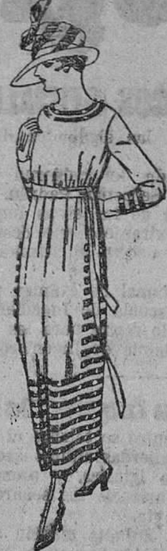
Vestidos de sarga inglesa, estambre, etc., en negro, azul y color, adornos trenilla de seda. De ptas. 90 a 105.