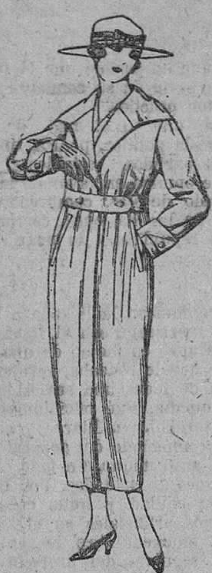
Guardapolvos de dril crudo, gris, etc. De ptas. 14 a 28.