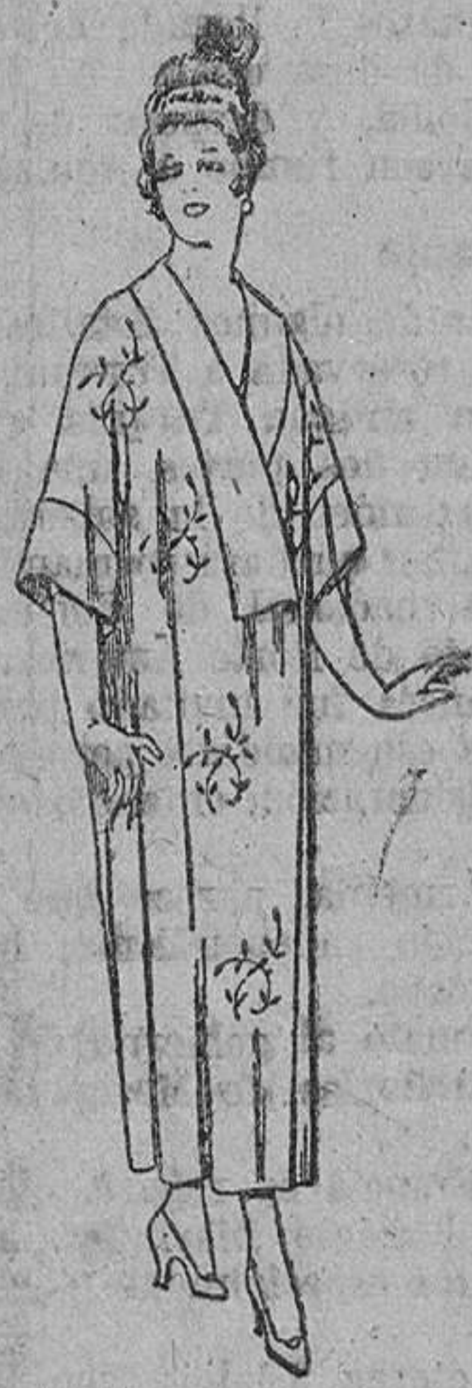
Batas de estorilla «Matting», adornos bordados. De ptas. 45 a 58.