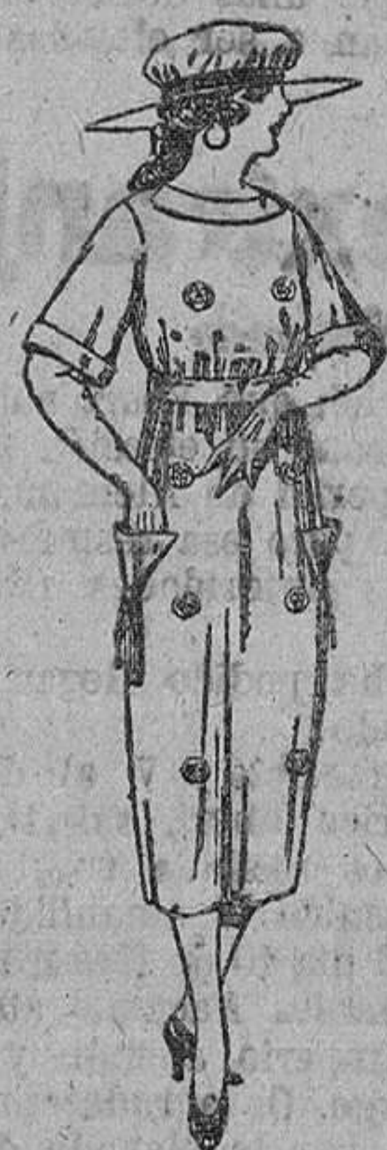
Vestidos de sarga inglesa, estambre, etc., en azul y colores, adornos bordados. De ptas. 55 a 62.