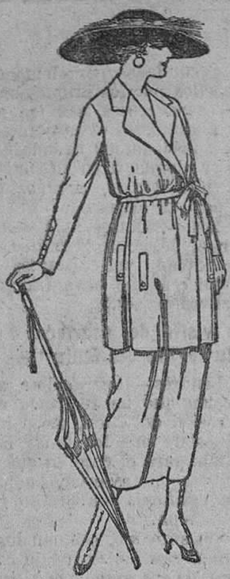
Trajes de estambre, lanilla, eticera, en negro, azul y color. De ptas. 120 a 135.

Madrid, Barcelona, Alicante, Almería, Bilbao, Cádiz, Cartagena, Gijón, Granada, Málaga, Palma de Mallorca, Santander, Sevilla, Valladolid y Zaragoza.