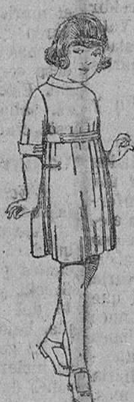
Vestidos de sarga inglesa azul, adornos sarga blanca, para niñas de 4 a 9 años. De ptas. 36 a 40.