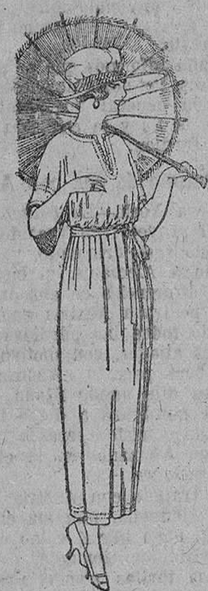
Vestidos de voile blanco y color, adornos bordados. De ptas. 45 a 58.