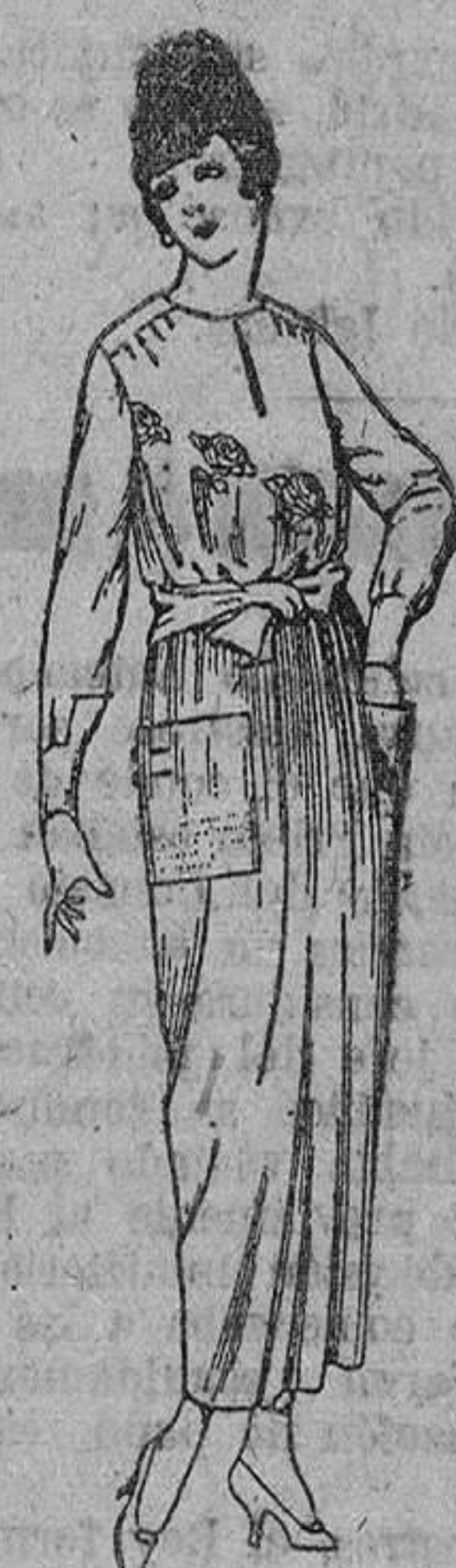
Blusas de crepón, voile, etc., en negro, azul y color, adornos bordados. De ptas. 17 a 22. Faldas de lanilla, estambre, gabardina, etc., en negro, azul y colores. De ptas. 28 a 36.