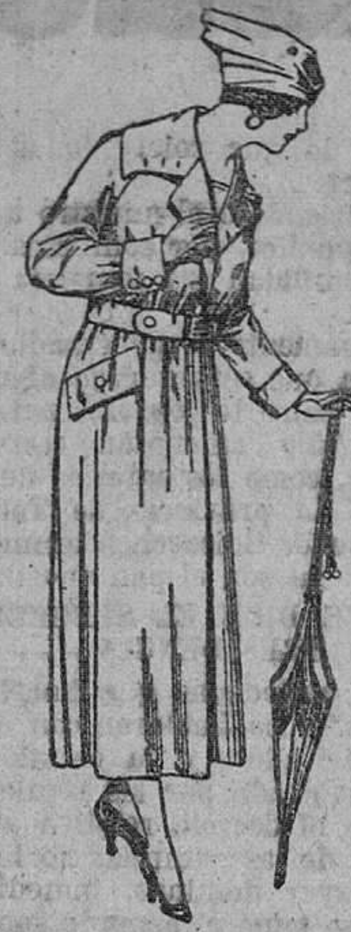
Abrigos de gabardina inglesa, impermeabilizados, diferentes colores. De ptas. 85 a 150.