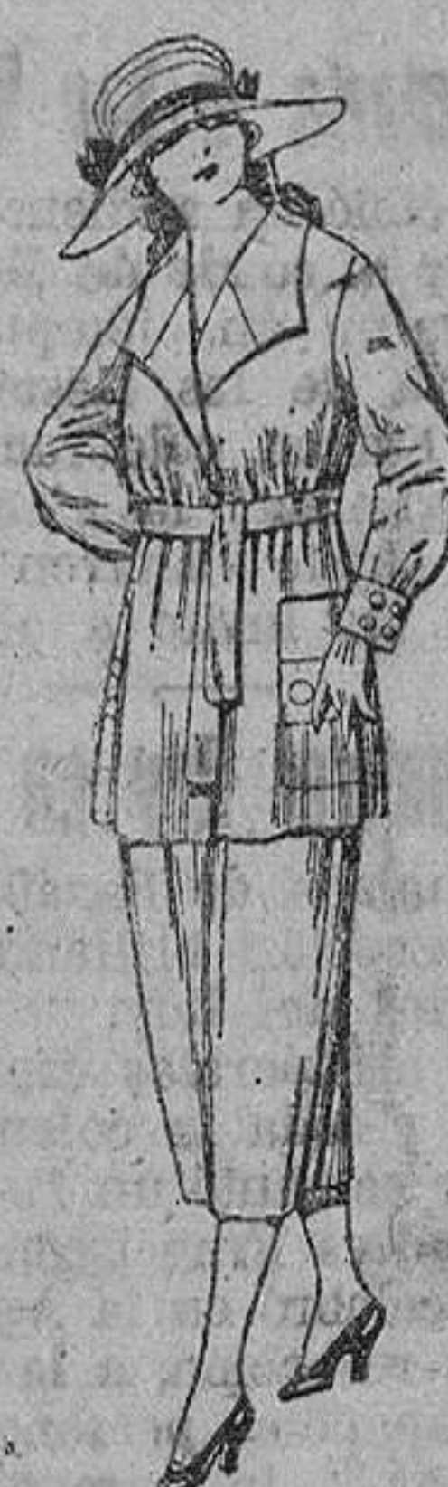
Trajes de estambre, gabardina, etc., en azul y color. De ptas. 68 a 79.