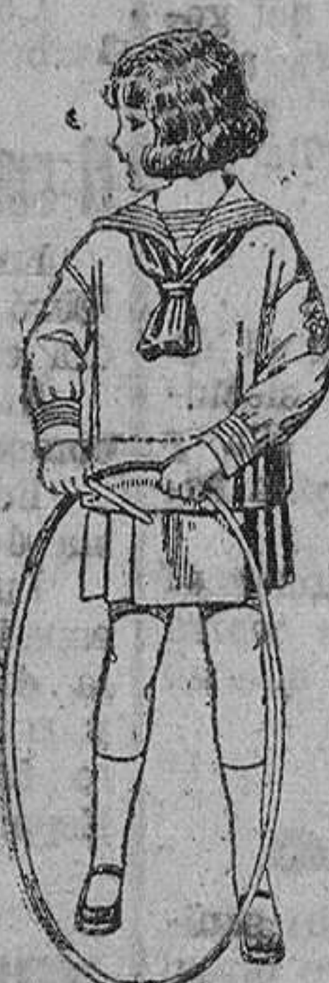
Trajes modelo «Marinera inglesa», de estambre o jerga azul, para niños de 4 a 9 años. De ptas. 30 a 42.