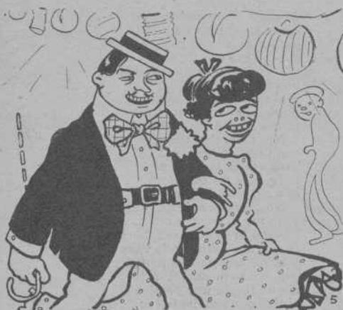
A la 1 se 'n puja á la Font del Gat.