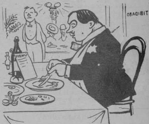
A las 9 sopa al Tibidabo.