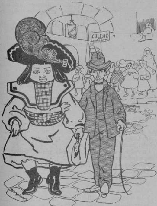
—No t'acostis, Millo, que la mestra guayta, y avuy deya qu' es un "disparate muy grande" pensar ja en xicots á onze anys.

Pero si per aquesta part han tingut omisió tan lamentable, per un altre cantó poden encare guanyar lo perdut, anyadint al programa un suplement extraordinari, que no 'ls costará res y de fixo cridarà l'atenció pública.