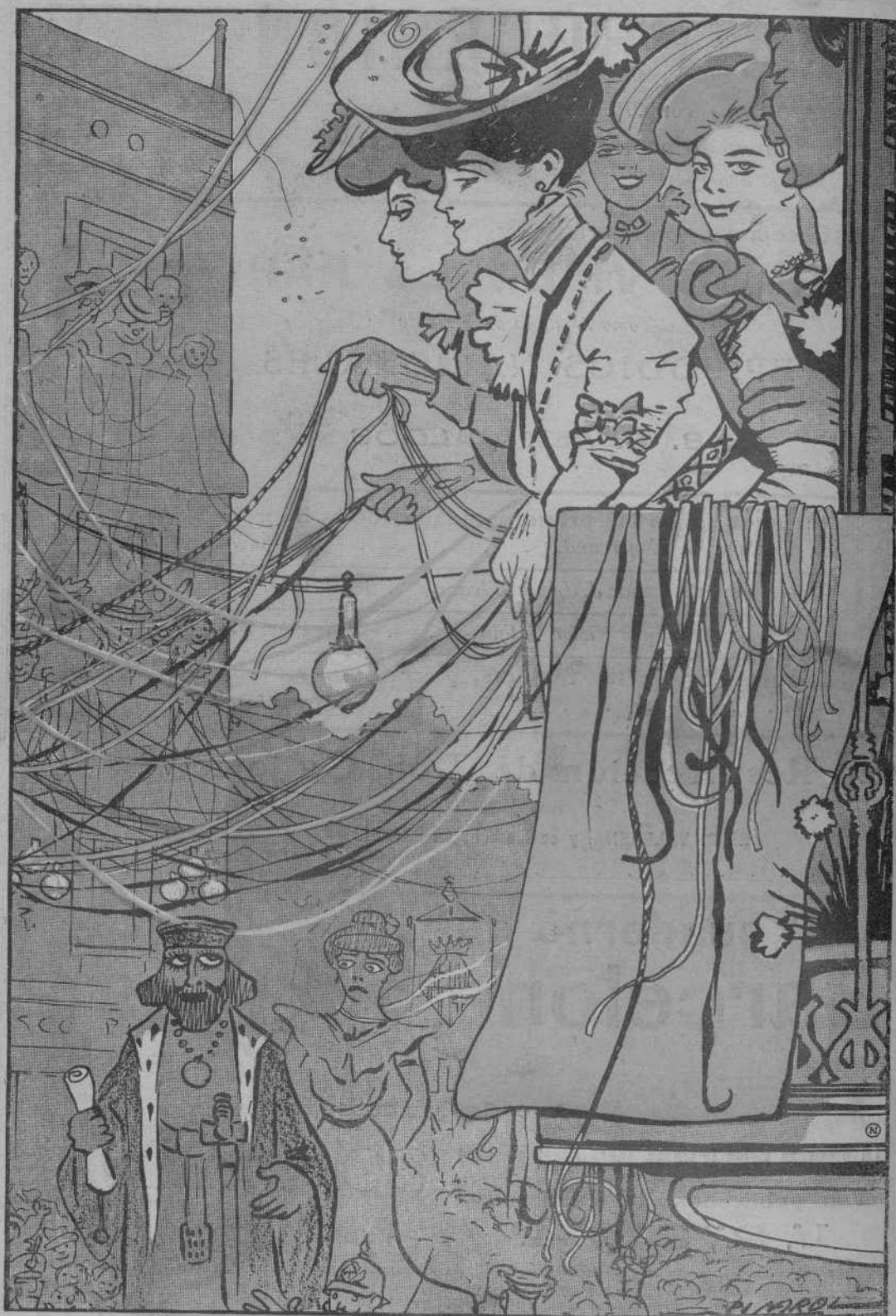
El balcó mes ben adornat.