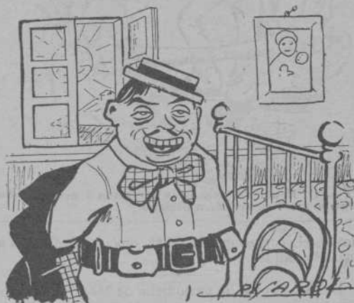
Y á un home que ha fet tanta feyna en tan pocas horas, ¿s'atrevirán á dirli que ha perdut la nit?