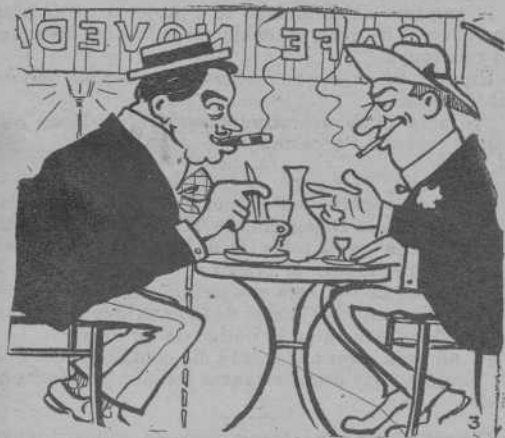
A las 10 ja es á Novedats.