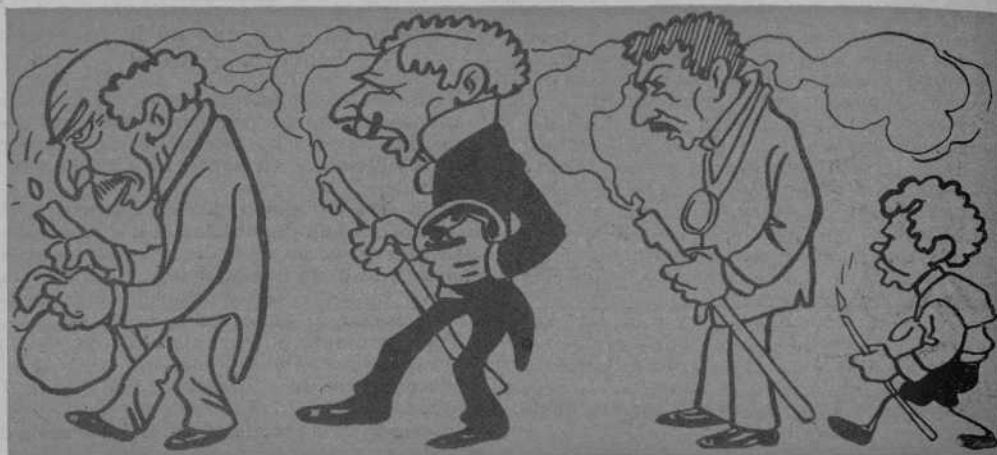
Personal que per tradició

Dijous: Pruebas eliminatorias del torneig d' esgrima.