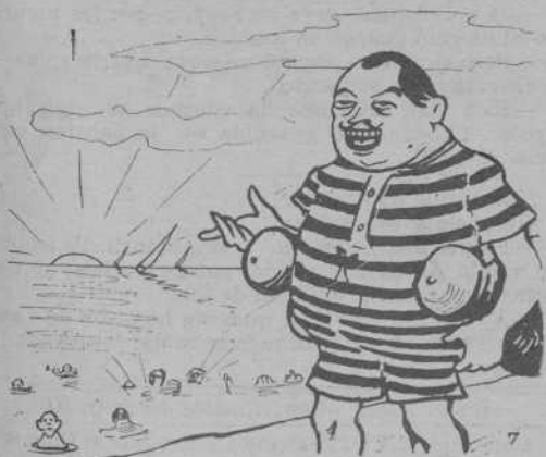
A las 4's presenta á la Mar Vella.