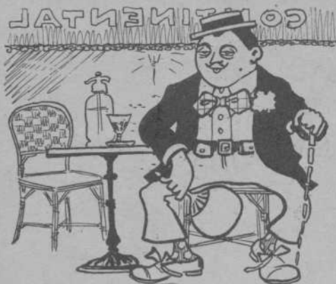
A las 8 en Pepito pren l' absenta al Continental.