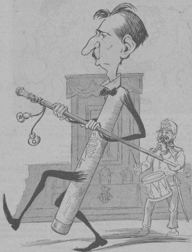
El ball del Ciri.