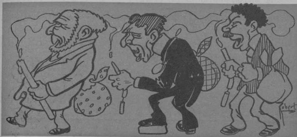
may pot fer falta á la professó.

grama han tingut de posarhi com á elements de festeigs las corridas de toros y las funcions de teatro, res els costava d'allargarse una mica més y nutrirlo ab uns quants números de tanta ó més importancia que aquests.