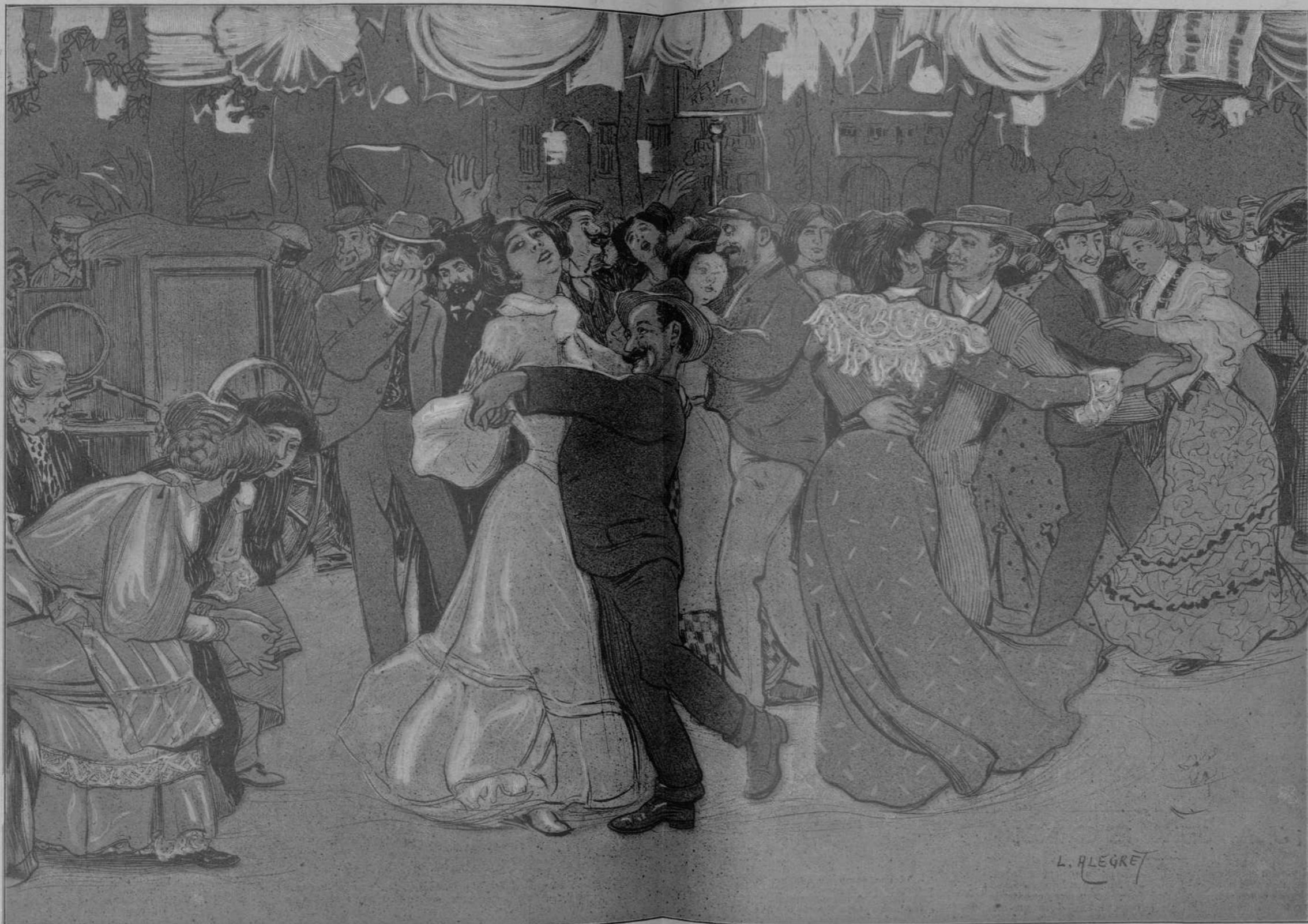
Davant de cal adroguer