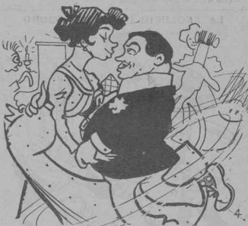
A las 12 las hi cargola á "La Azuzena púdica".