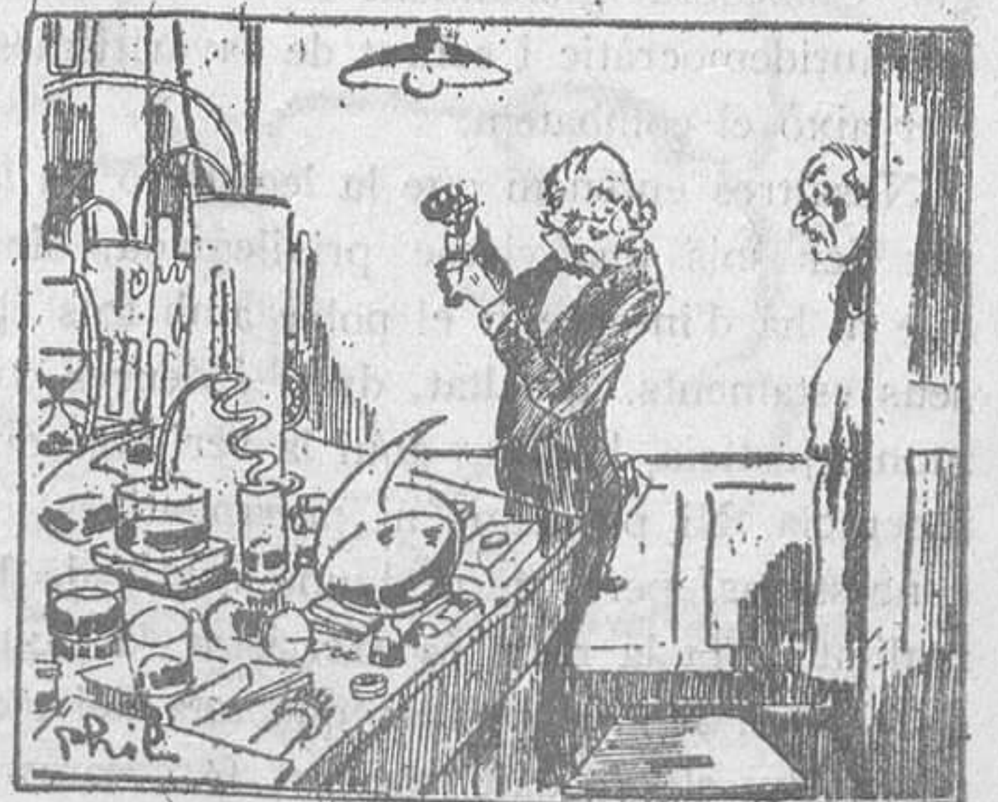
—Senyor, acaben de trencar el tub dels bacils del còlera! —Més igual; ja en tinc d'altres.

Lord Thomson, ministre de l'Aire, era un mestre d'estudi, fill d'un camperol escocès. Ramsay MacDonald, primer ministre, era un dependent. Snowden — l'home del