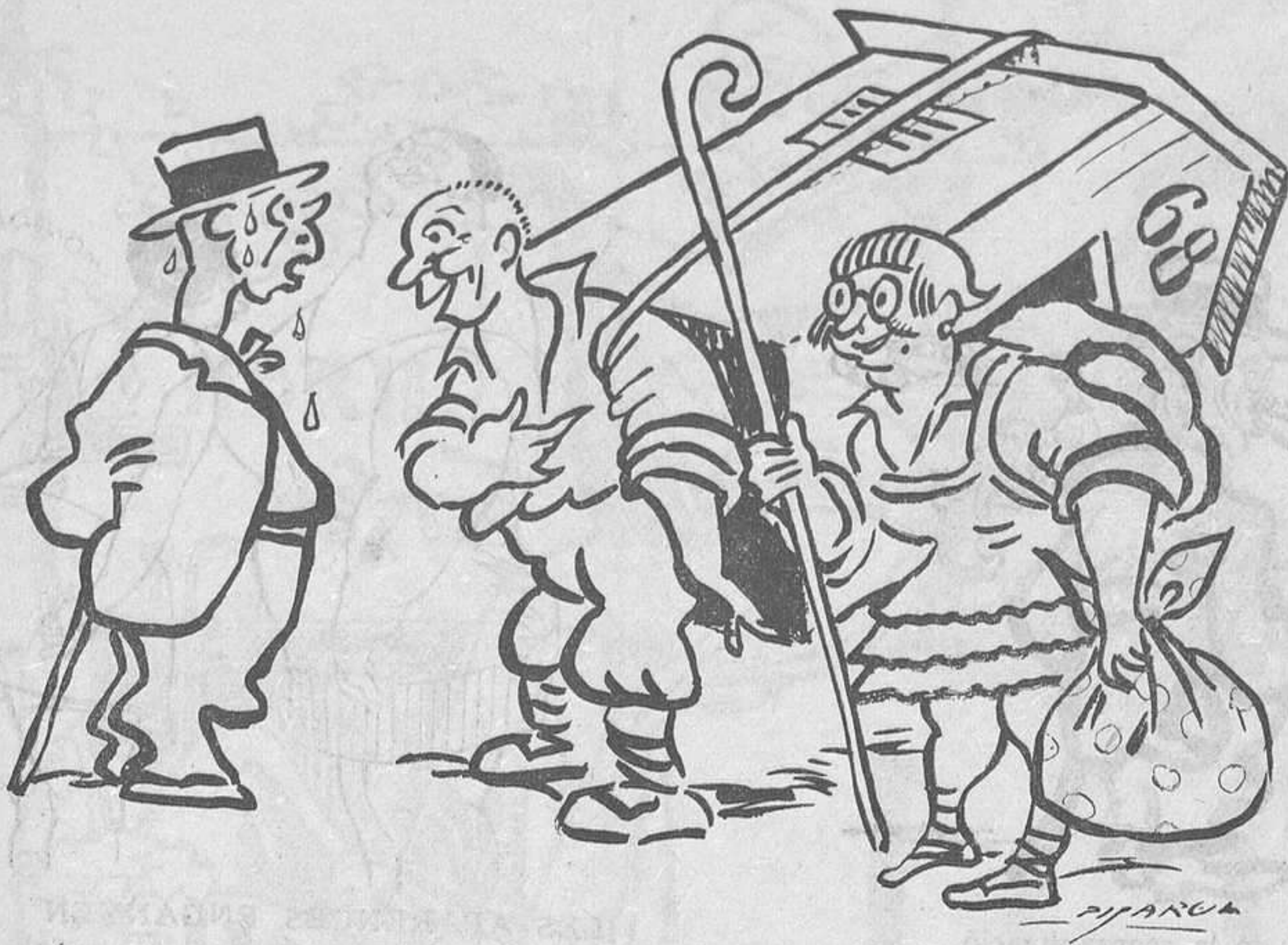
DESPRES DEL TREBALL