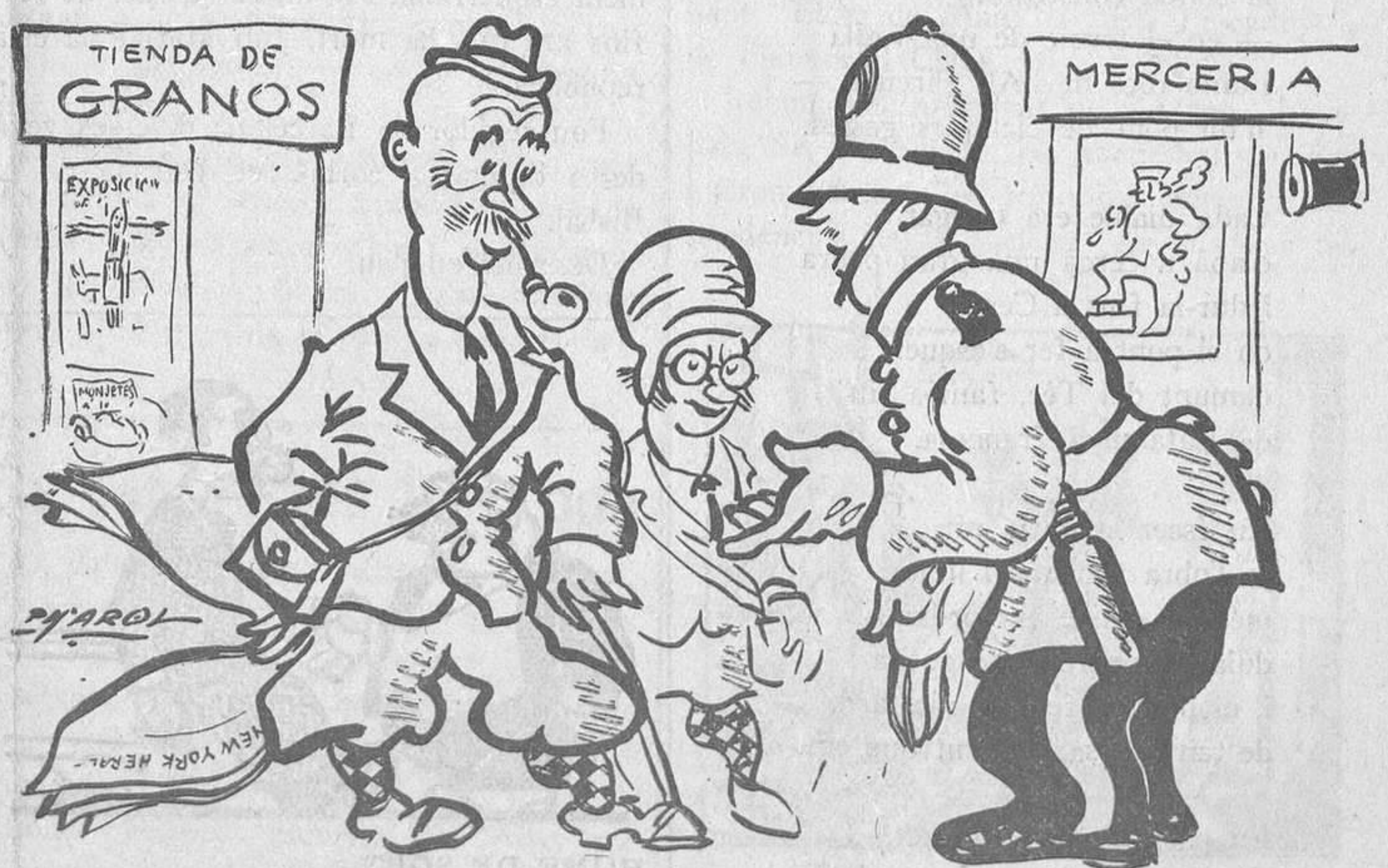
—Es una Exposició única al món. Quan arribem a Xicago, la donarem a conèixer.

L'esdevingut, com poden suposar els lectors, té una importància capital, un interès marcadíssim. Es discuteix llargament en