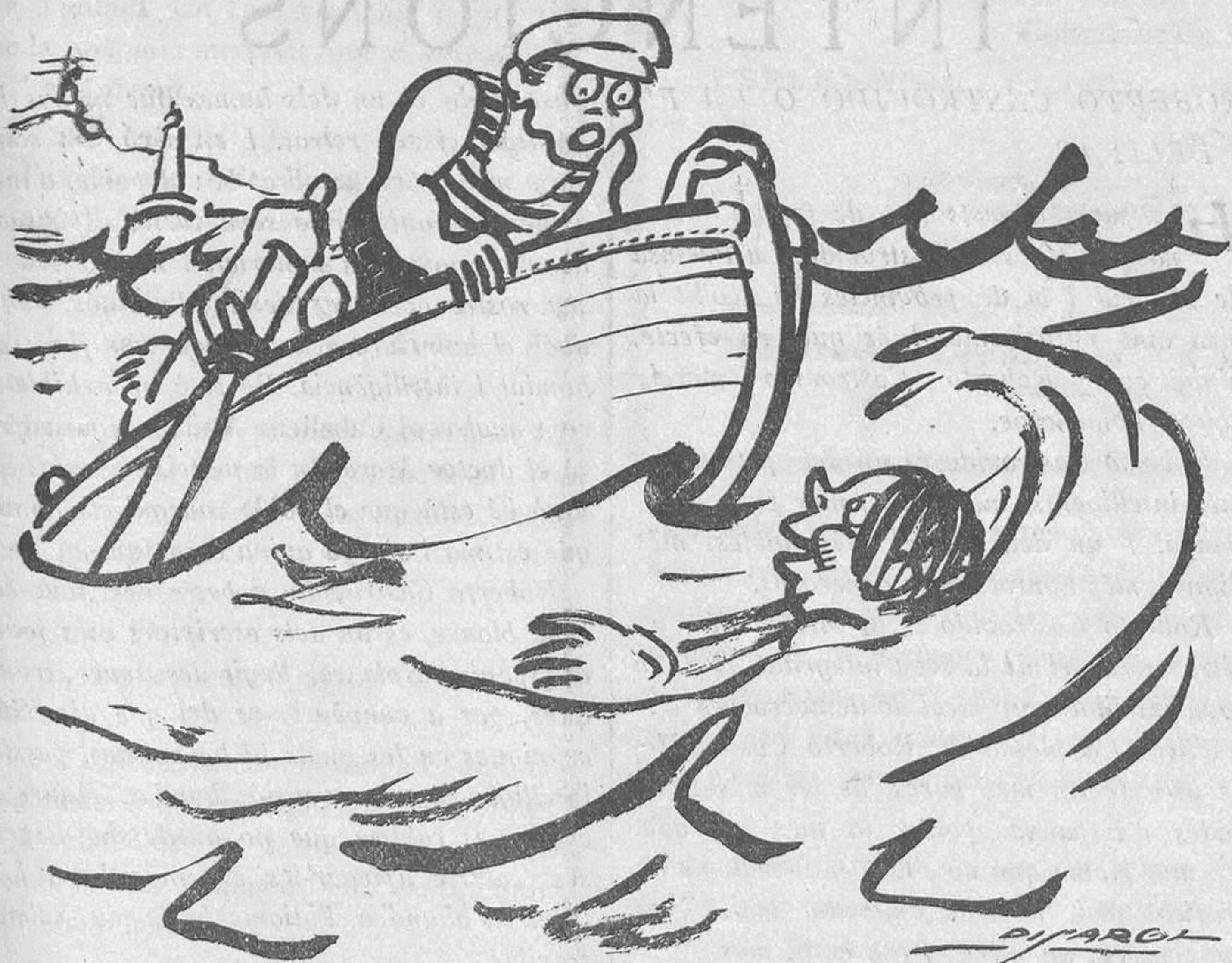
EL FALS NAUFRAG

I és que, potser un xic tard, comencen a veure els governants que és arribat el jorn de seguir una política més econòmica veritablement.