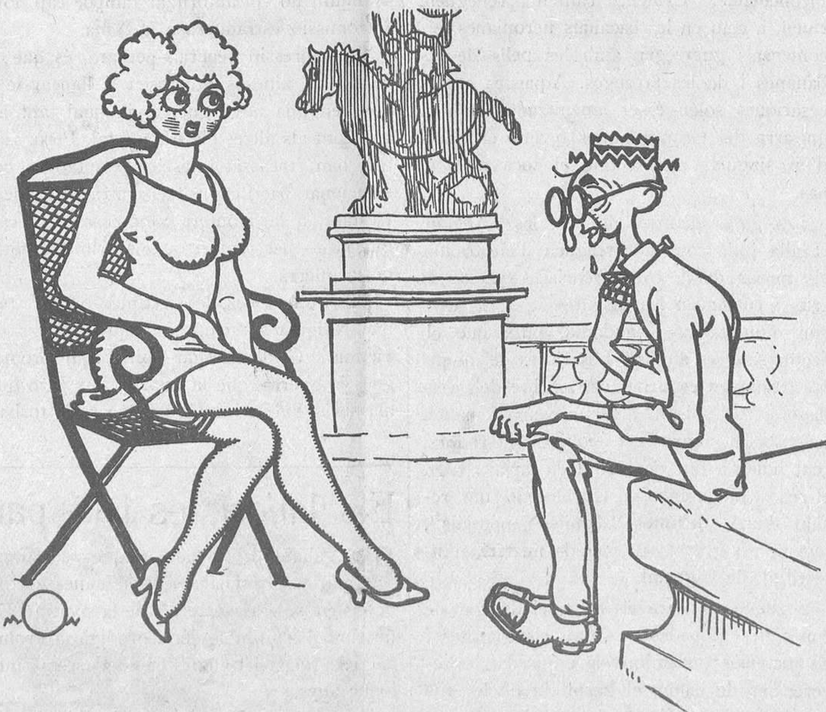
EL RESPECTE A LES SENYORES

—Faci la mercè de no mirar-me d'aquesta manera tan descarada, o, del contrari, cridaré un guàrdia!