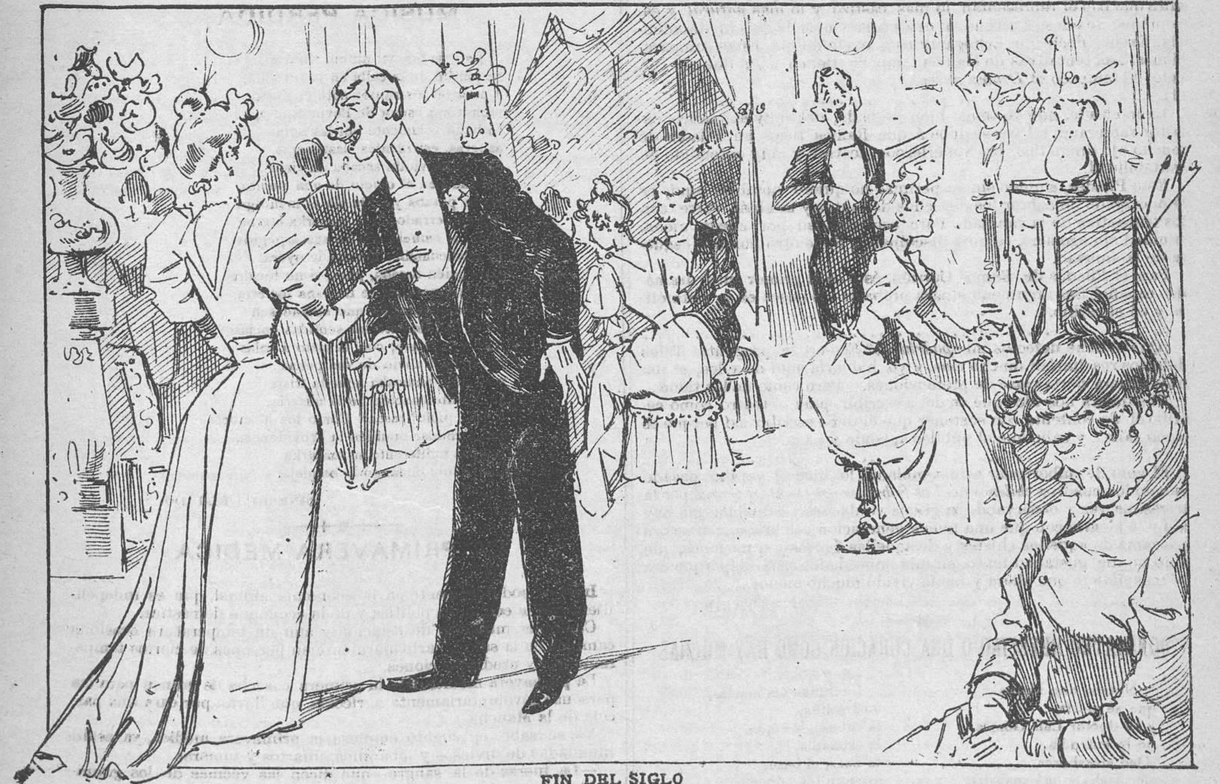
FIN DEL SIGLO