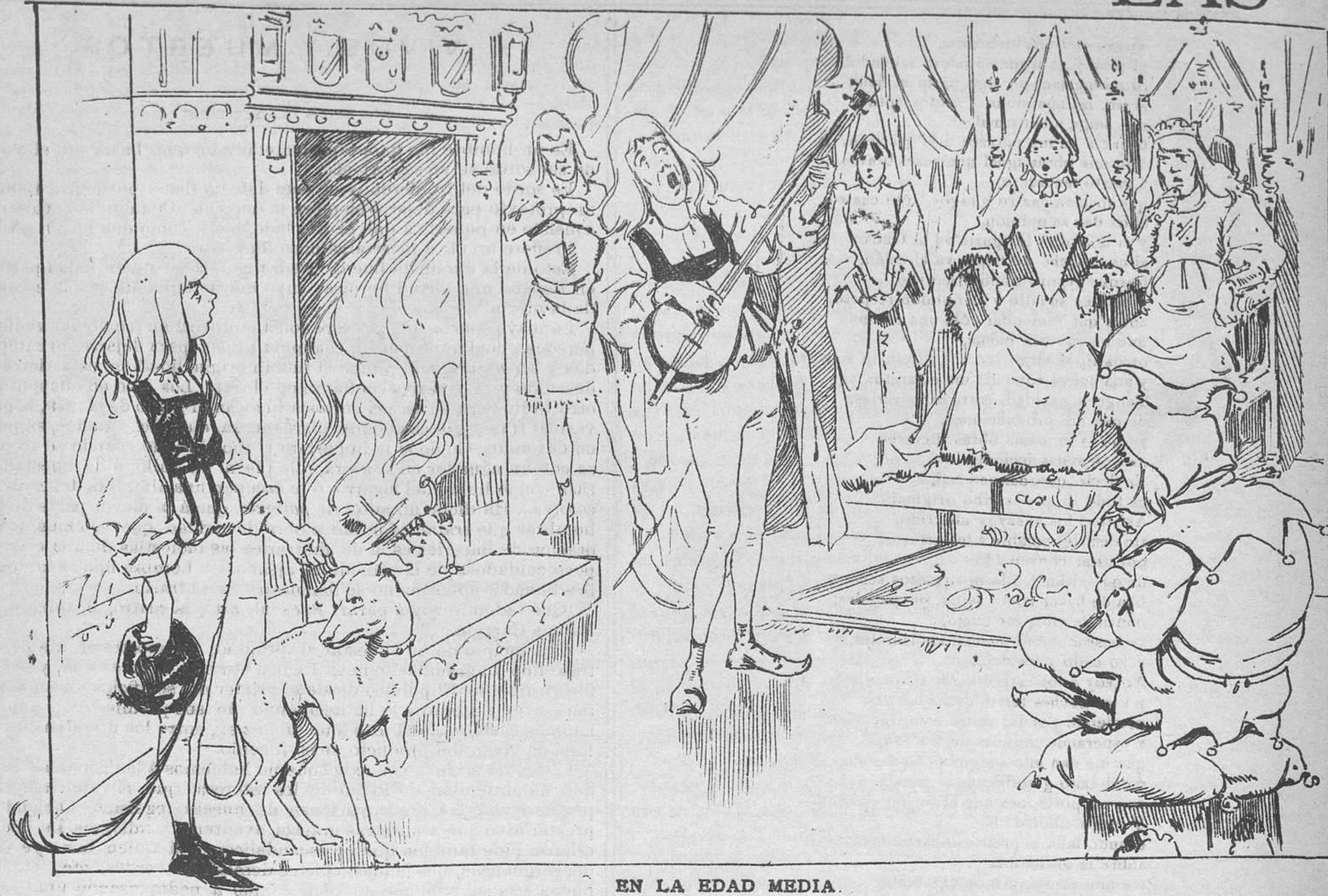
EN LA EDAD MEDIA.