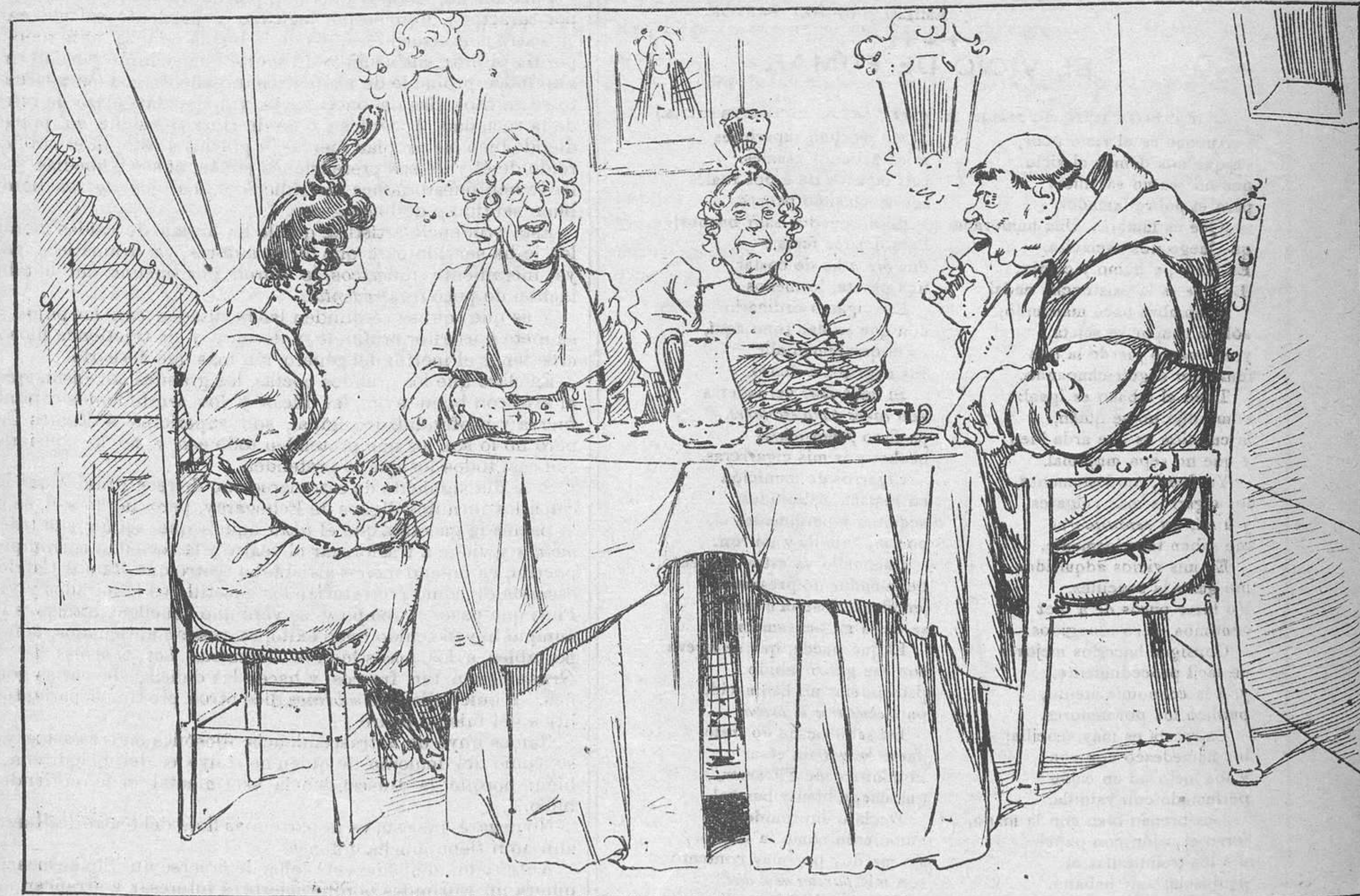
Á PRINCIPIOS DE SIGLO XIX