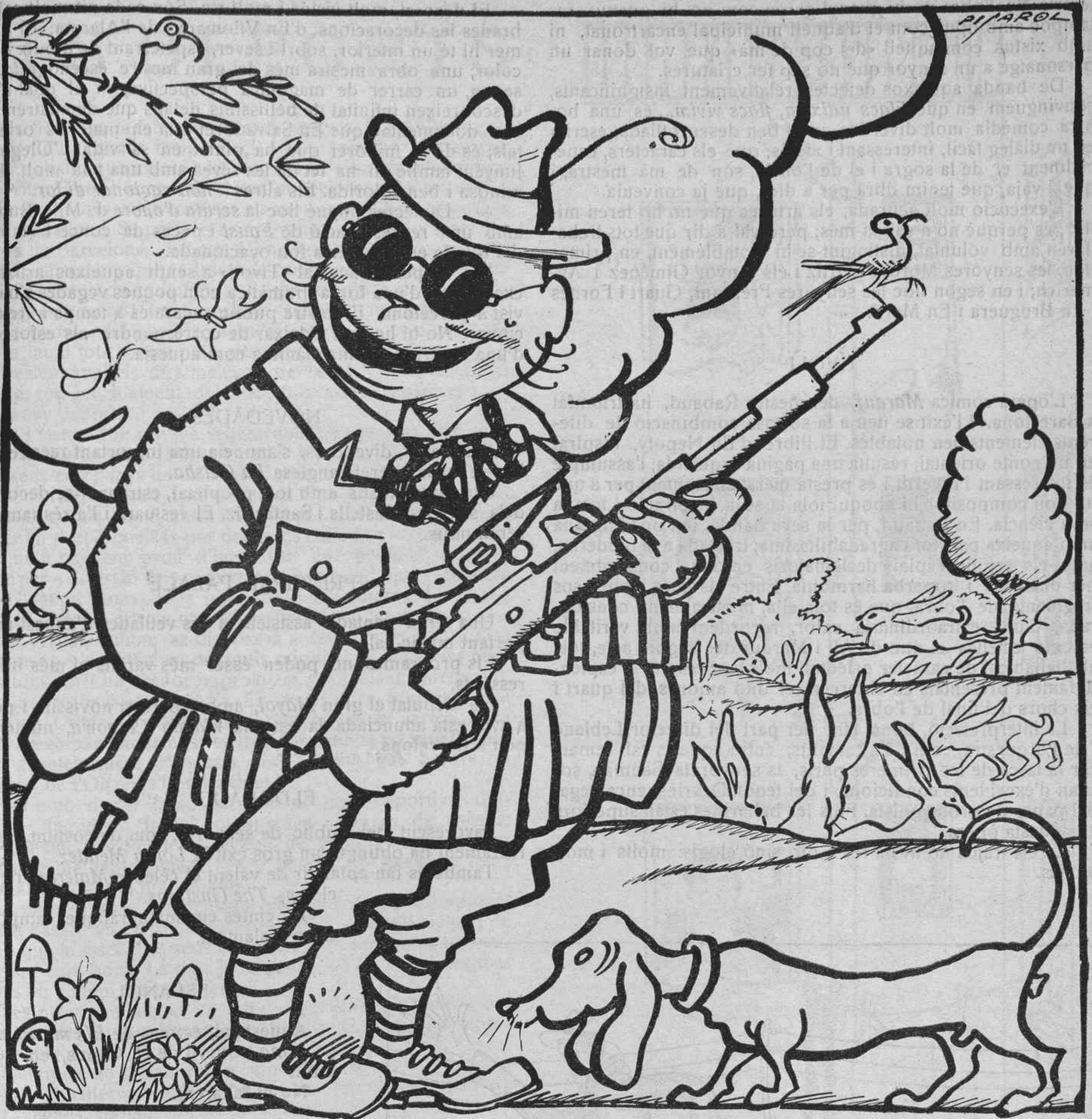
EL SENYOR ESTEVE DE CAÇA

—Caram!... Ara em recordo que encara no m'han donat la «licència».