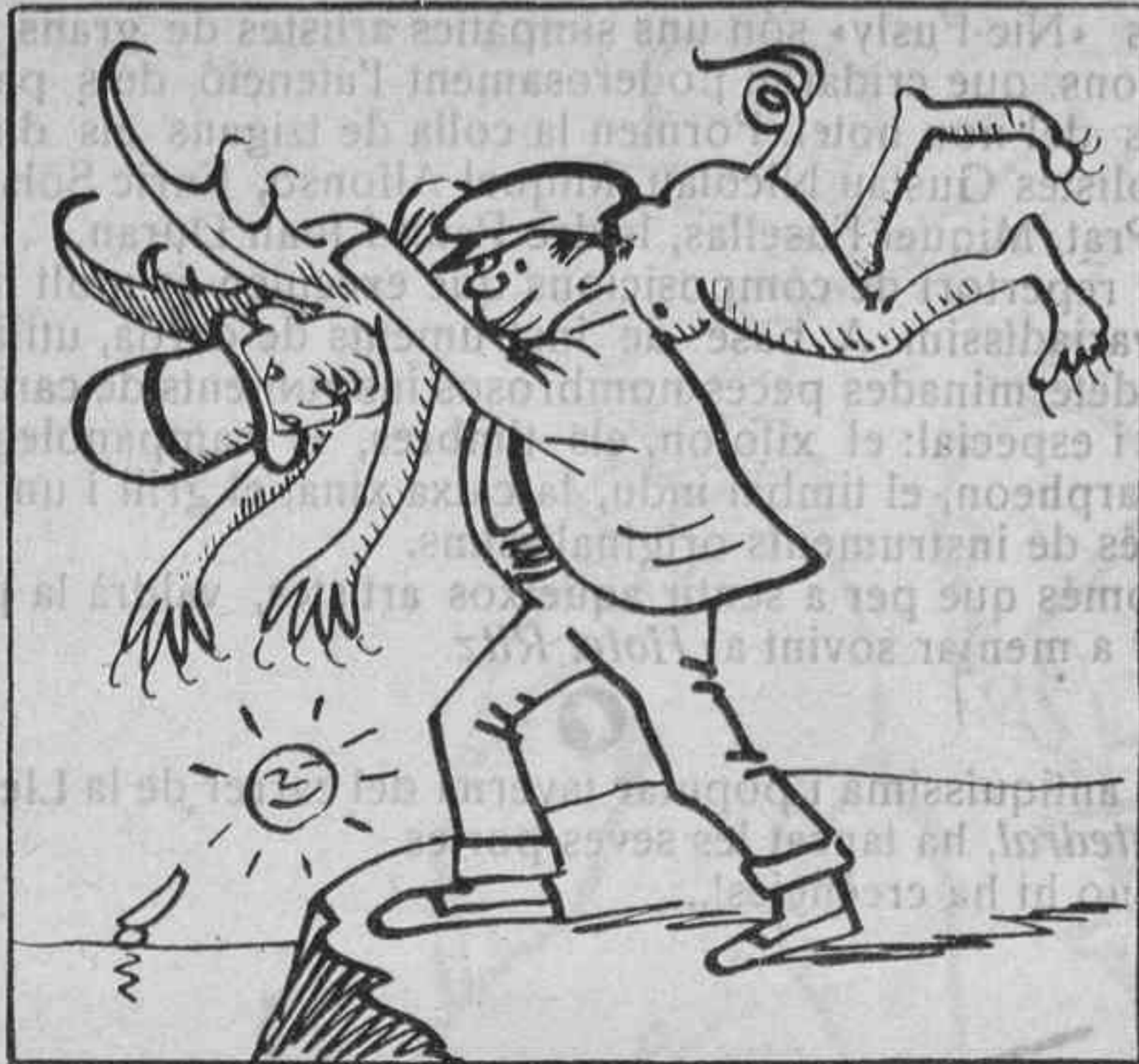
Mirad a un hombre cargado porque el pícaro se lleva en las espaldas al diablo.

La nostra Diputació ha enviat un telegrama an En Sánchez Toca demanant-li el restabliment de les garanties.