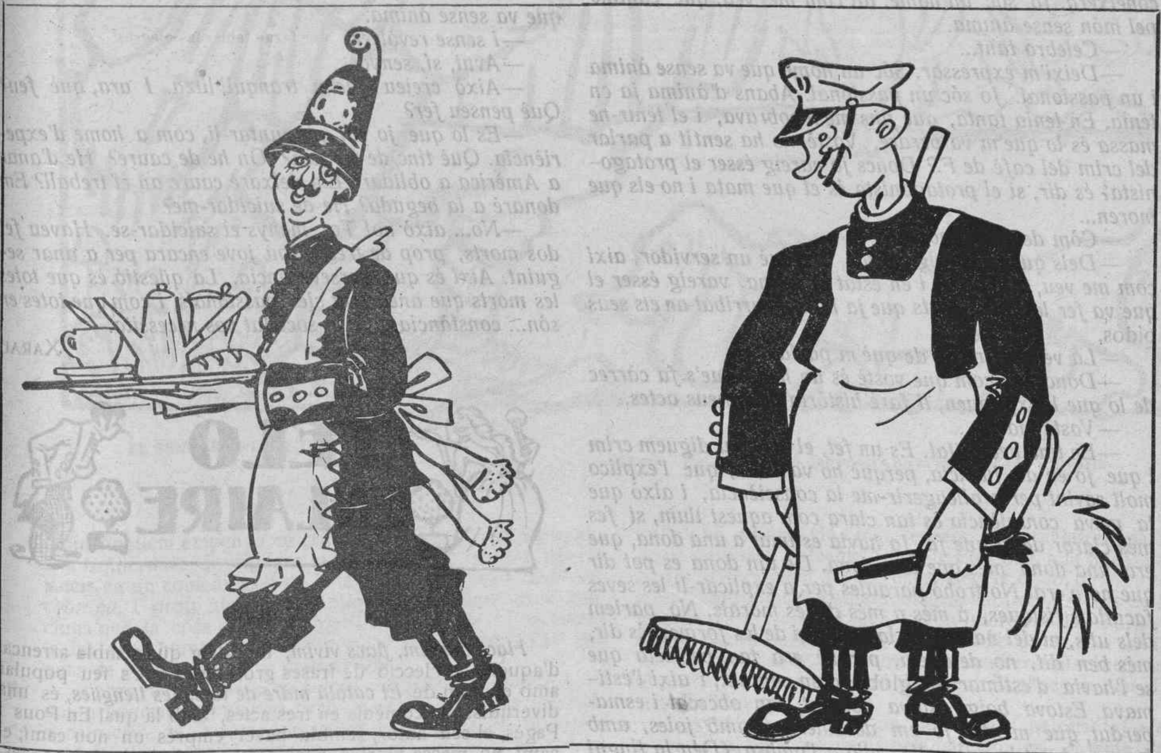
—¡Que un hombre de mi linaje descienda a tan ruin mansión!

—Ah, si?... Això rail... Així el pagaré amb el temps!