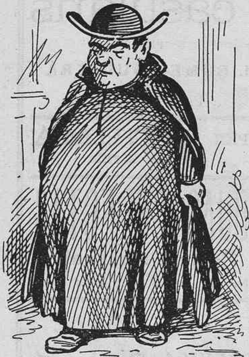
Perque hasta 'm sembla qu' es bo per la salut.