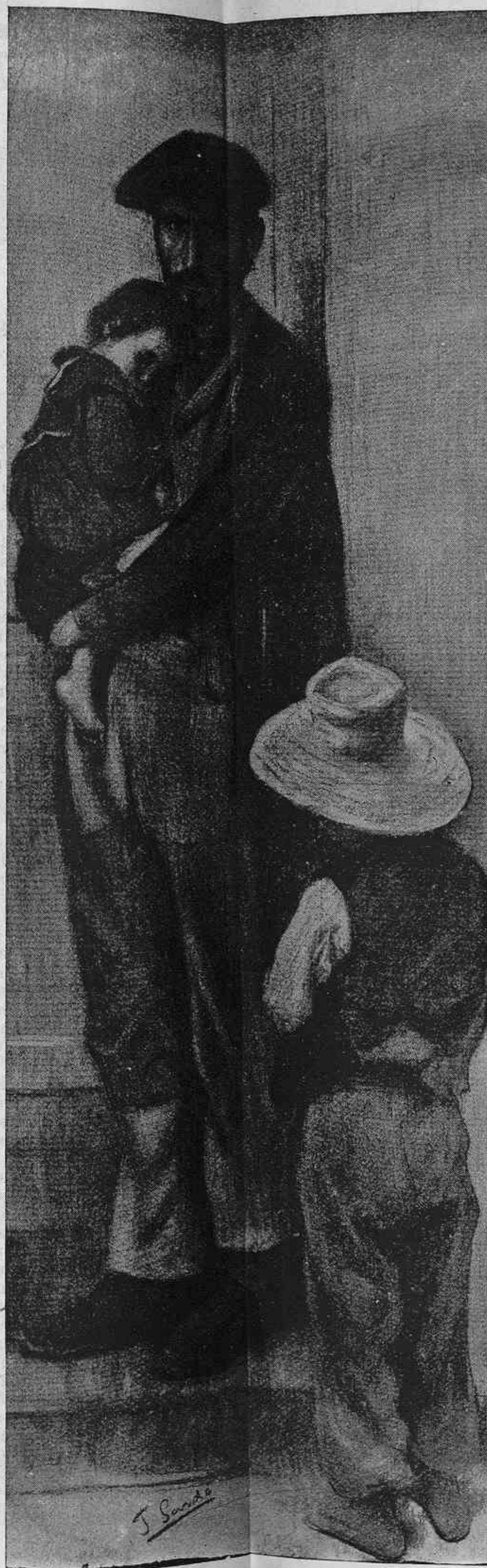
De porta en porta.

en Beethoven, en Schumann y en Bach haurían abressat plens d' efusió á uns artistes tan possessionats de sas admirables creacions. Ells haurían dit de segur:—Aixís y sols aixís es com se 'ns ha de interpretar.