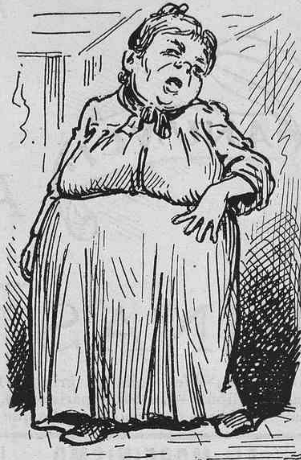
Per veure si se 'm rebaixa aquest greix.