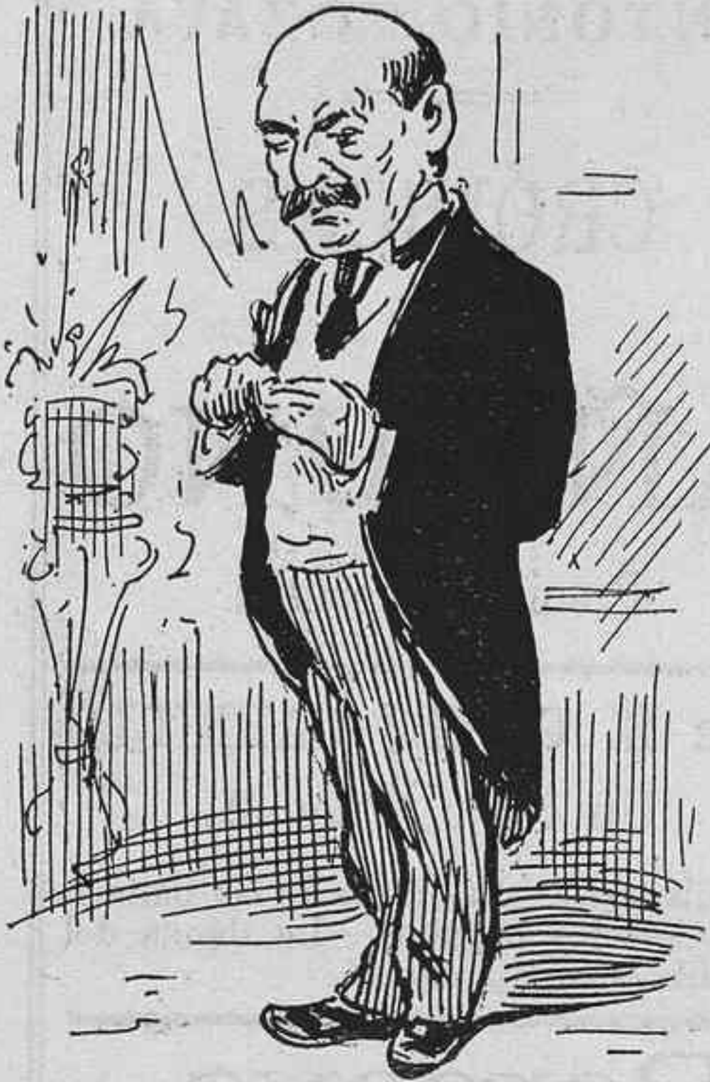
Per tenir contenta la dona.