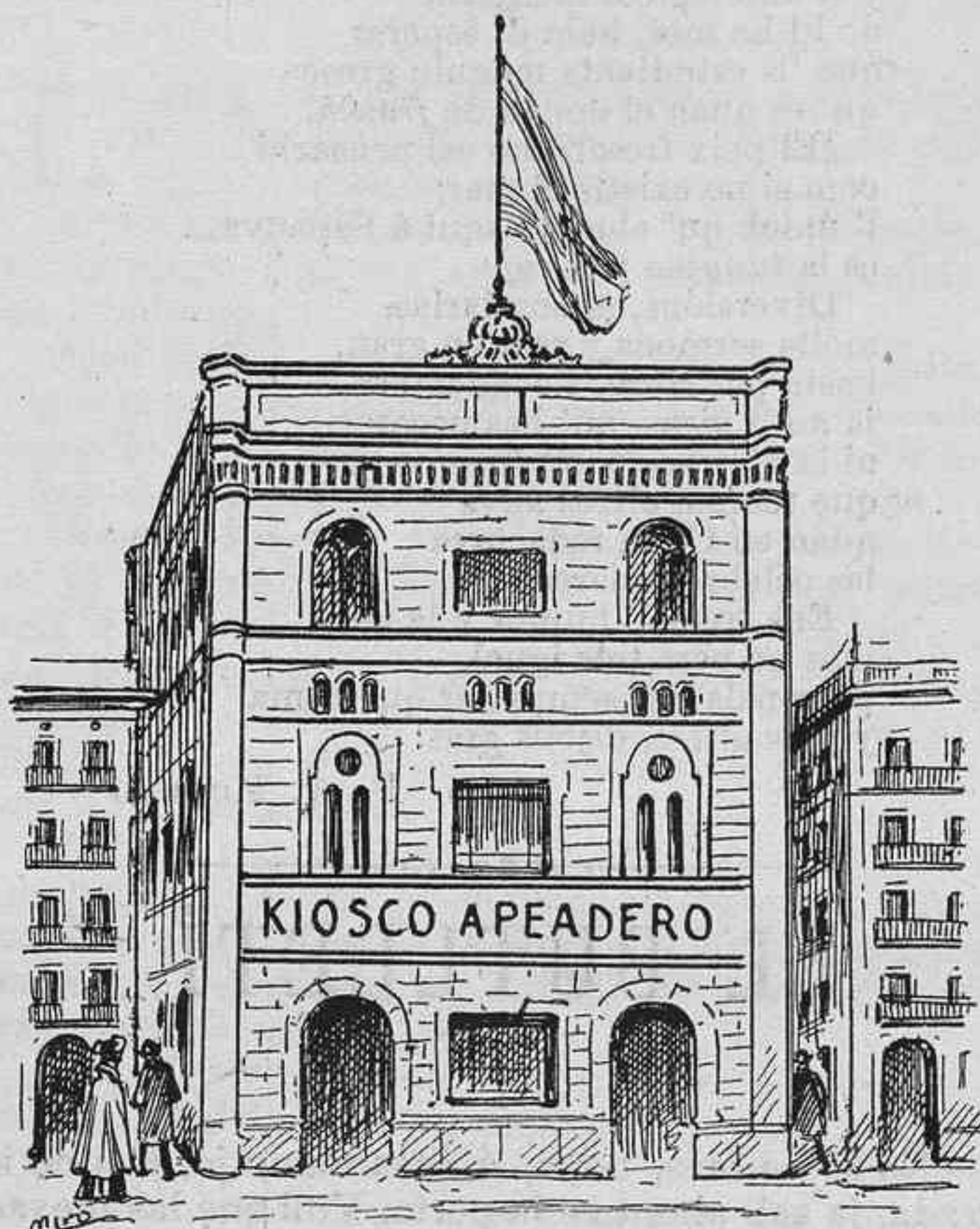
D' aixó, la Companyia del ferro-carril ne diu un senzill apeadero!