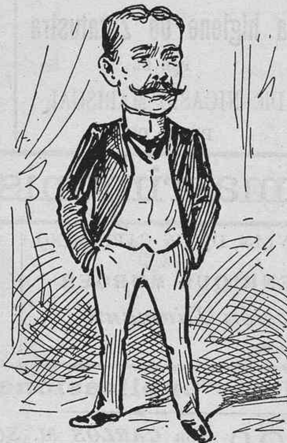
Perque la xicoteta m' ho ha demanat.