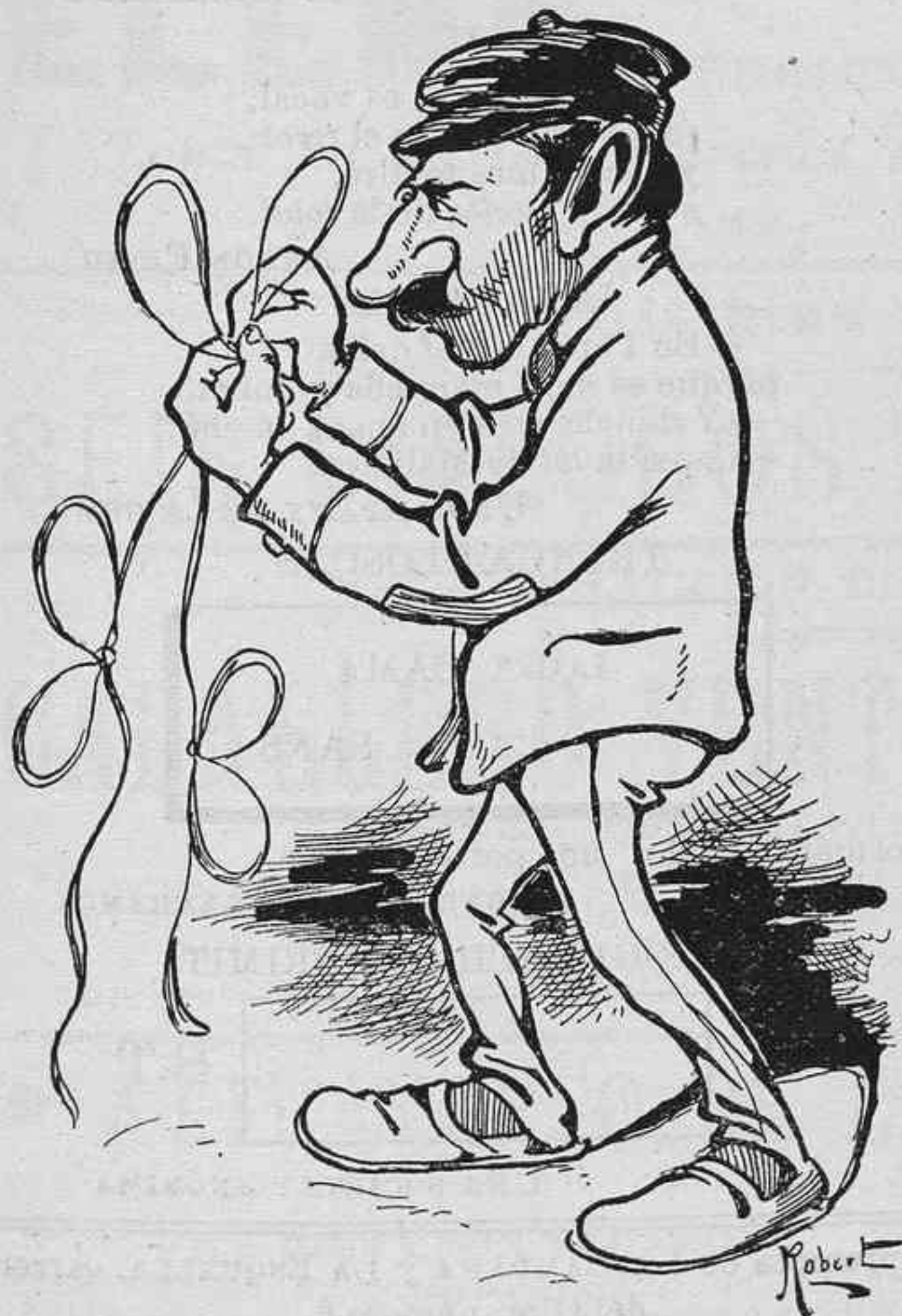
Un vaguista... que treballa.