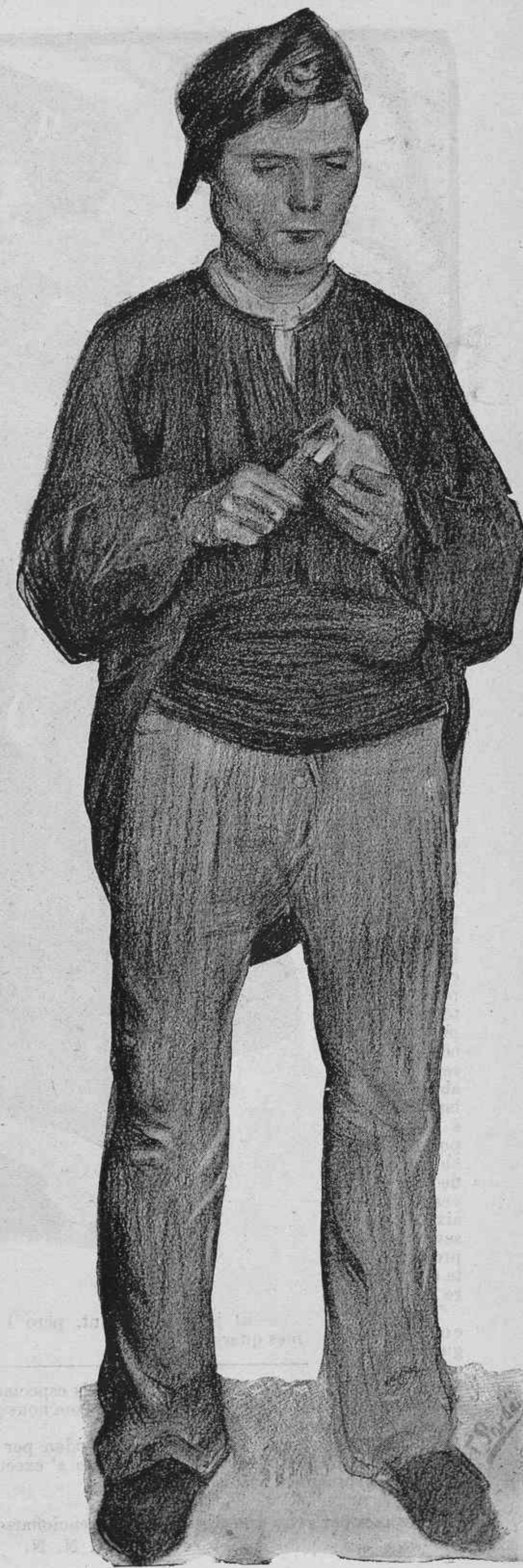
Dibujos de F. SARDÁ

En la qual, ademés, tindrem ocasió de parlar de l' última obra de 'n Guimerá La pecadora , sí, com está anunciat s' estrena 'l próxim dimars, día 14 del corrent.