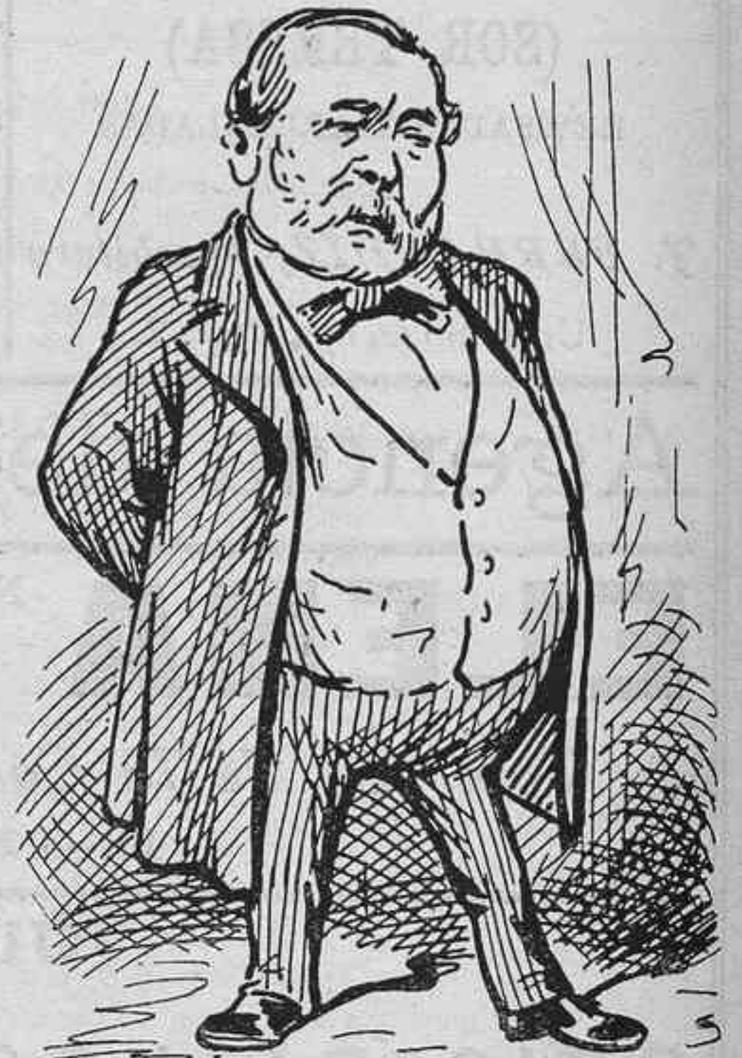
Perque la gent d'ordre hem de donar bons exemples.