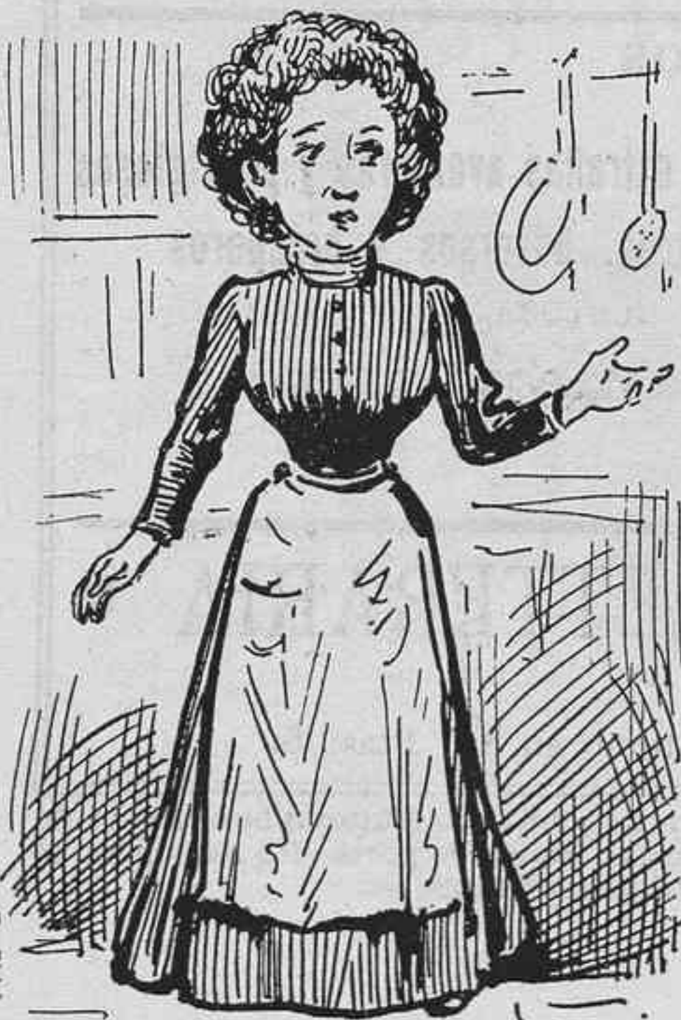
Perque es costum de la casa.