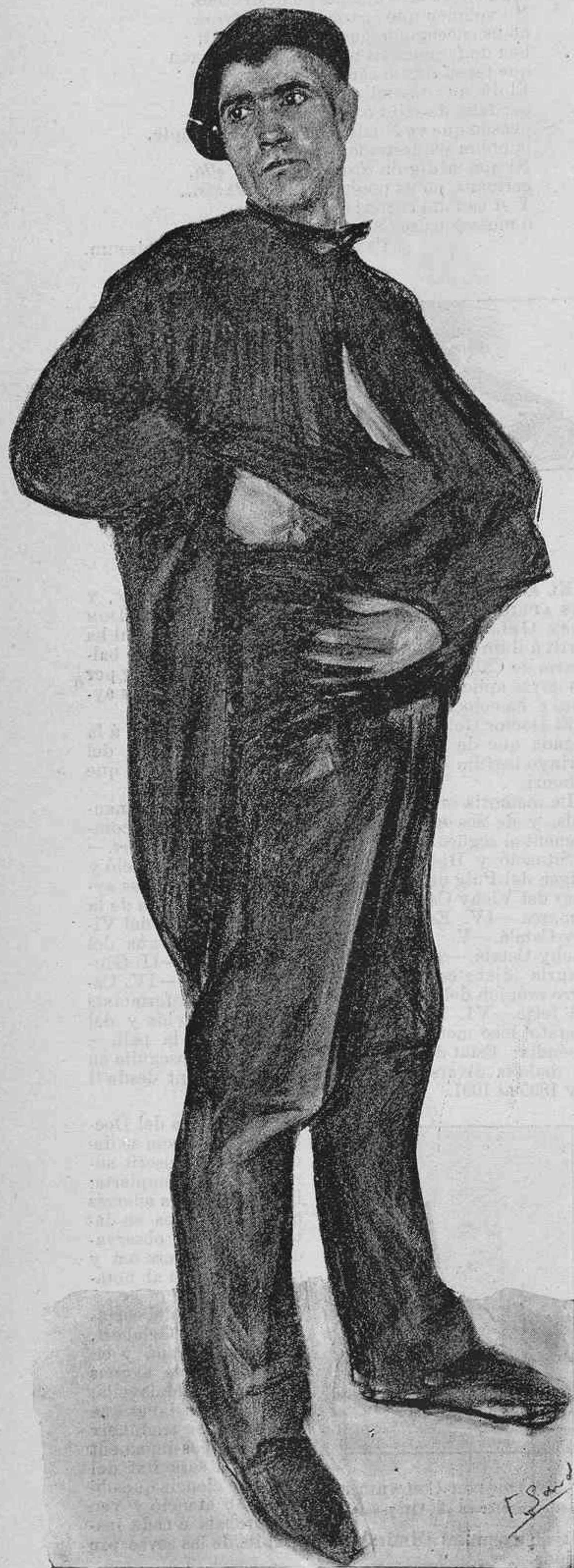
—Per avuy ja tenim seguras las bessas.