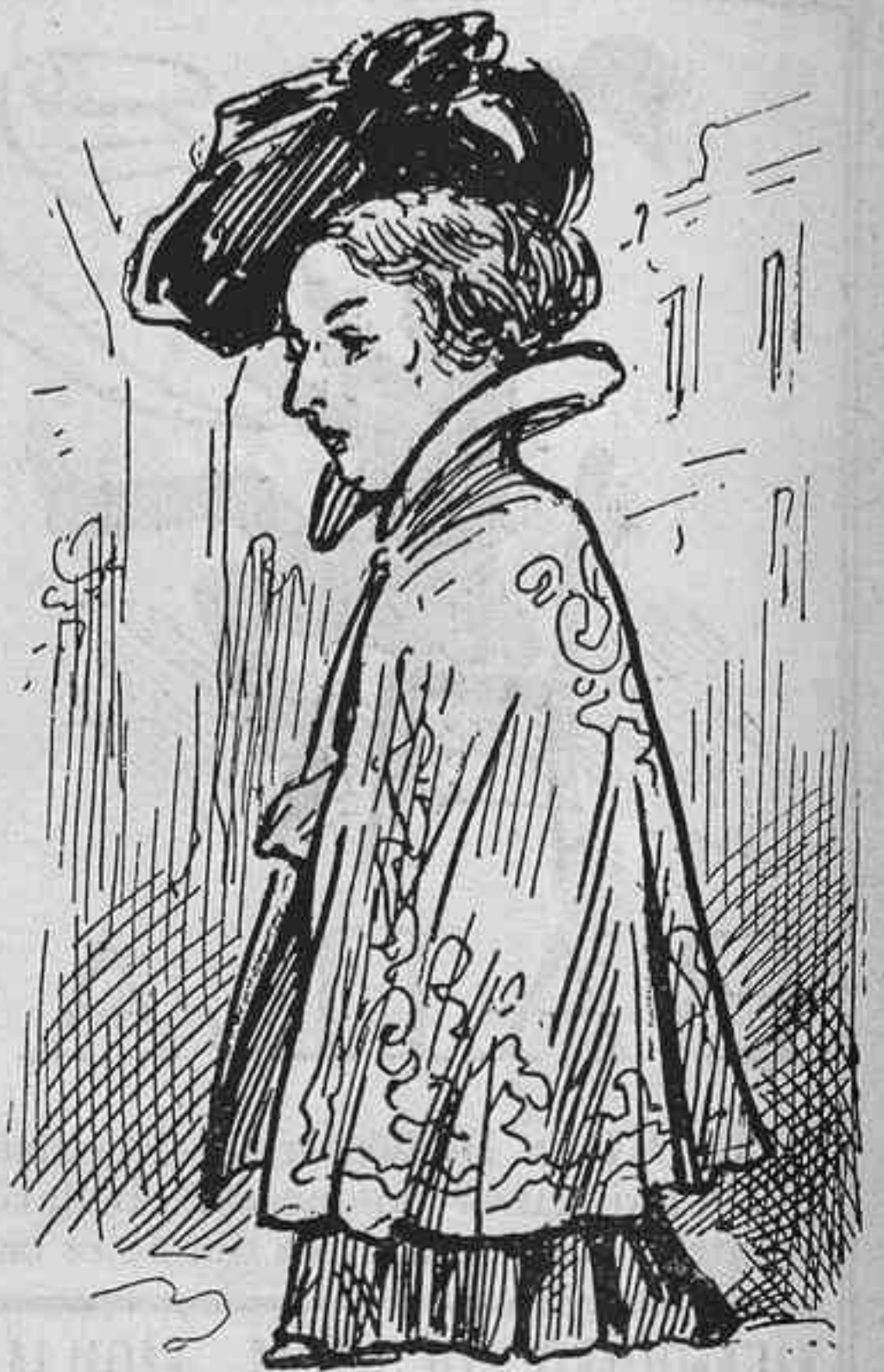
Perque fá ff.