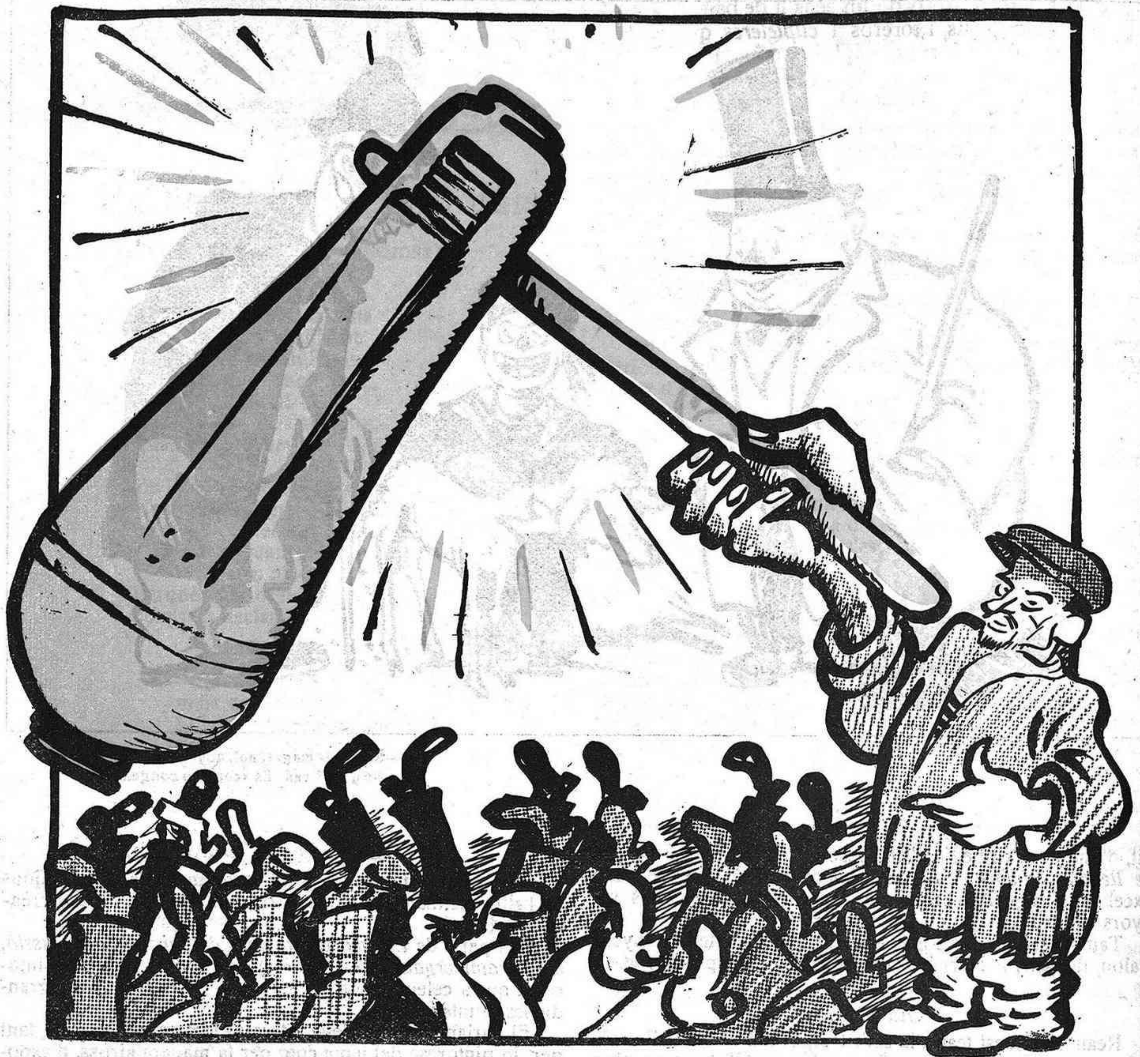
EL XARRAC ESTRIDENT

—Estimats barcelonins, ja veig que'l vostre mal no vol soroll.