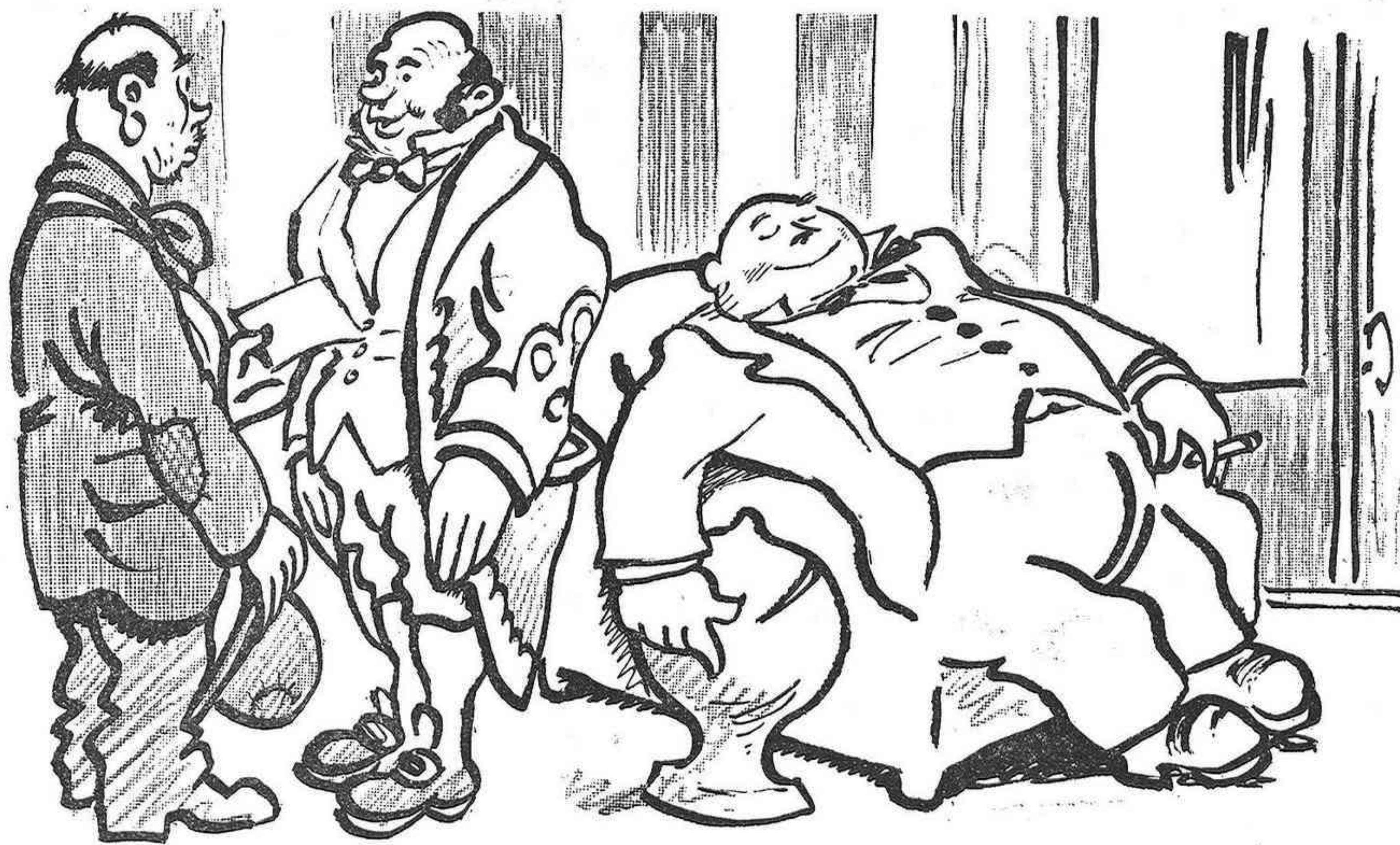
LA MALALTIA DE MODA

—Home; si i no. Ja, ja, ja! Deixi'm desar l'establiment. No vol pas res abans? Quina, rateres pràctiques