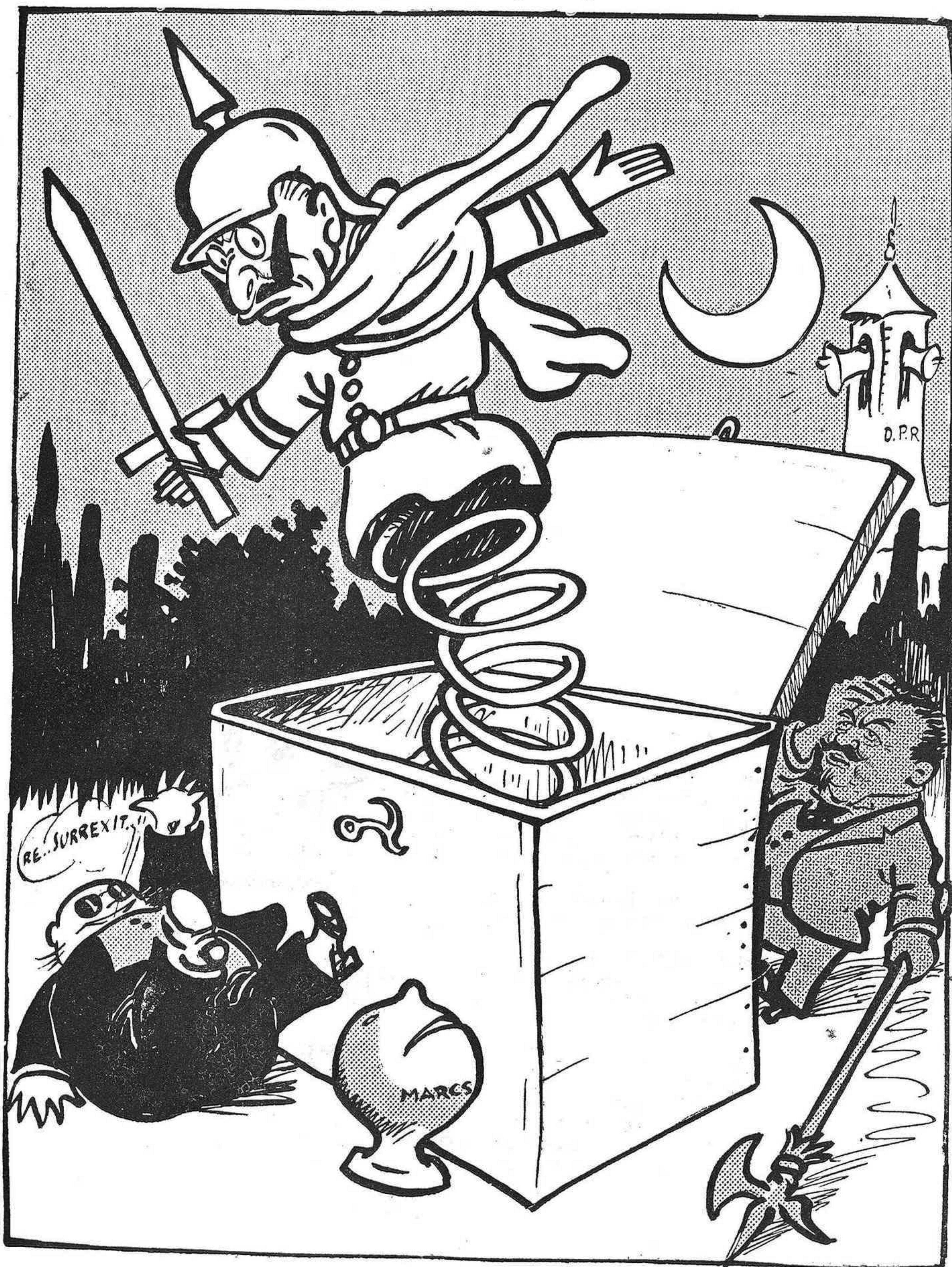
RESURRECCIÓ DE BROMA

Un Crist de caricatura que cada any, resucitat, tornarà a la sepultura.