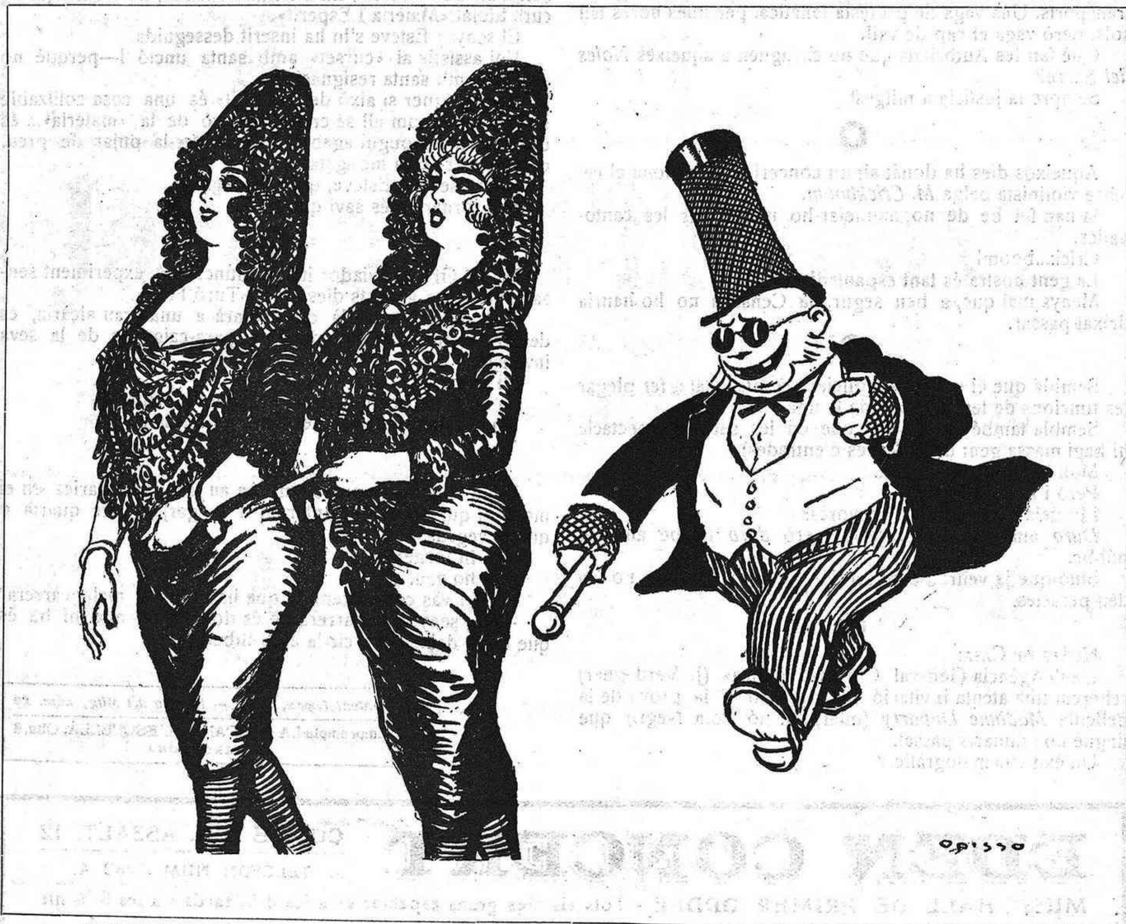
AL CARRER DE «FERNANDO»

— Ah, salau!... Qui no sent devoció en aqueixos dies?