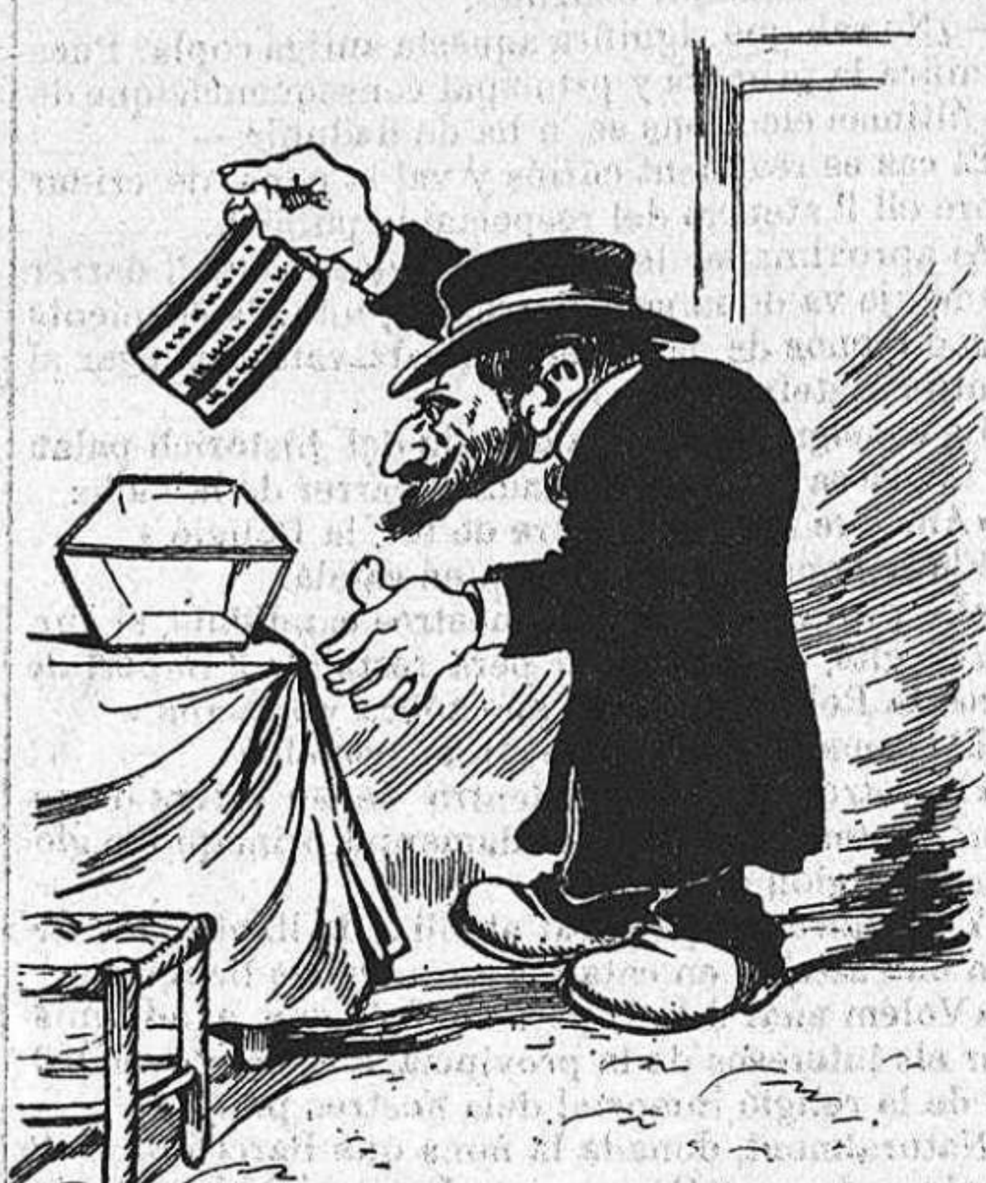
—Déixime votar primer que ningú, que nosal tres portem sort.

popularisi en profit de la seva causa, després deu penjarlo pera fer justícia, y 's guanyará las simpatías de tots els naturals de aquella comarca, adquirint fama de justicier.