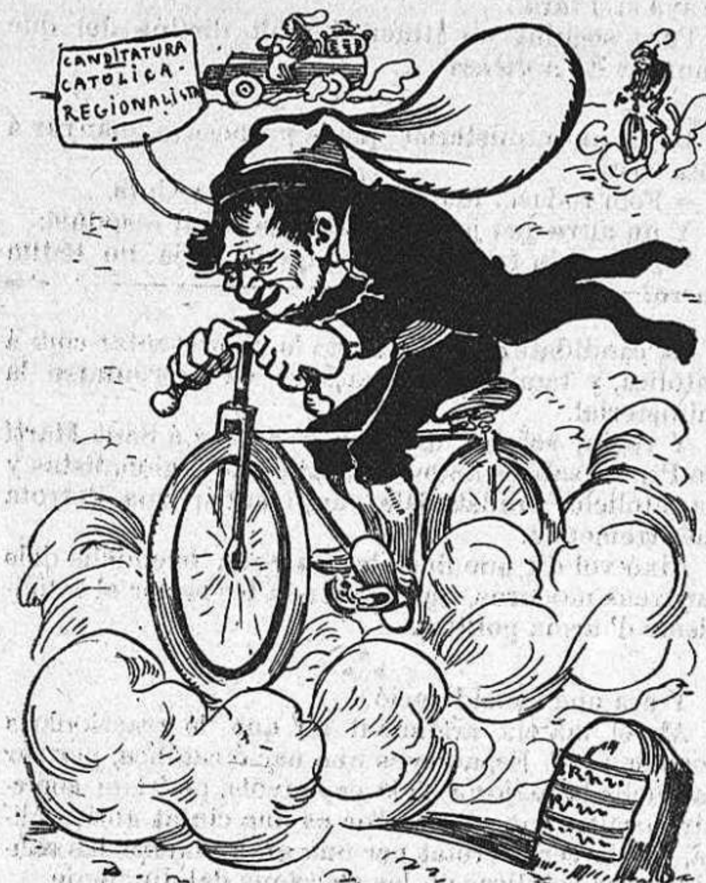
Bicicletas, sembla que n tenfan moltes: lo que no tenfan, vots.