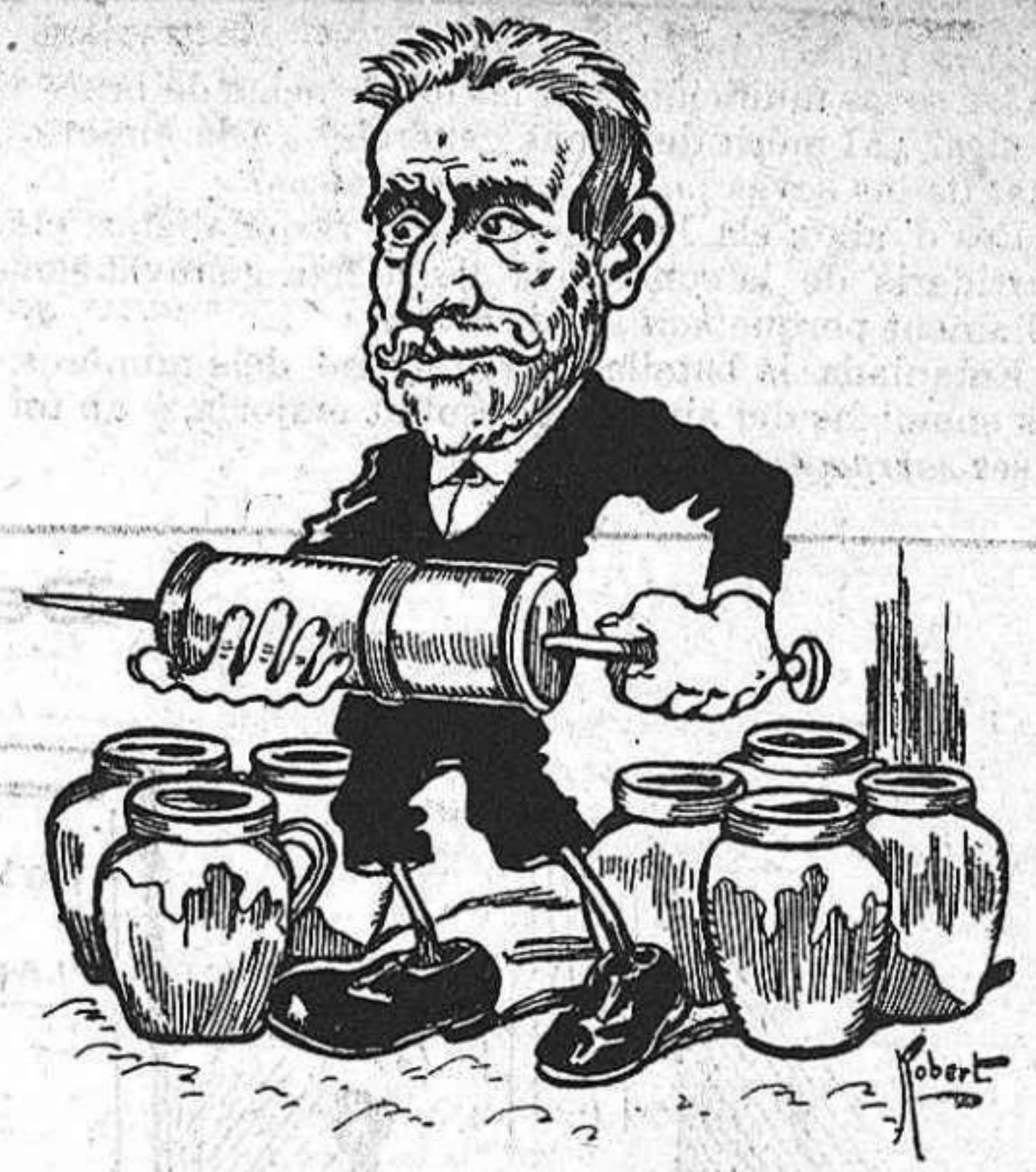
—¿No diu que 'ls regionalistas solicitan la meva ajuda? Que vinguin.