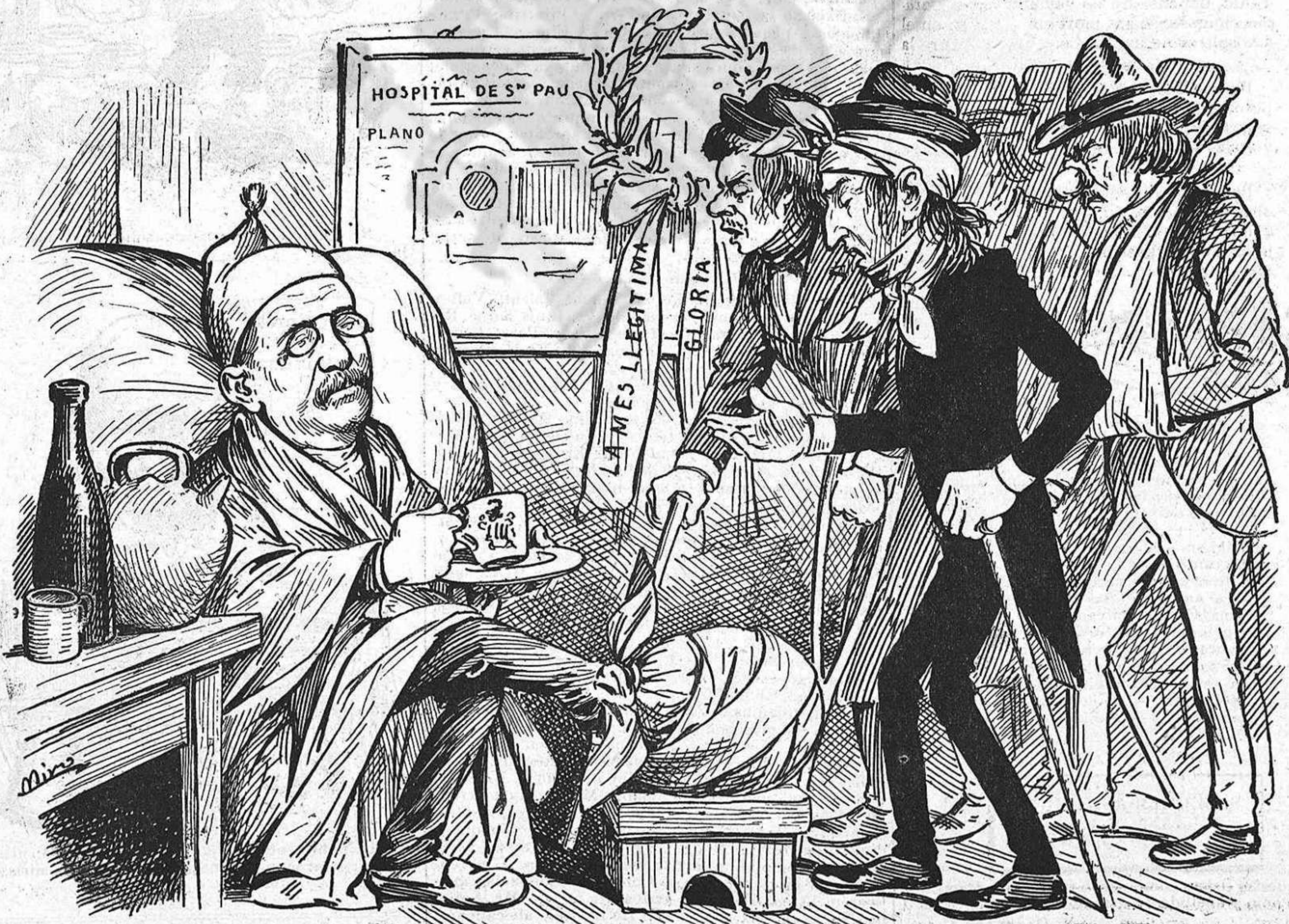
—Senyor Doménech, cuyti, fassi aquell hospital desseguida, perque cregui que 'l necessitem. ¡Estém mals, molt mals!