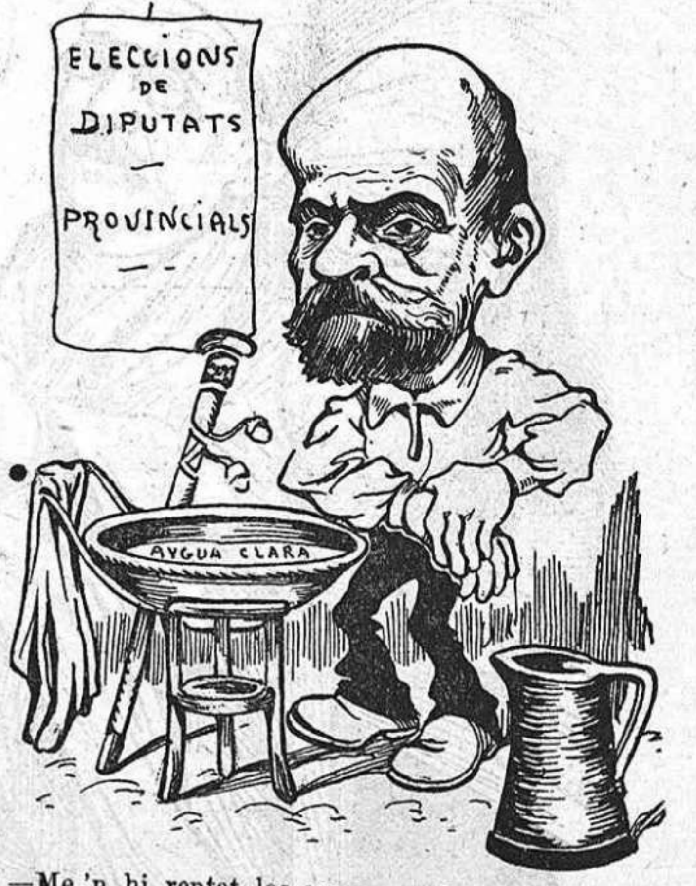
—Me'n hi rentat las mans per dos motius: primer, per demostrar la meva sinceritat; segón, per tenirlas ben netas.

Imprempta LA CAMPANA y LA ESQUELLA, carrer del Olm, número 8 Tinta Ch. Lorilleux y C.