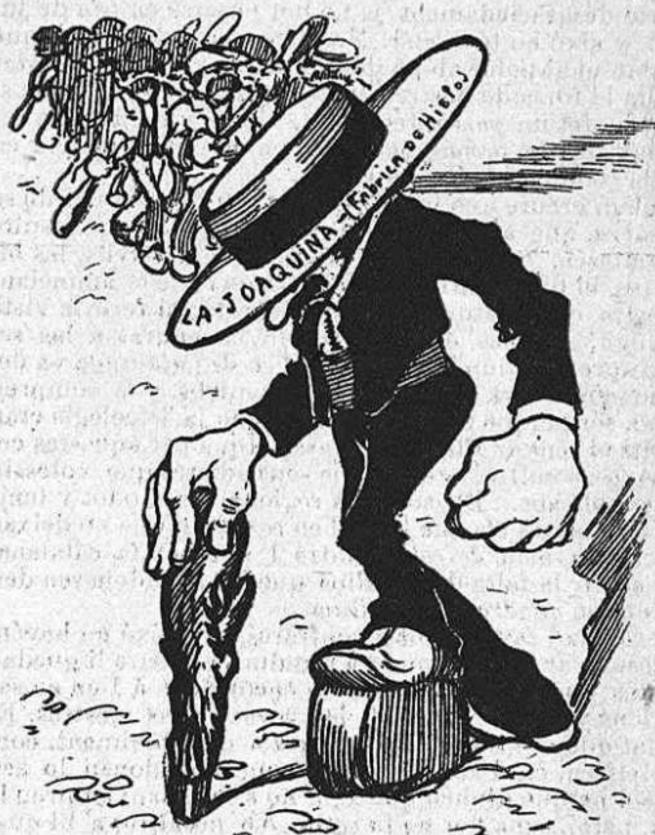
L'única autoritat que va donar mostres de la seva energia.