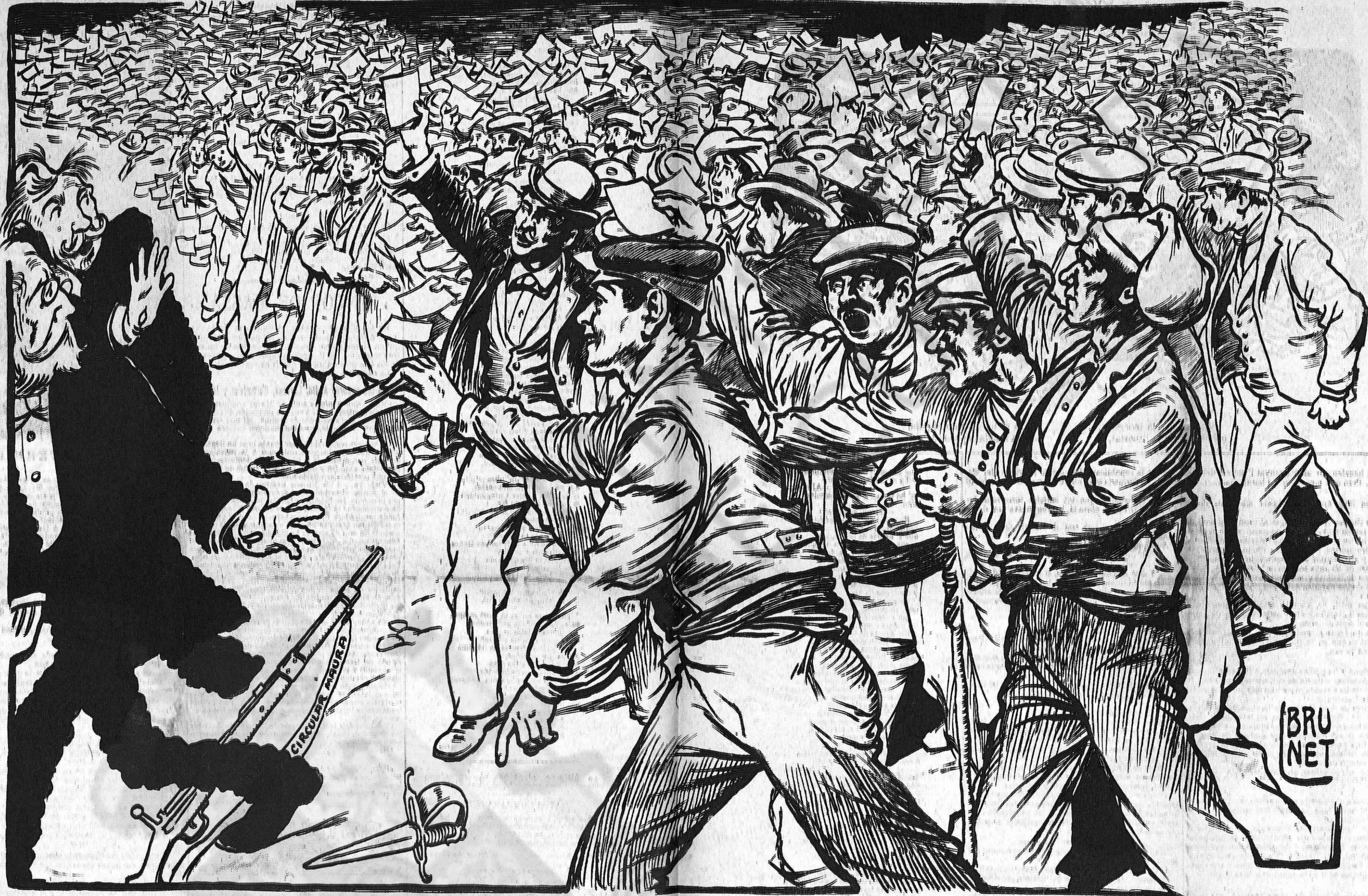
Tórnllessen al llit, senyor Silvela: si vosté té 'l mauser, nosaltres tenim el vot.