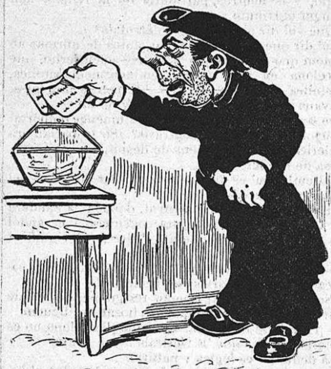
—Dos vots! El meu y 'l de la majordona.