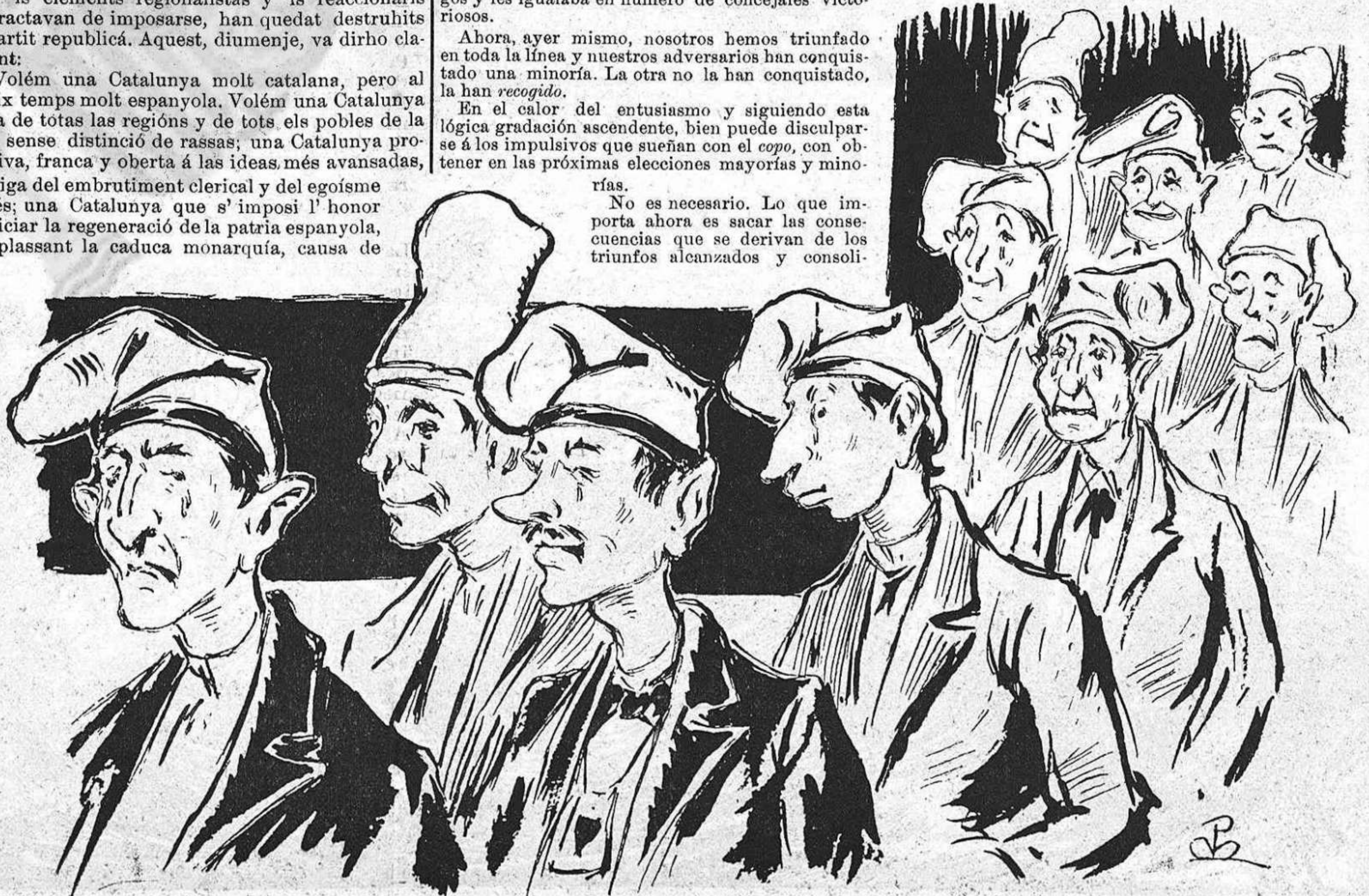
—Som segadors, soldats dócils, som segadors; mes, ja ho veuhen, de la patria y de la fé; aquest cop no hem segat ré.