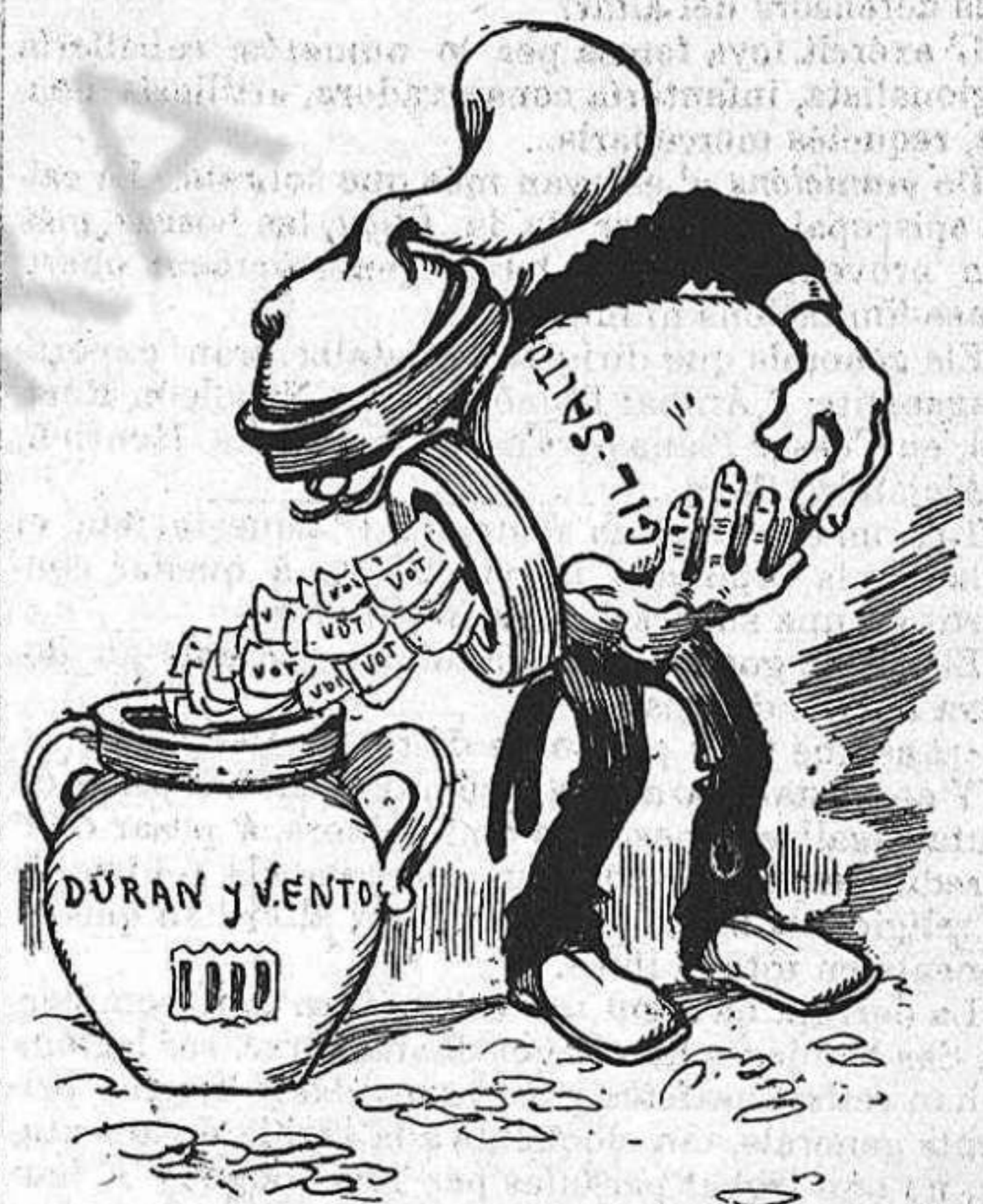
Perque fos mes lluhida la jornada, ells ab ells varen ferse tupinada.