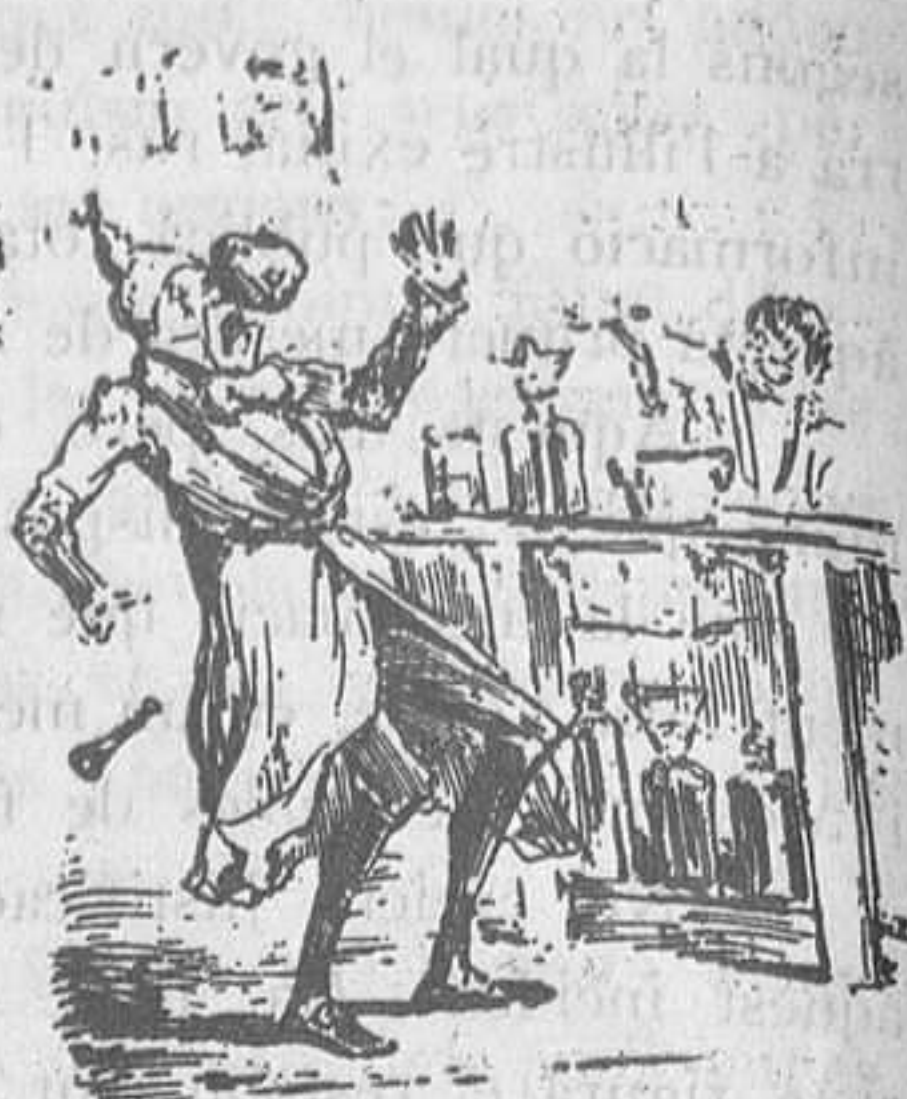
Pedrada en ull d'apotecari.