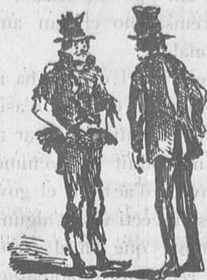
Un estrip per un des-cosit.