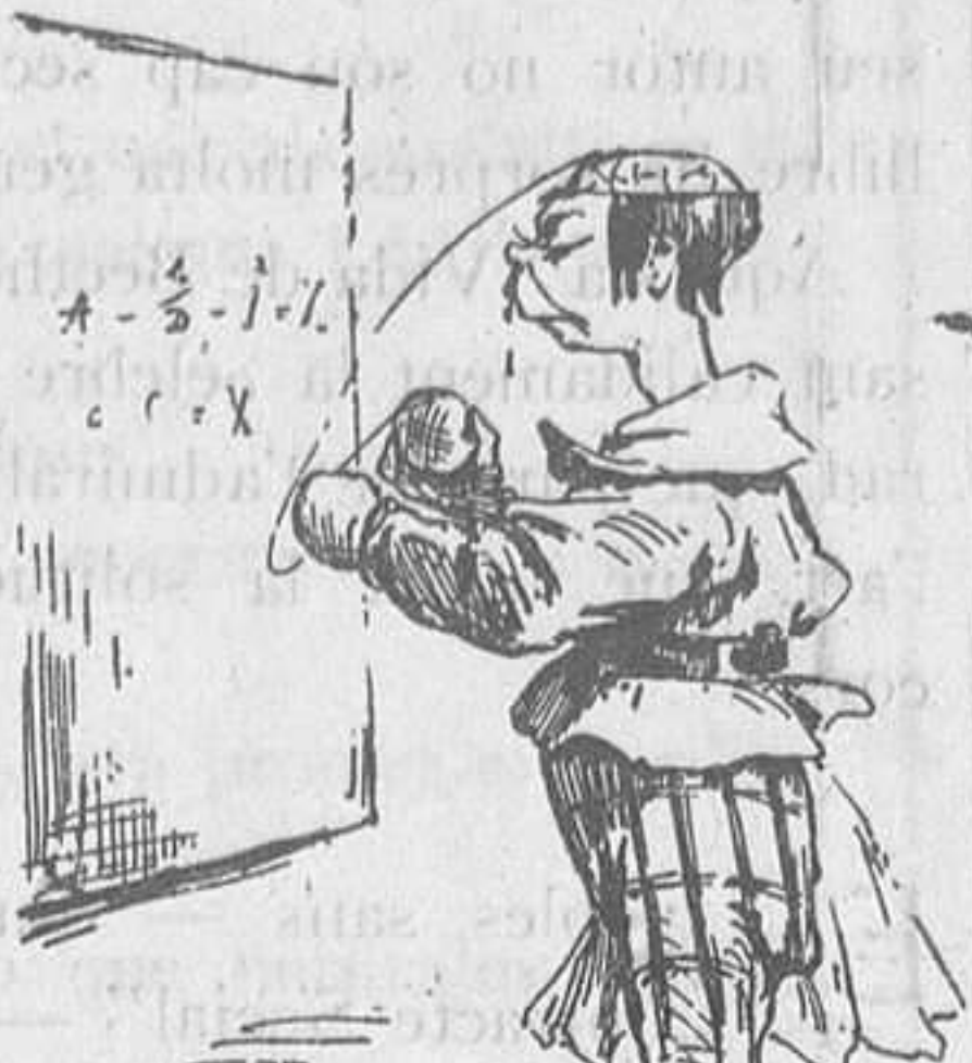
Desfent-se el cervell.