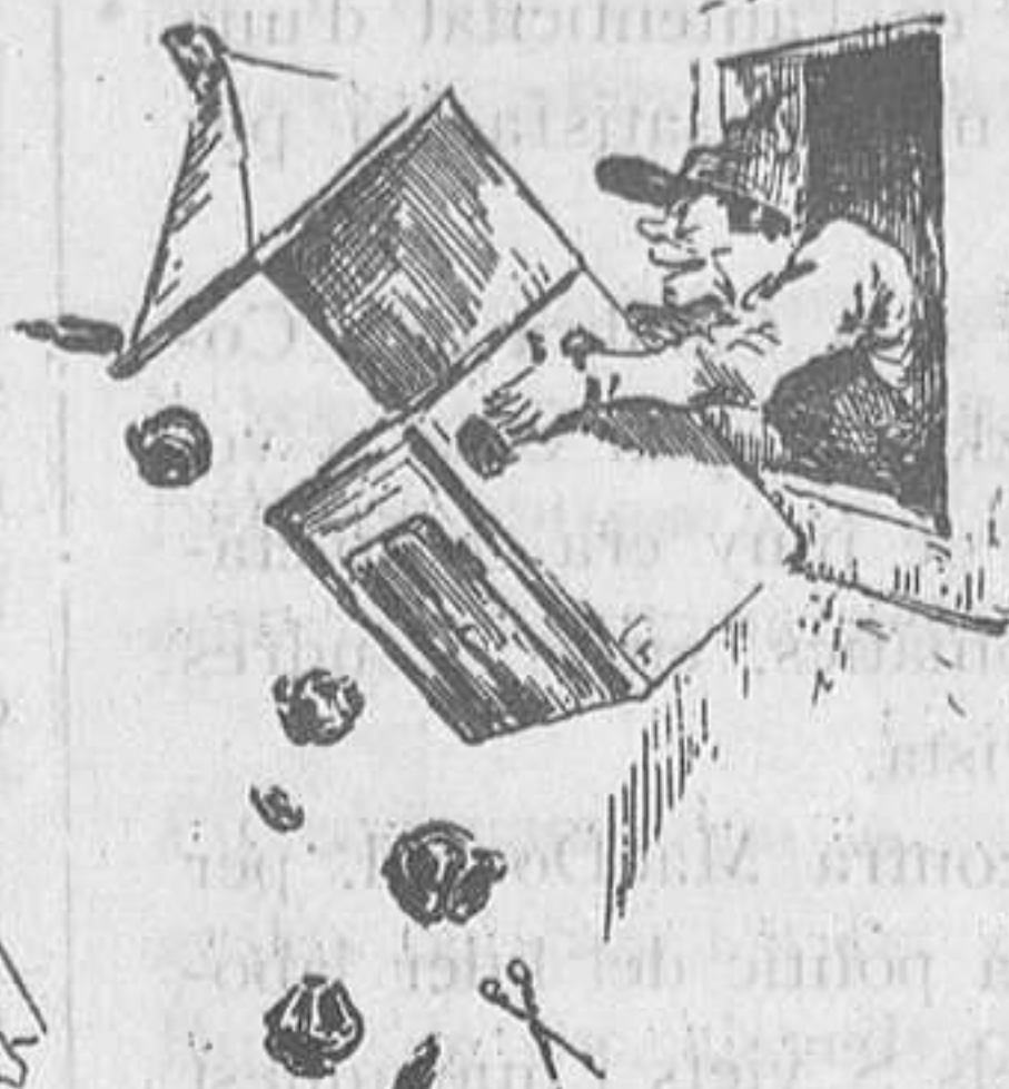
Llençar la casa per la finestra.