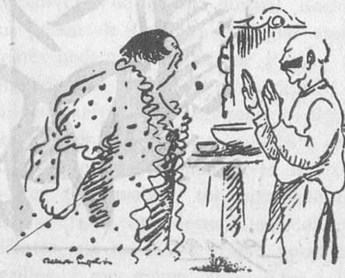
La dona: —Tan sols una paraula més, i sóc la teva vídua.