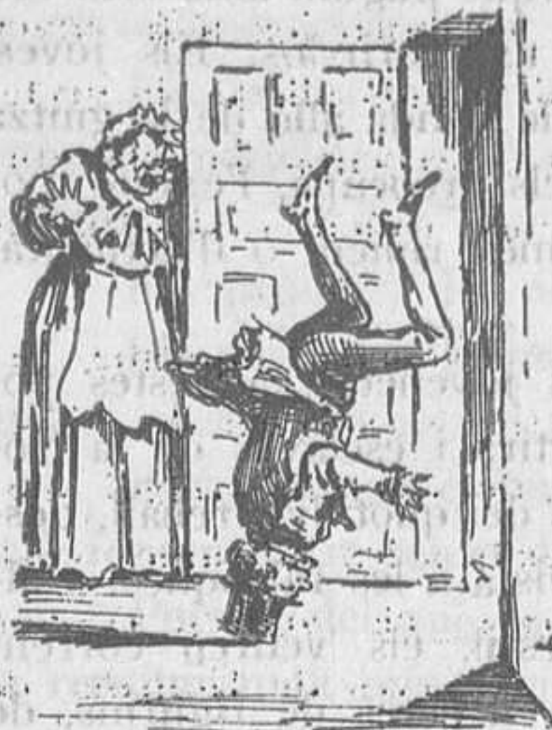
Entrar de cap.