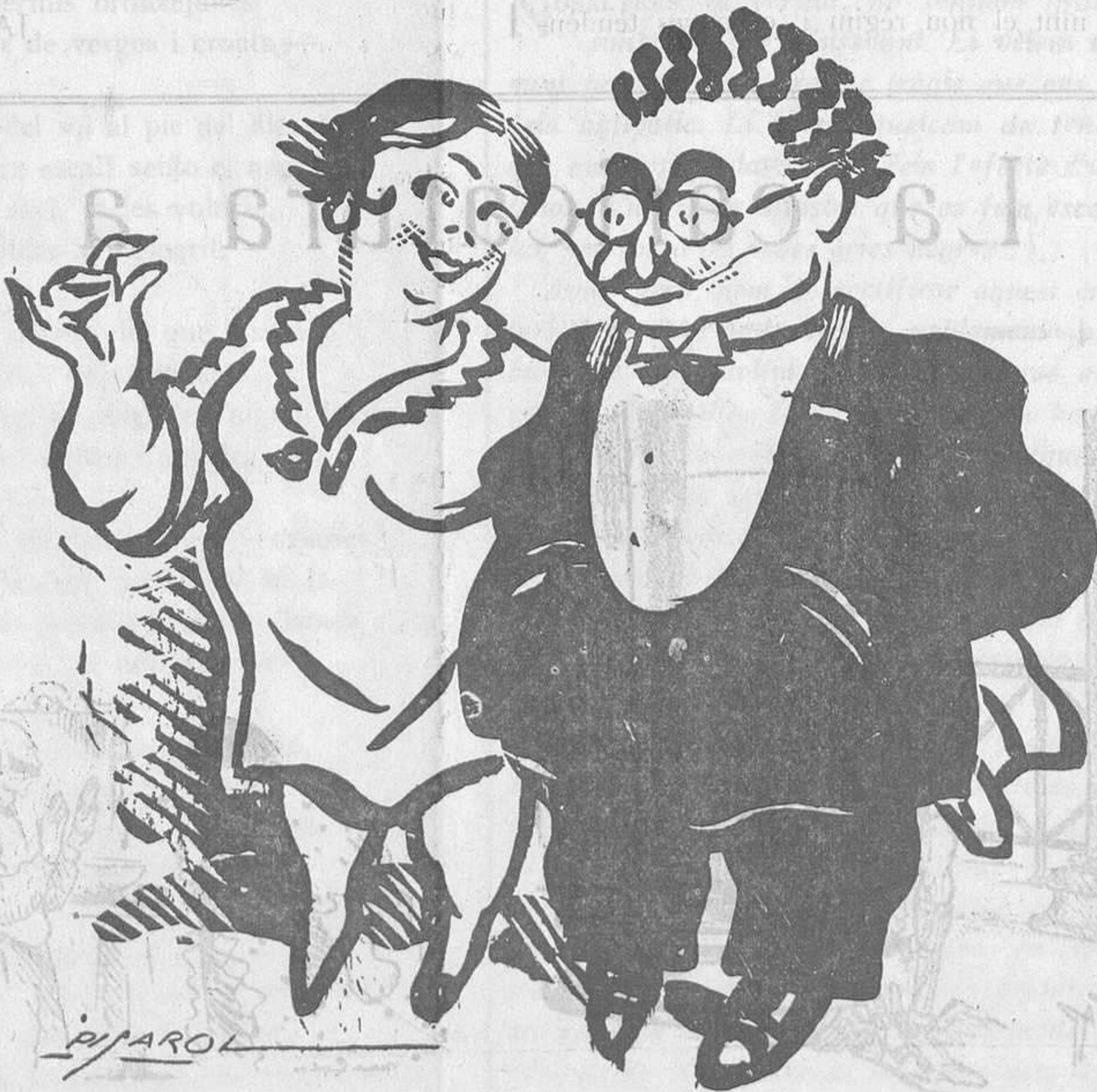
El marit: —Mira si t'estimo, que, si vols, ani-rem en avió a Anglaterra.

Opinions de diaris com aquests no en fem pas cap cas, no ens mereixen cap crèdit.