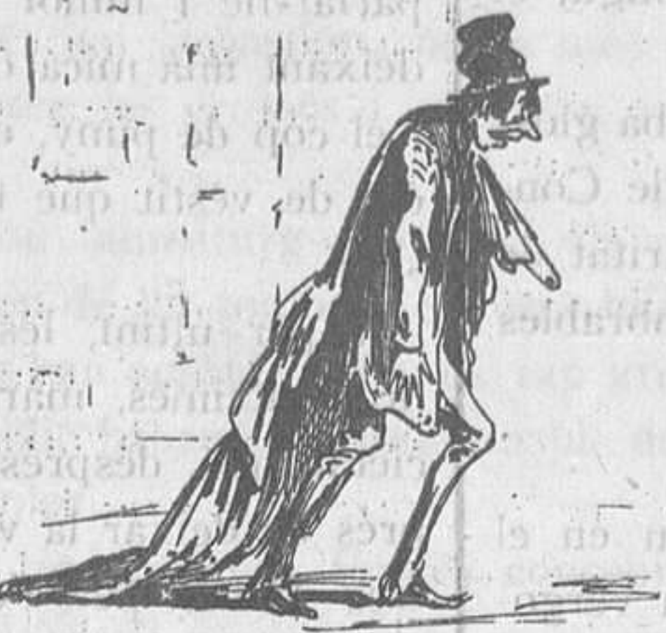
Anar de capa caiguda.