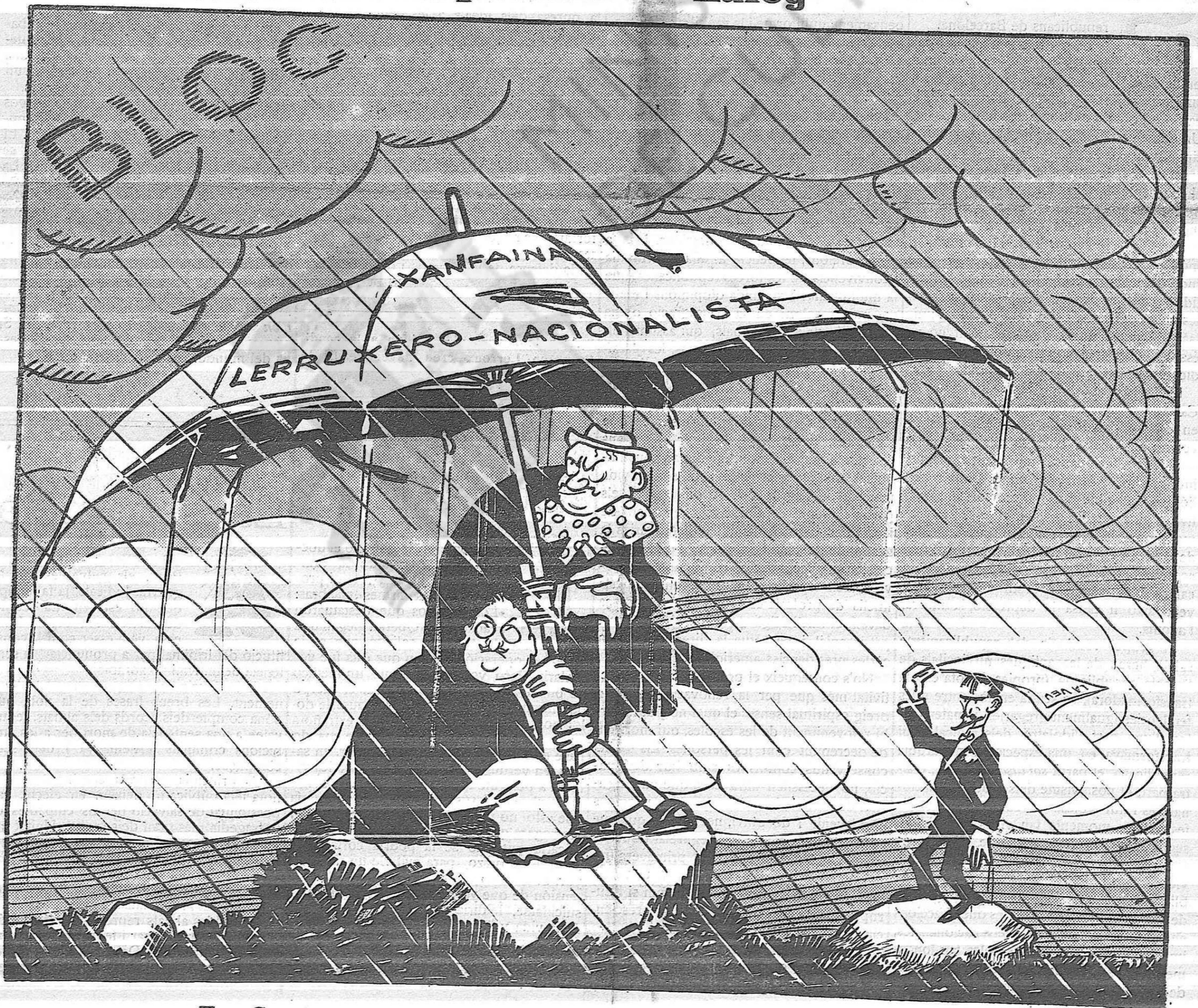
En Cambó, irònic.—Vosaltres rai, qus sou dós i porteu paraigua!