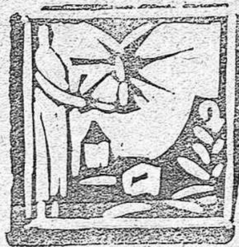
Tip. «La Económica». — Gerona