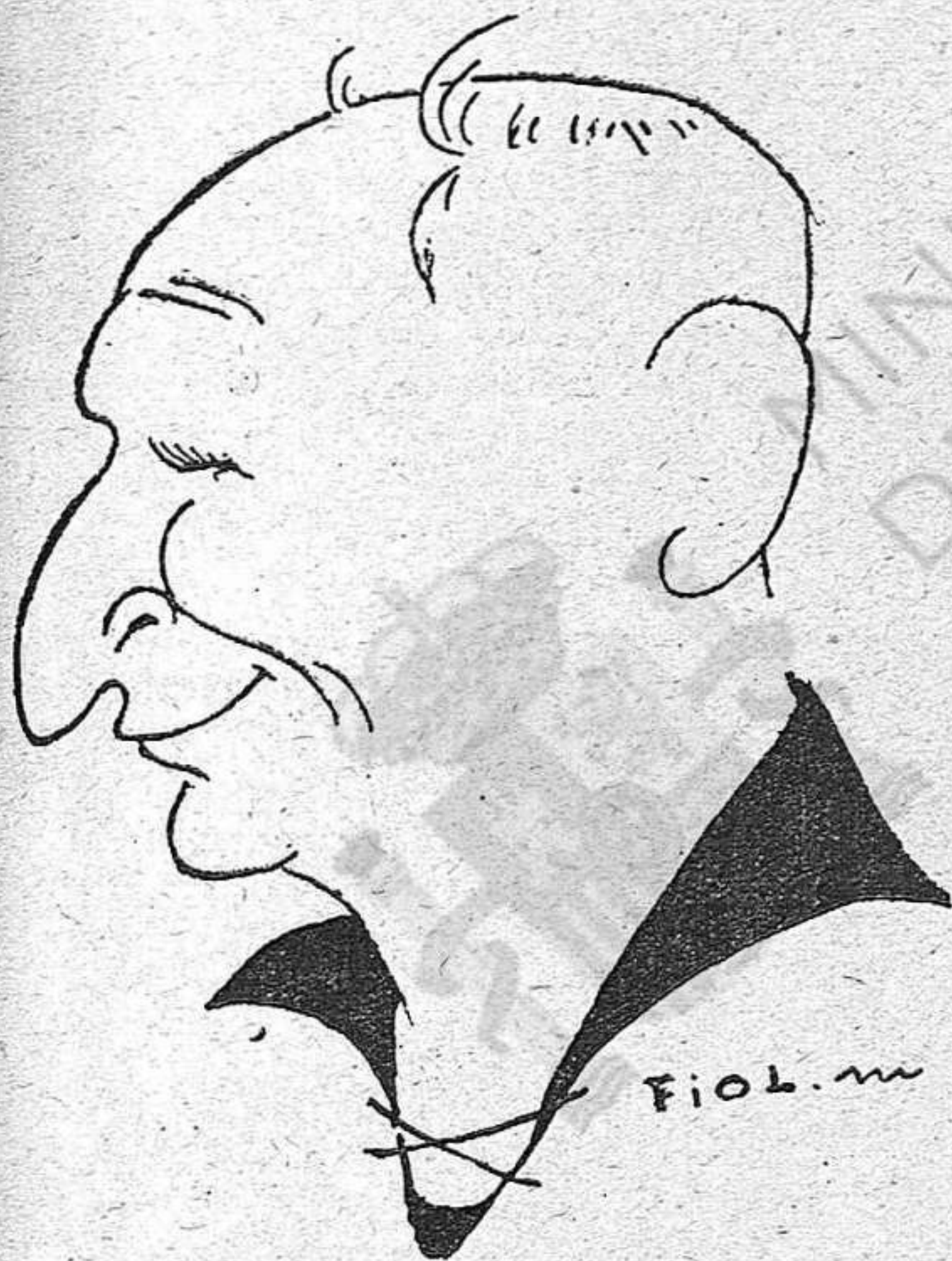
En Setcentes. (L'Avi)

Els millors dels de casa foren en Fàbregues i en Poch, especialment