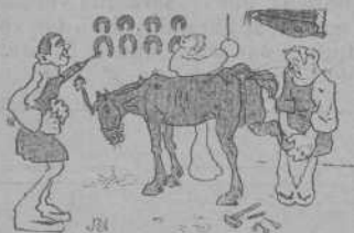
A cal manescal —Digui á n' aquest caball que fassi 'l favor de posarse com una persona.