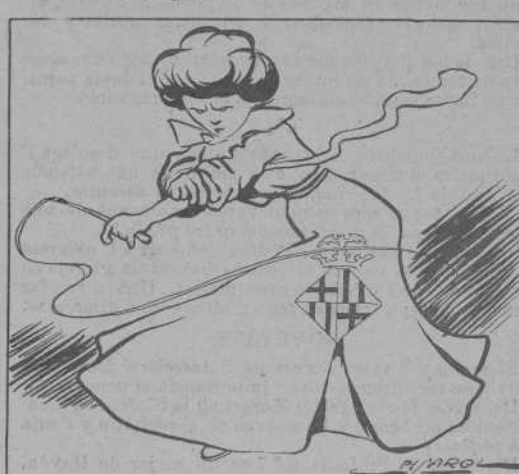
Afortunadament la Pubilla, acabada la paciencia, comensa ya á agafar las xurriacas... y "lo que fuere, sonará".