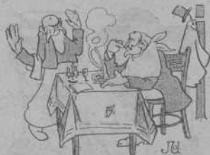
Al restaurant —¿Mala olor aquest peix?... ¡Si encare no té vuyt dias!