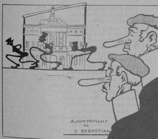
A pesar de lo qual, els regidors de San Sebastián han vingut ¡horror! á estudiar l' "administració" municipal barcelonina...