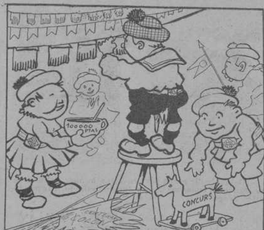
Quan se cansen del tranvia, se posan á arreglar la sortija del seu carrer.