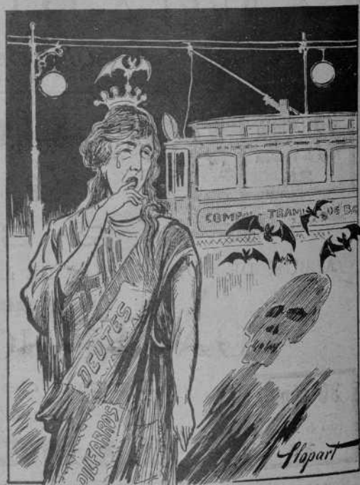
Que acabi aixó com acabi, ella sempre anirà á peu.