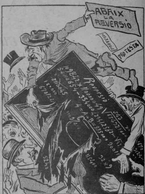
Altres ayrats la combaten ab discursos y ab escrits.