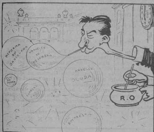
En Bielet vinga ferse ilusions.