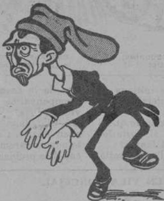
Per tota diversió, tangos.