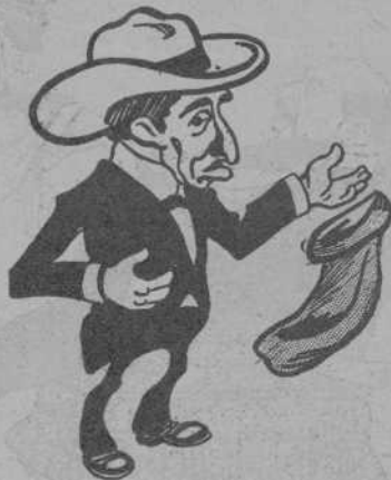
Y ¡¡pijapa que te orió!