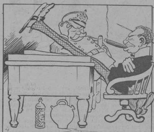
Dels empleats, ni cal parlarne. ¡Actius y laboriosos com sempre!