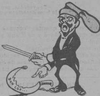
Per tot' eyna, matxete.