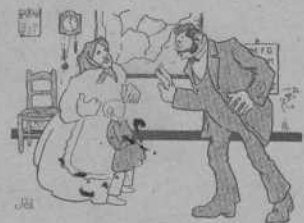
A cal mestre —¿Lletra, números y modos per una peseta?... No pot ser.