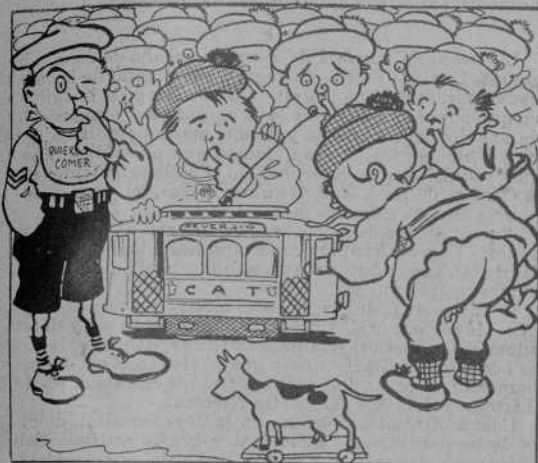
Els nens jugan ab el tranvia.