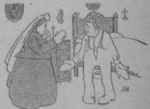
A casa —¡Al fin solos!...

¿Quántas, Sr. Eminentíssim? Vaja, sigui rumbós y dongni l' éxit per descontent.