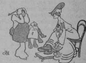
A cal sabater —Esperis; aniré á buscar la mitja cana.