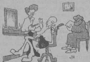
A cal barber —¿Qué será? ¿A feytar ó tallar cabells?