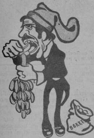
Per tota menja, plátanos.