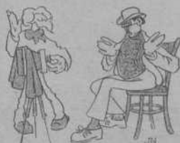
A cal retratista —Procuri favorirme ¿eh?