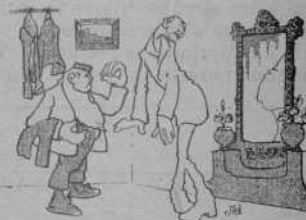
A cal sastró —¿Cóm me van aquests darrerás?