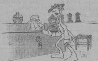
A cal apotecari —Cinch céntims... de qualsevol cosa.