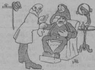
A cal metje —¿Set centas pulsacions?... ¿Vols t'hi jugar que se m' ha parat el rellotje?