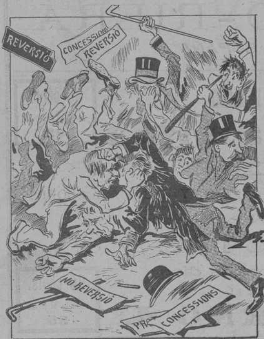
Davant de tan gran embrollo, la pobra ciutat ¿qué creu?