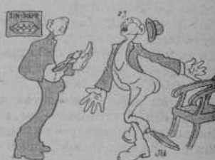
A cal dentista —No cridi aixís, que 'ls que s' esperan se creuran que li he fet mal.