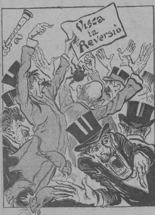
Uns volen la reversió y la defensen á crits.