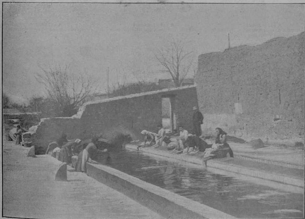
Safrelg públich á Torroella de Montgri.