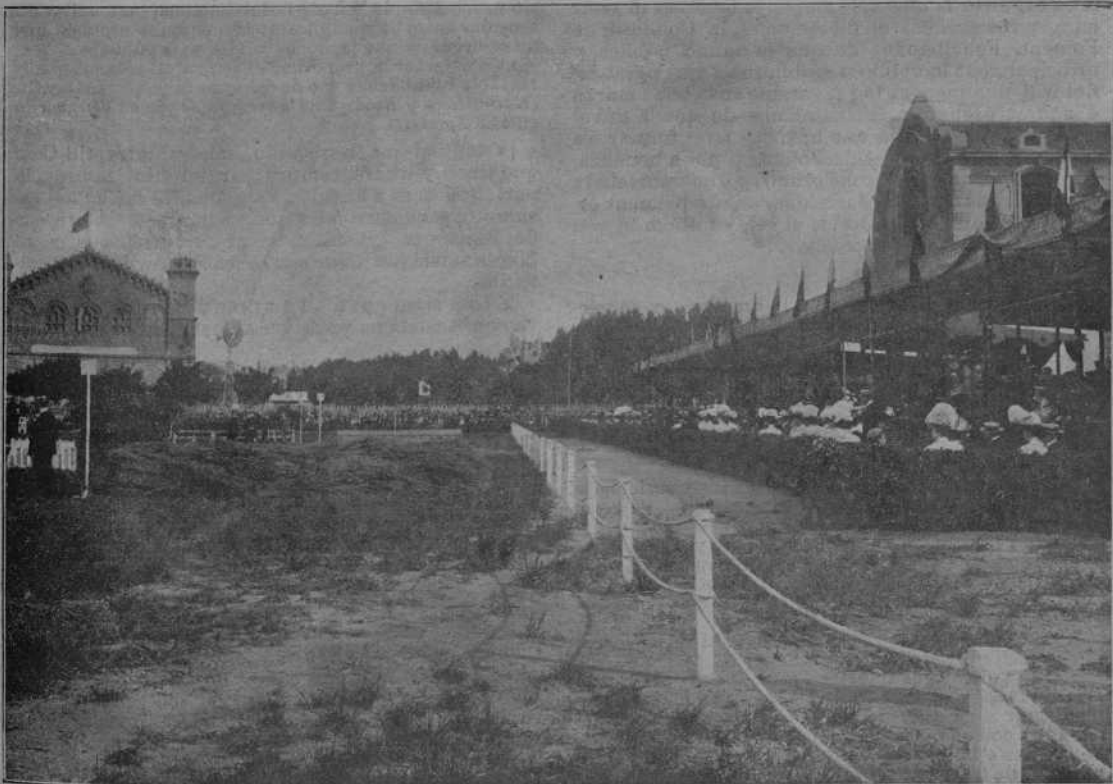
A la plassa gran del Parch. PRIMER DIA DEL CONCURS HÍPICH.