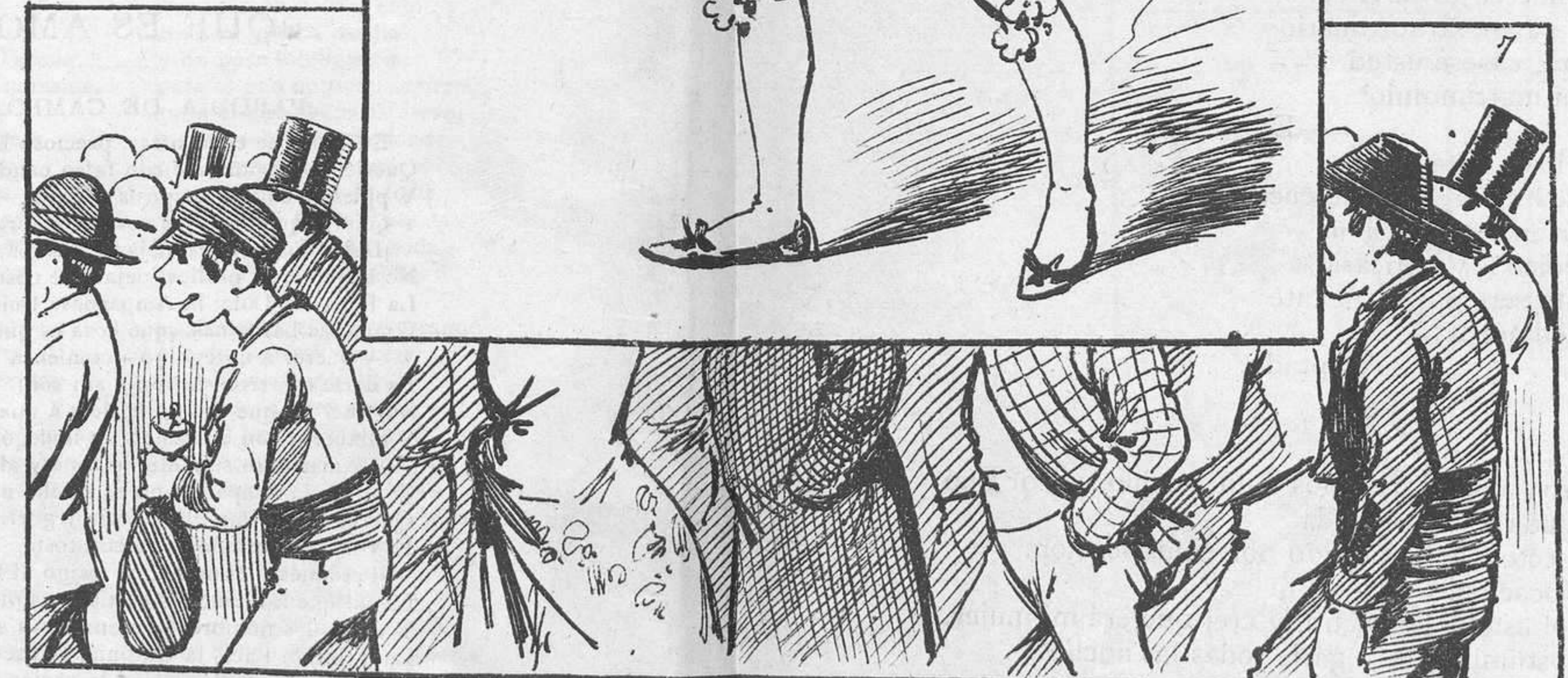
1.—Aquí vamos á los toros, quinientos veinte en cuadrilla; si llegar á volcar el coche, quinientas veinte tortillas.