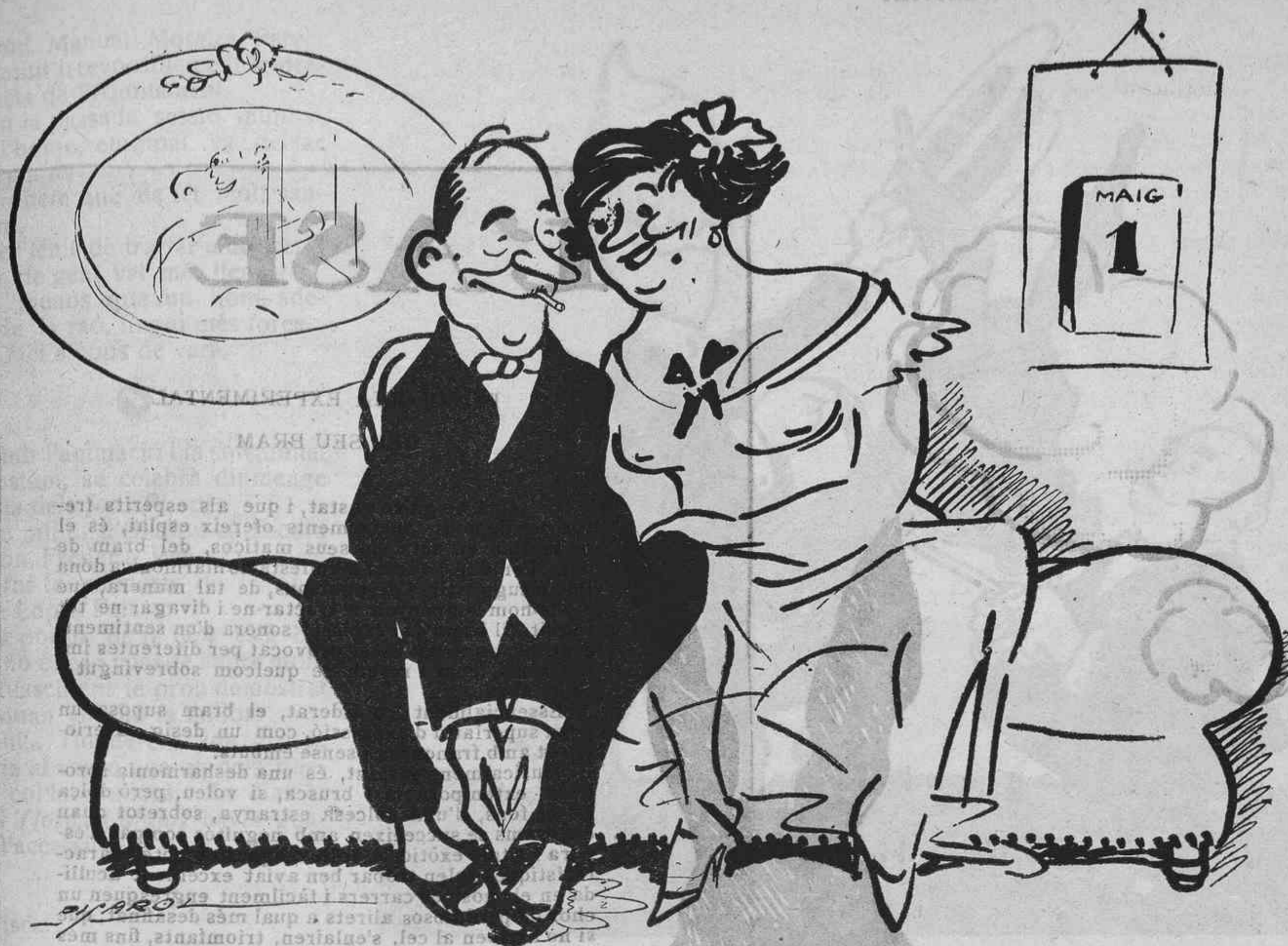
GANDUL DE MENA