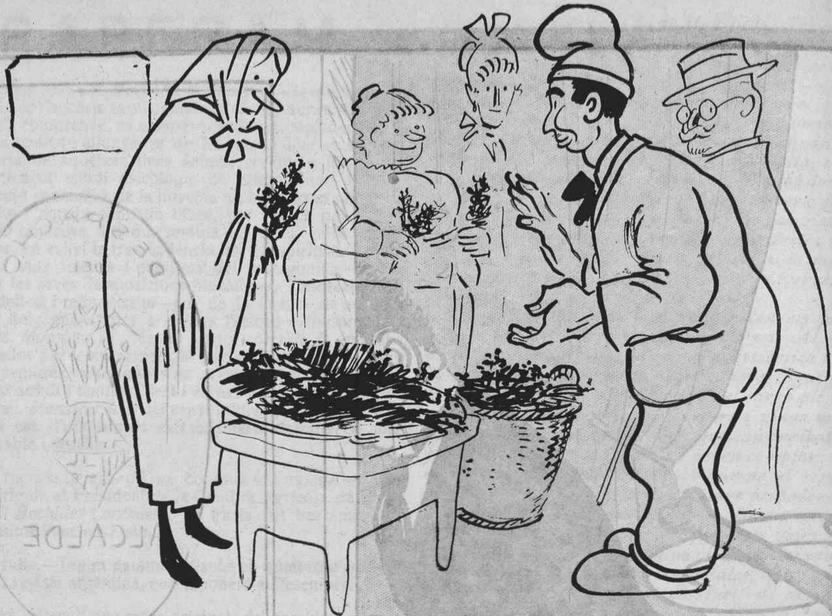
A LA FIRA DE SANT PONS

—Herbetes que ho curen tot! —Si també curen la ràbia, ja me'n podeu donà un brot..