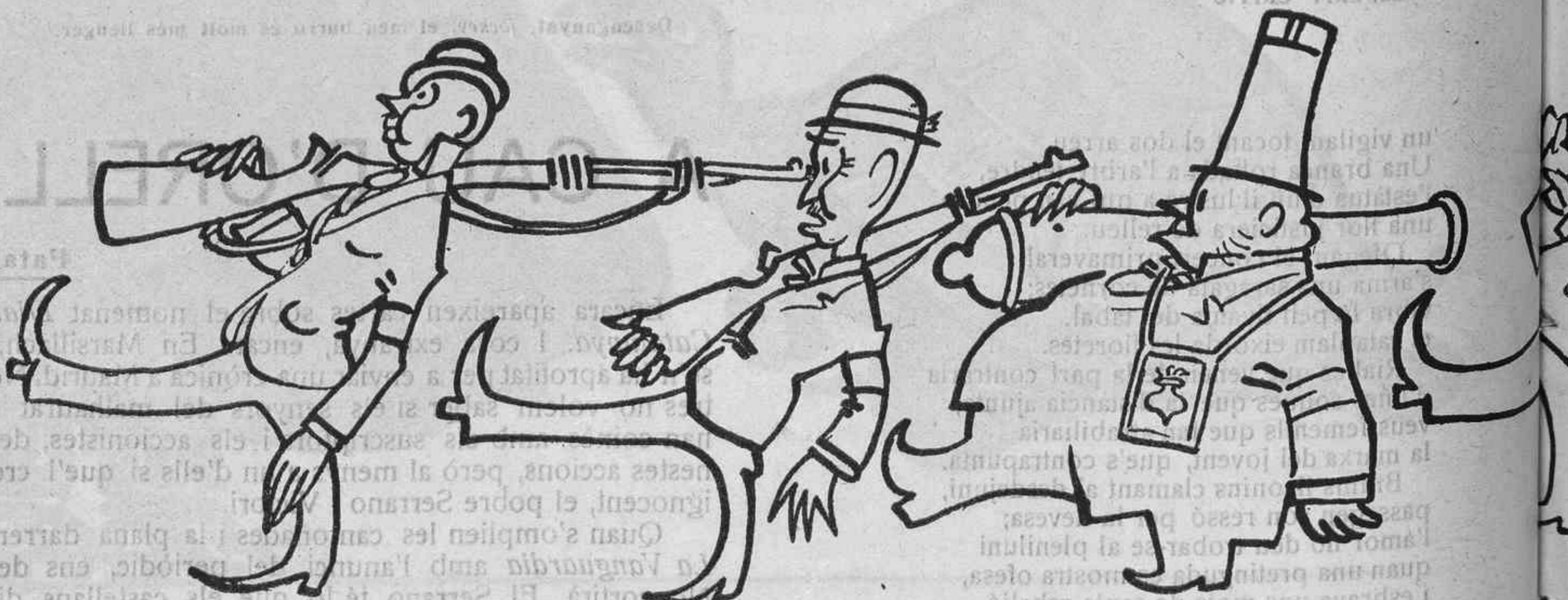
LA COLLA DELS DESENFINATS