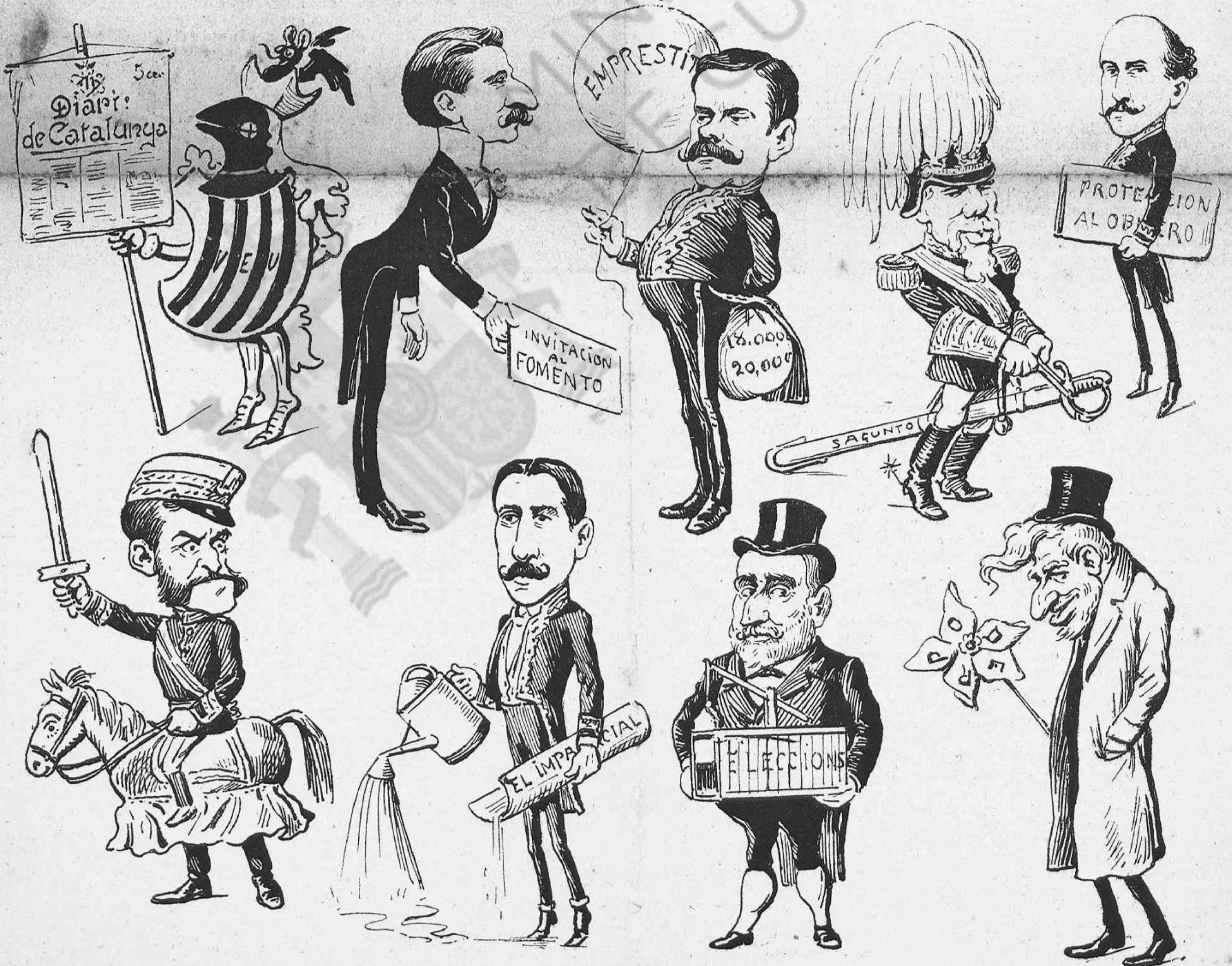
Colla de tipos farsants que fa tot l' any els gegants.