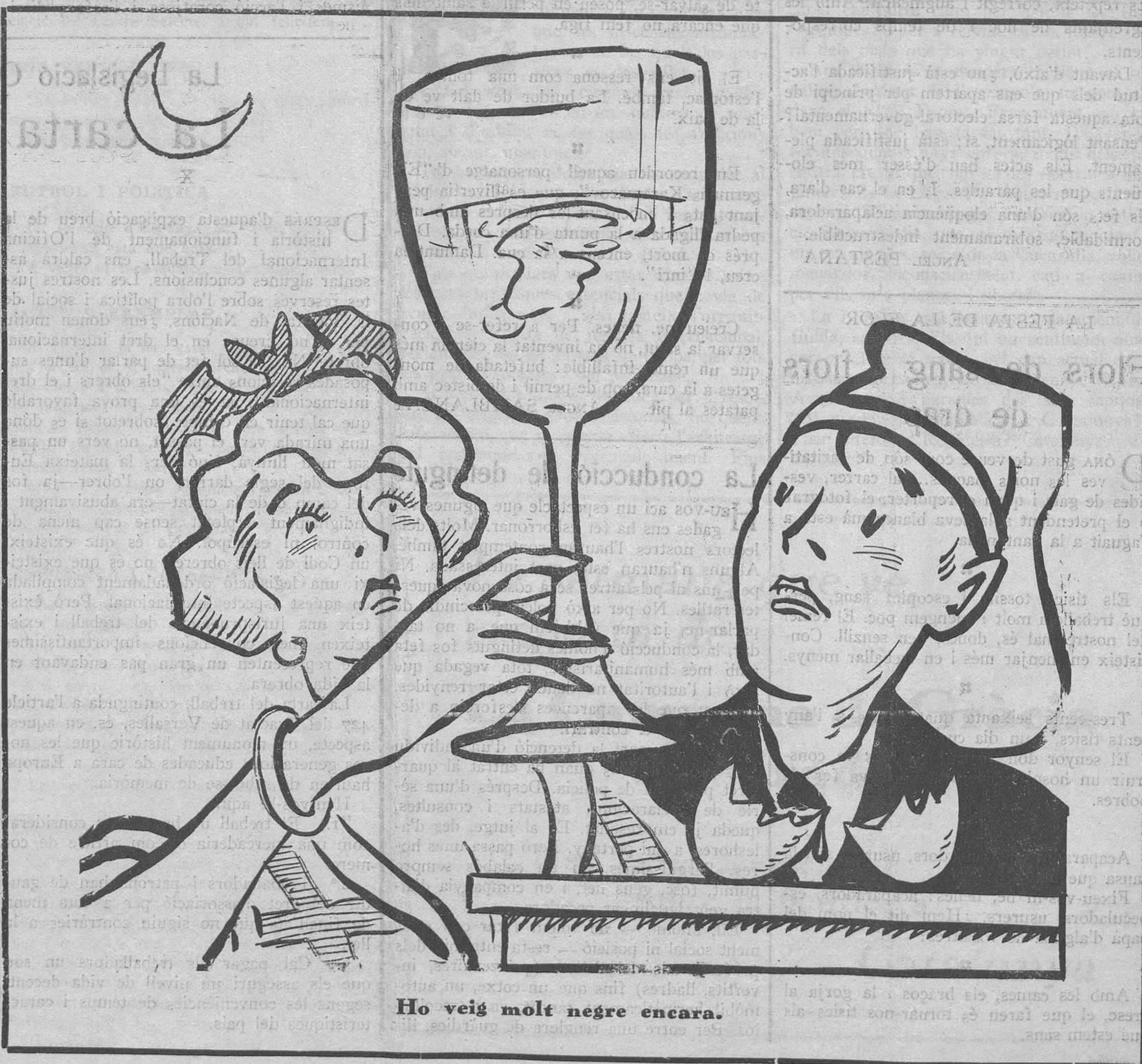
Ho veig molt negre encara.

El governament del país nostre ha estat sempre afer de camarilles allunyades, quan no divorciades, del poble. Altrament, el cop d'Estat hauria trobat aturadors o destorbs. Allò morí sense que una veu tan sols de condolença es fes escoltar. I bé: a què pot ésser atribuïda una tan enorme indiferència? Això ha estat dit moltes vegades. I volem repetir-ho. La negligència observada aleshores, obeïa a què el poble no se sentia solidari ni compenetrat amb els elements que governaven. Aquesta manca d'assistència de l'opinió pública a l'obra del govern, determinà la indiferència observada en la caiguda del règim que ens governava. Les