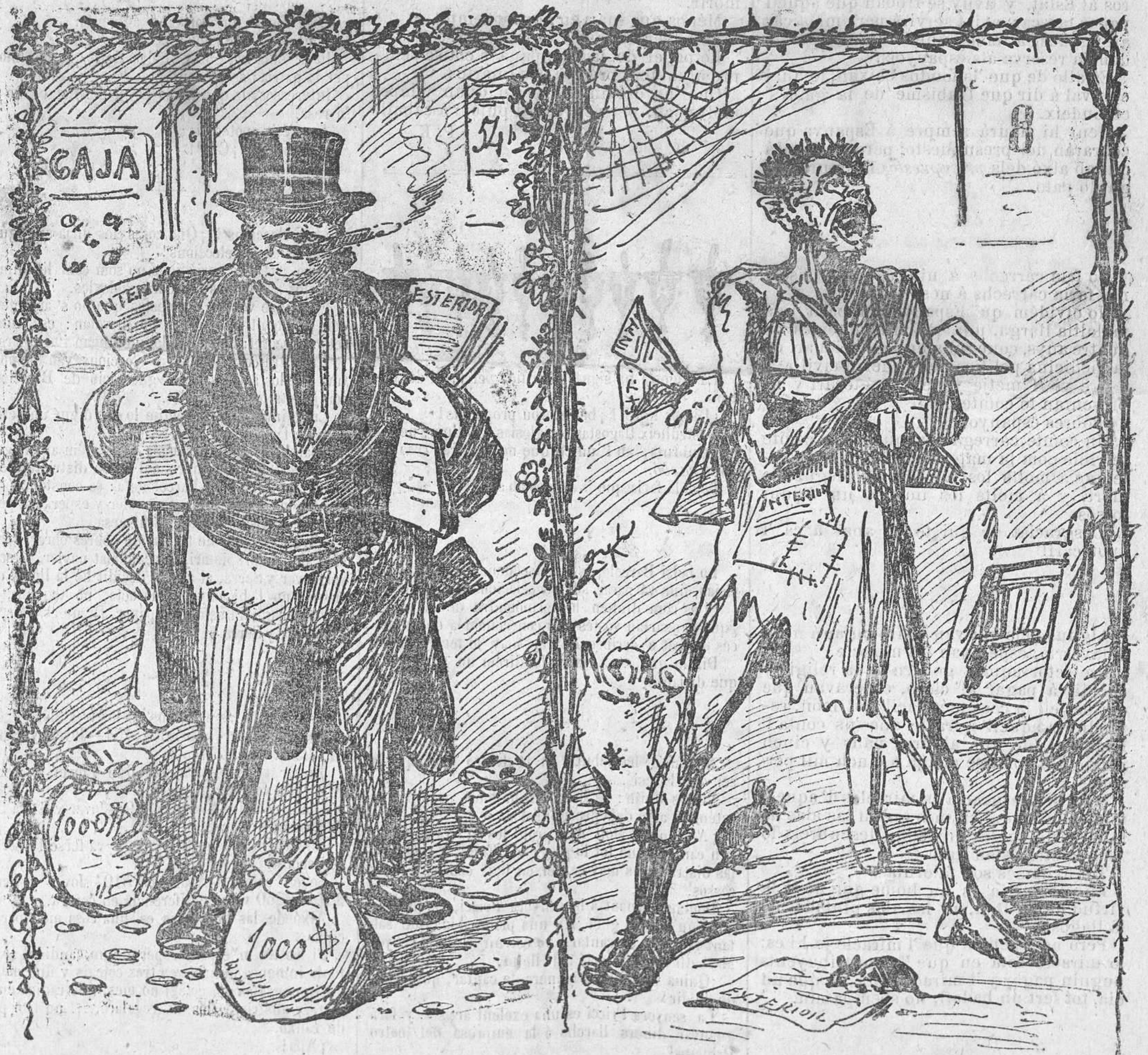
¡Quin paper mes brillant!