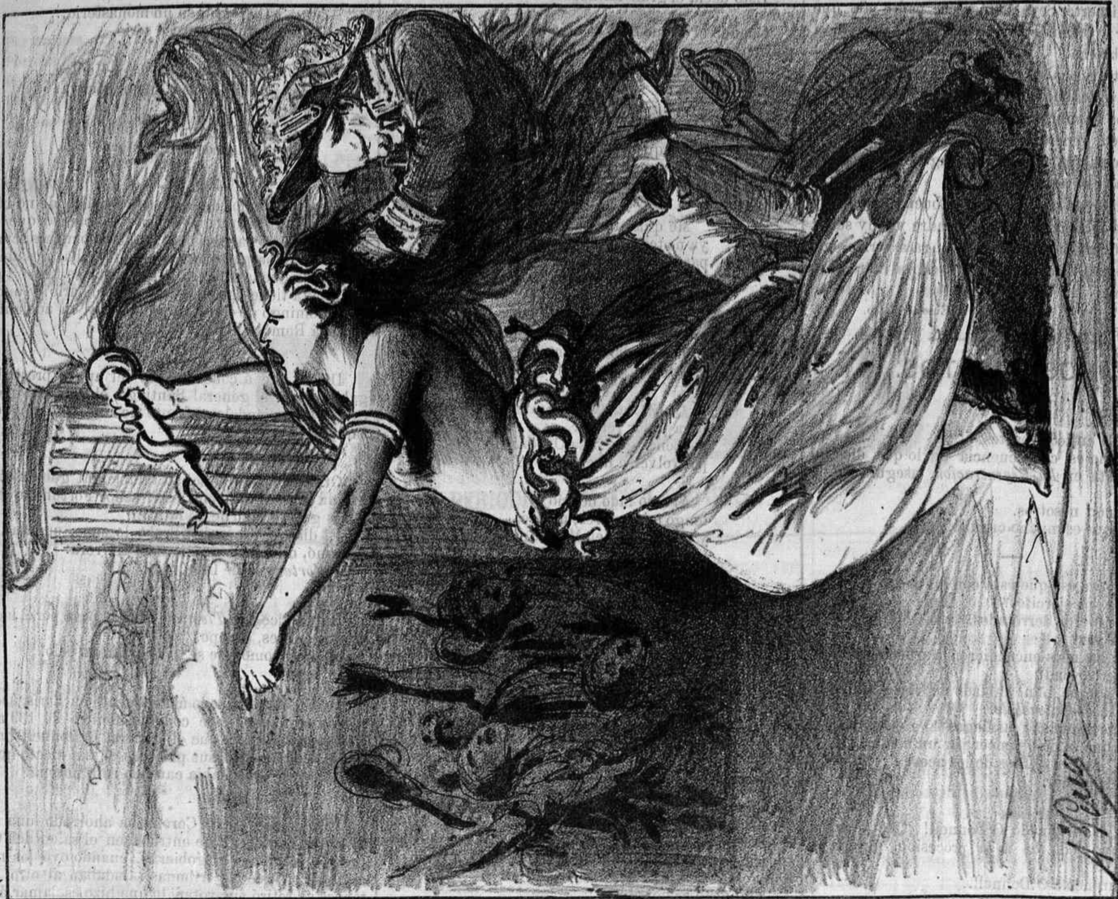
Un abrazo interrumpido.

Por Patrocinio y a Roma... esto me parece drama.