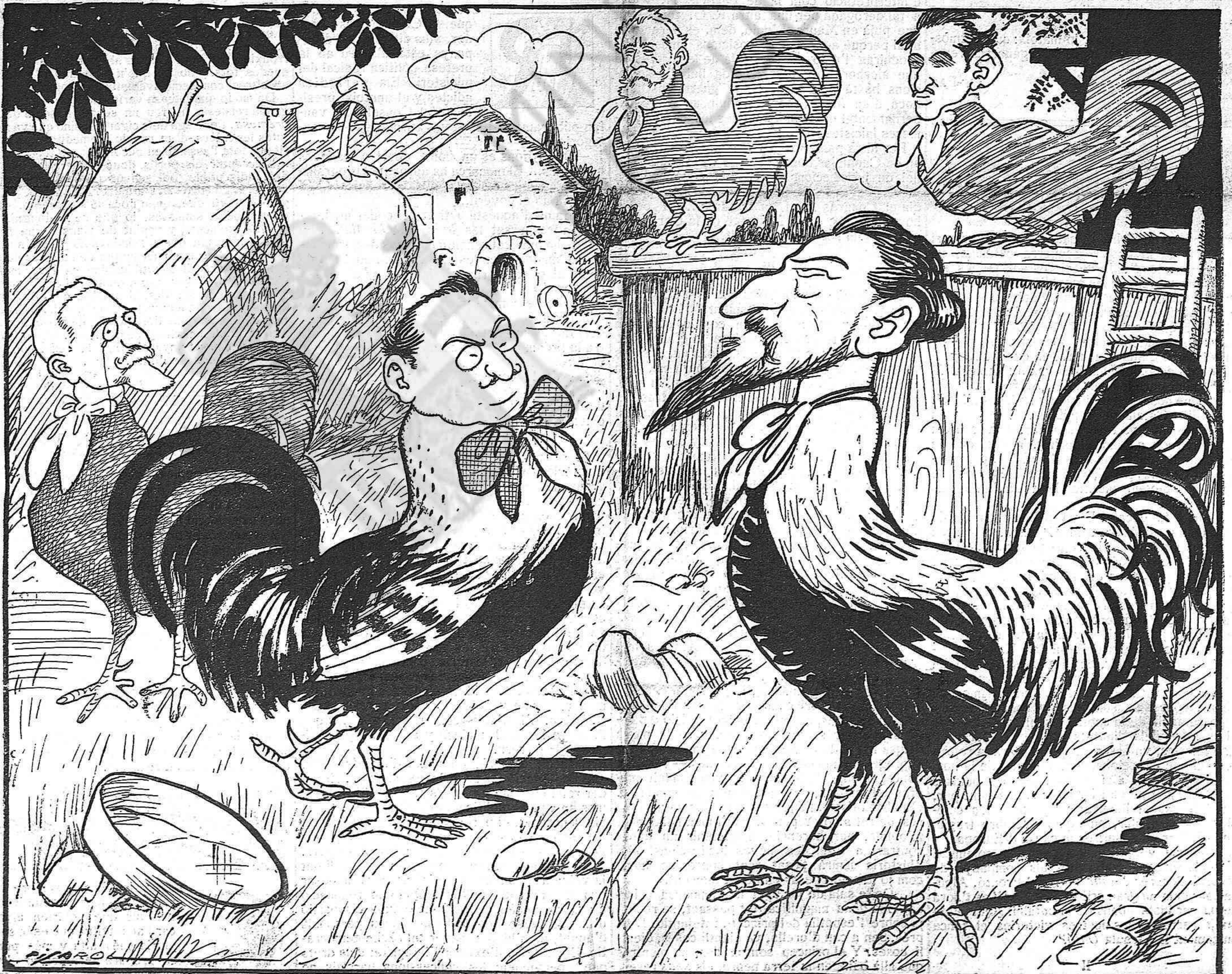
¡Massa galls, massa galls!... No anirem pas be.