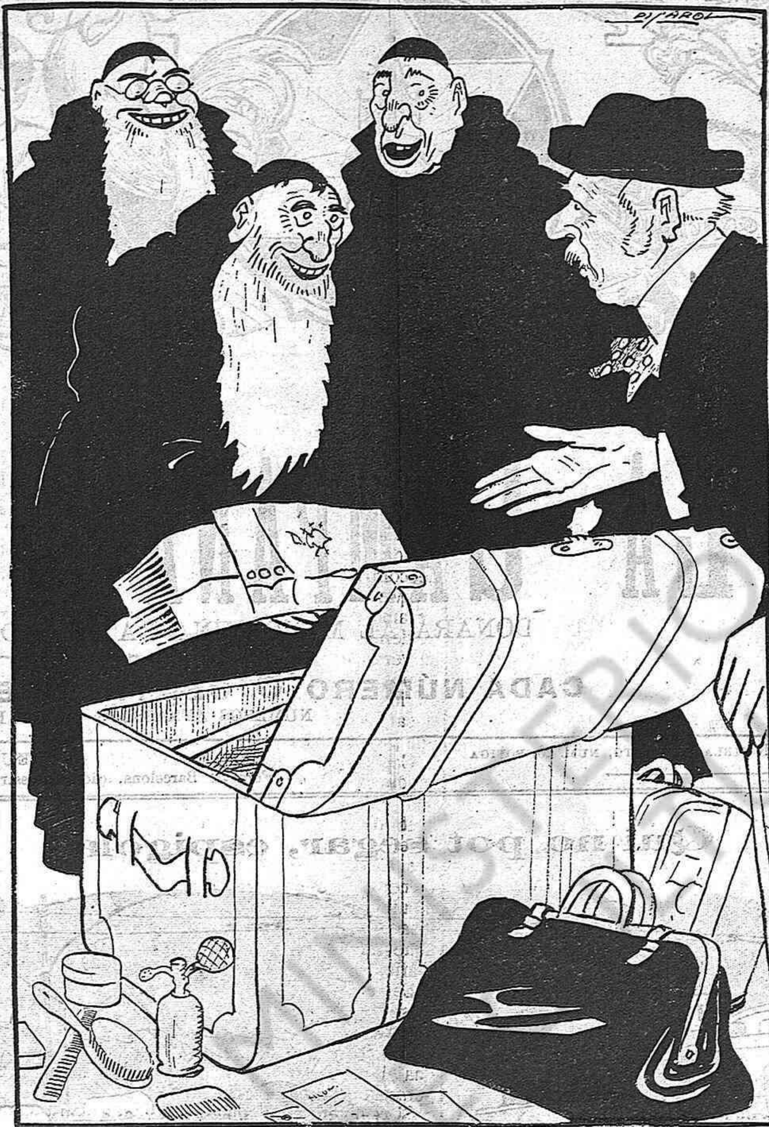
—¡Ah!.. ¿Ja's preparen pera fugir? ELS FRARES: — Cal.. Lo que fem es amanir l'equipatge, per'anar a passar l'estiu a San Sebastián, a la voreta del mar...

punt no s'oviren més que boires y foscors, justificadores de totes les esperances dels partits extrems. ¿Seran les Corts que acaben d'obrirse les que assisteixin a la cerimonia dels funerals d'un règim caduc?