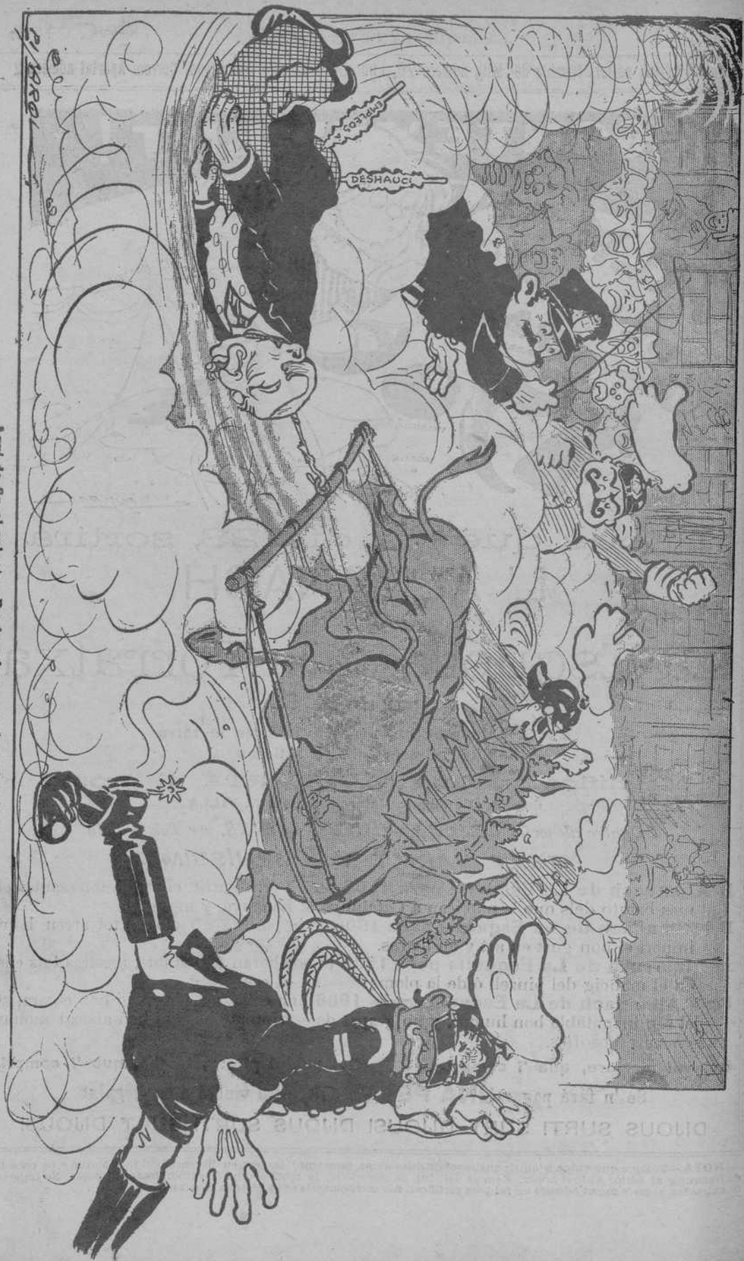
Aquí da fin el salnete. ¡Perdonad sus muchas planchasi!