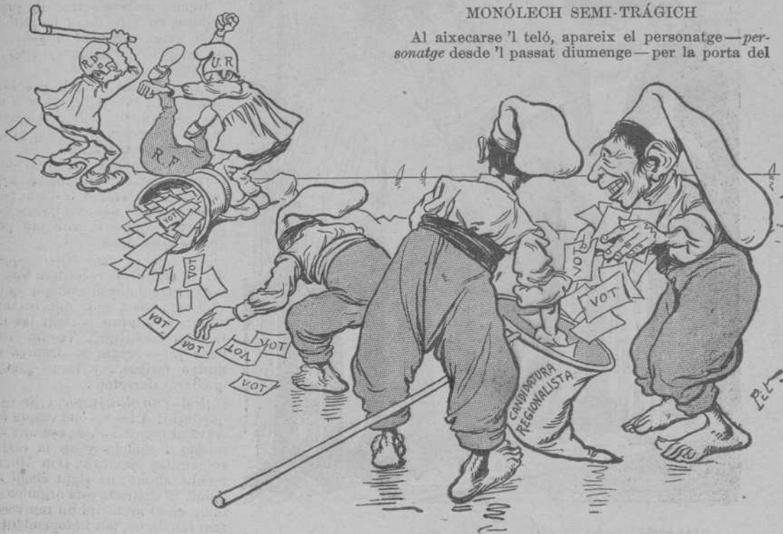
“A riu revolt...”