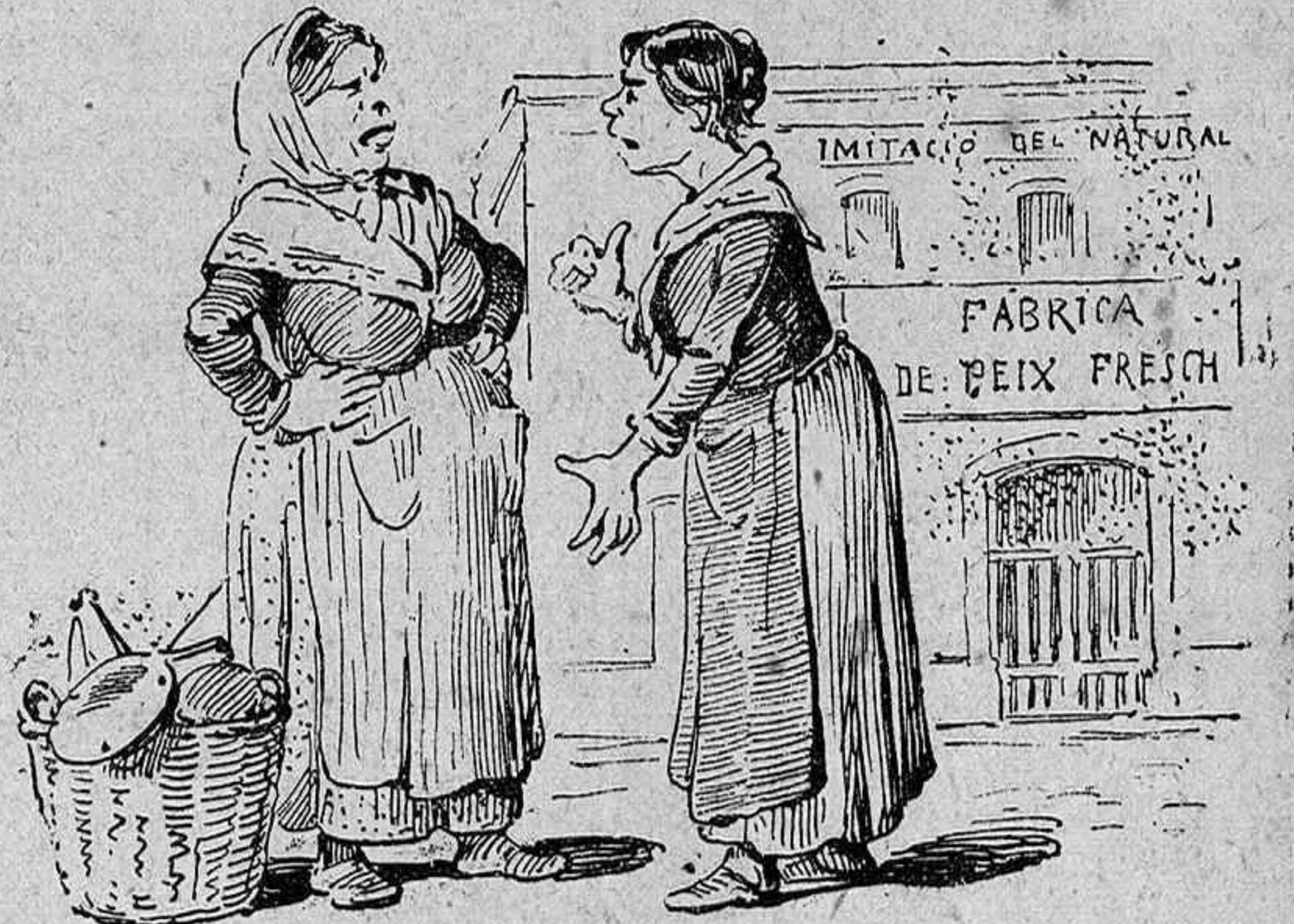
Mira, Pasquala, que n' hi ha un tip de aquest arcalde. ¡Privarnos de vendre peix pèl carrer, quan tot surt de la mateixa fràbrica!