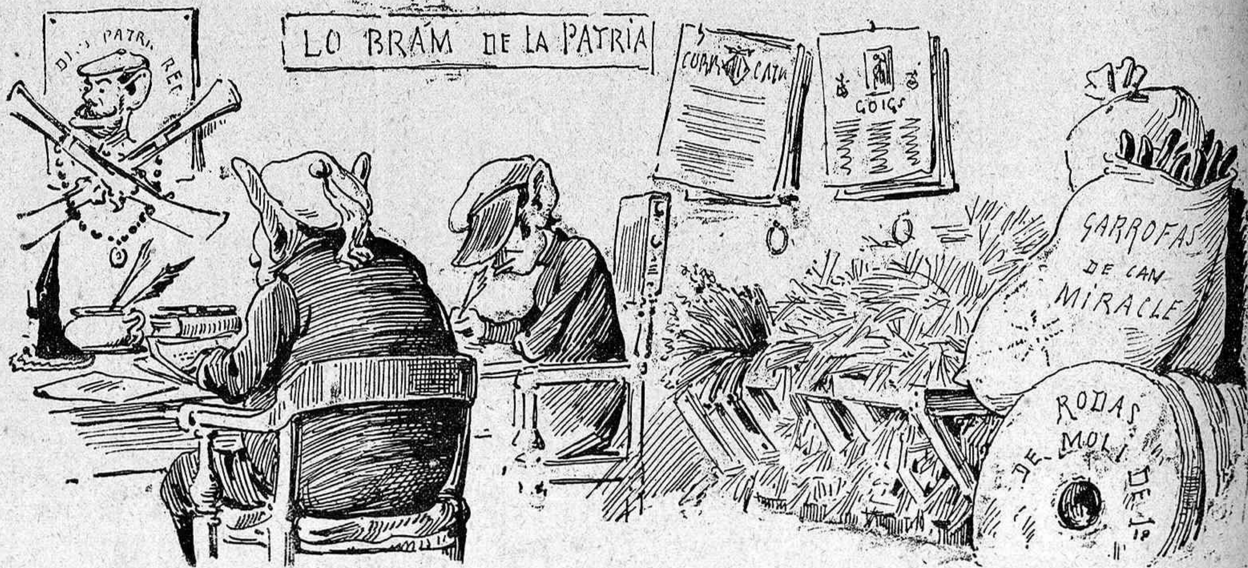
La redacció del Bram de la patria .