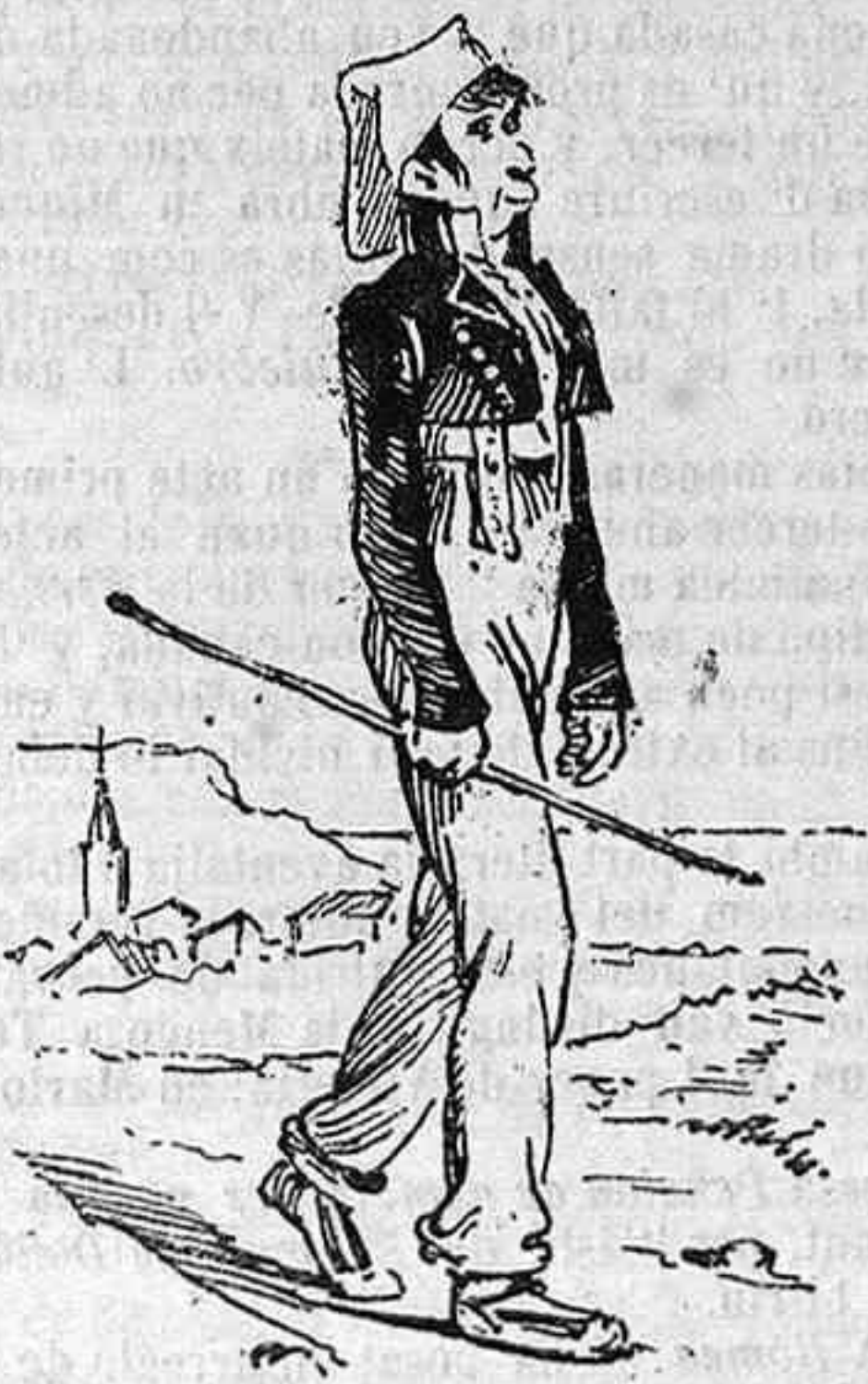
Vejin si d' un home que fa aquesta fatxa se 'n pot esperar gran cosa.

L' amor es un camállich terrible: ¡si 'n tè de forsa! Converteix al sabi en tonto, al tonto en sabi, al valent en cobart, al avaro en pródich. A n' en Climent va convertirlo en això: