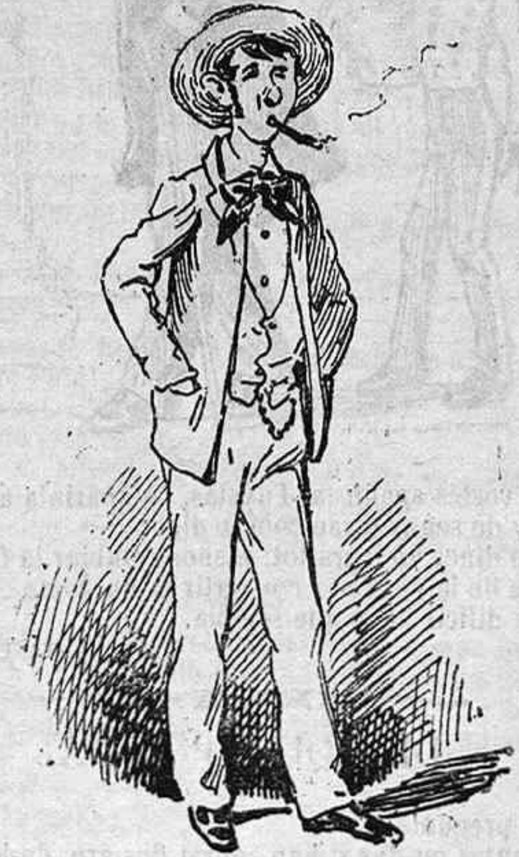
Un pollo de punta, sense fallarli res.