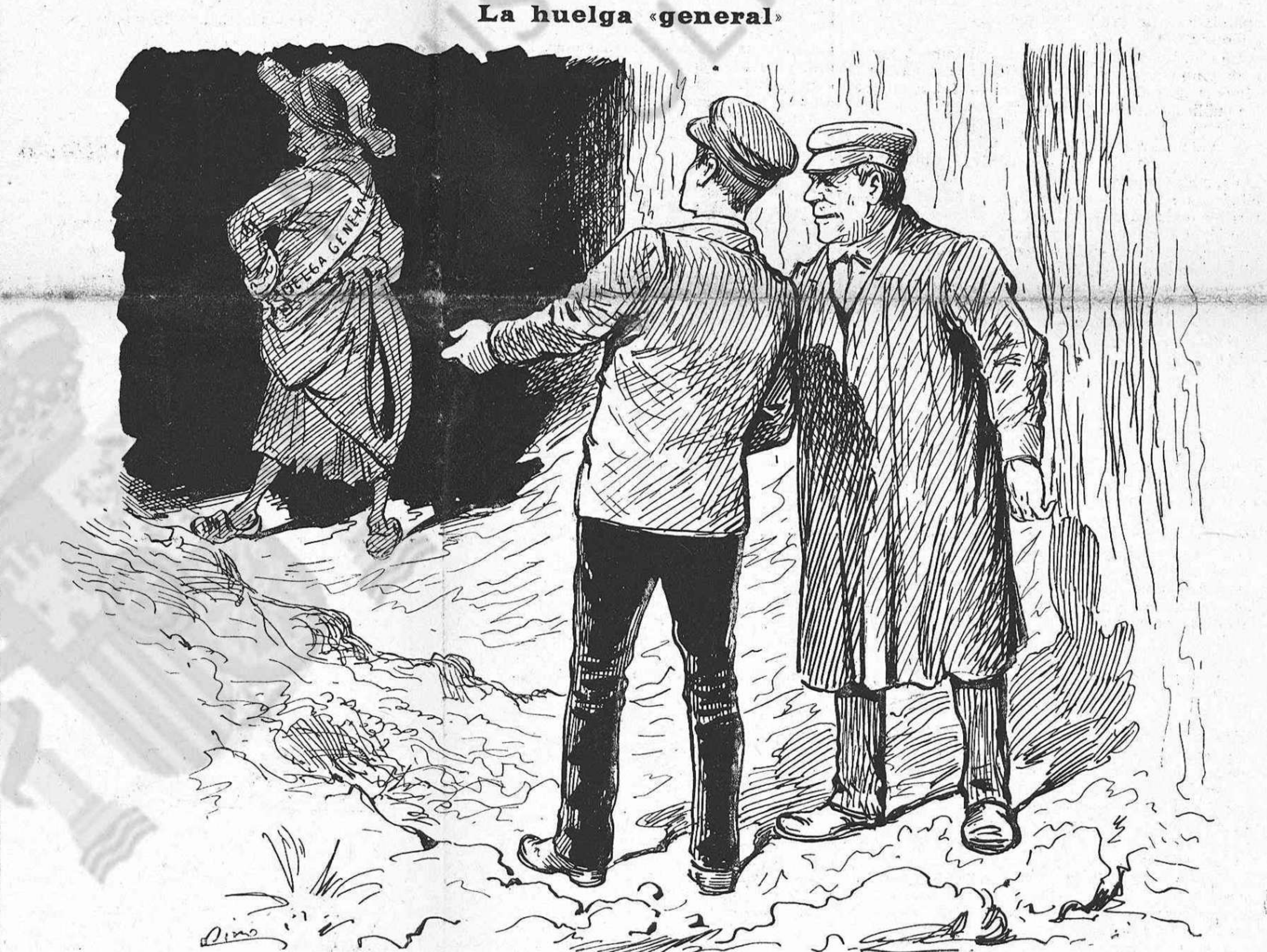
—Vet'aquí 'l únich general que a nosaltres ens inspira confiança. Un general que no cobra y fa 'l seu fet no mes creuantse de brassos.

Aquest procedir de fraternal solidaritat resulta en nostre concepte mes práctic que 'l afany de tirarho