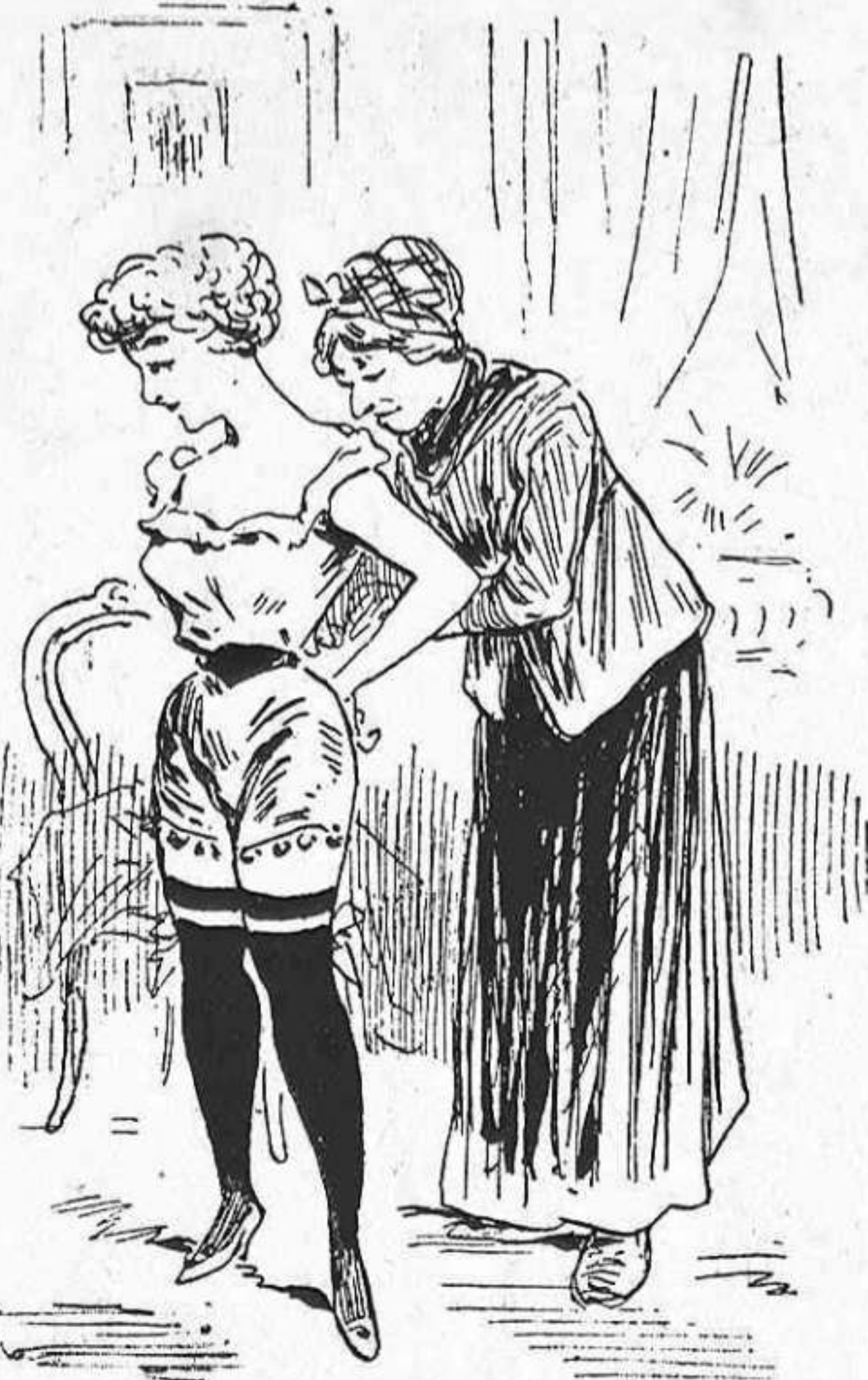
-No olvidis lo que ha dit el ministre: «Es precs que el capital treballi y que 'l treball possegeixi.» Si ta mare hagués sapigut aixó, d' altra manera 'm lluhiria 'l pél.