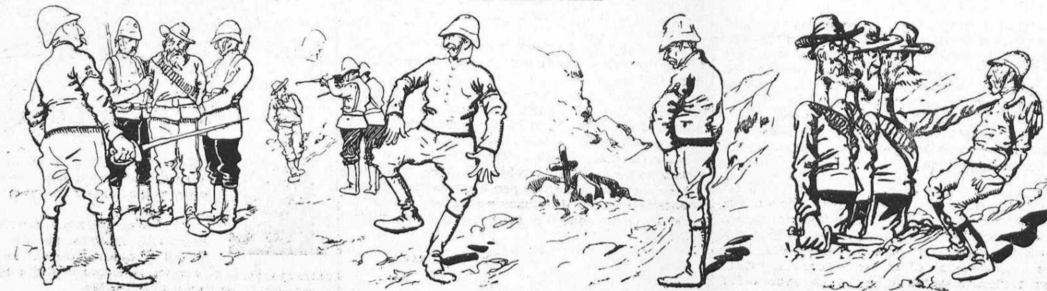
—¿Aquest es l' últim boer? ¿L' últim?... Que 'l fusellin.