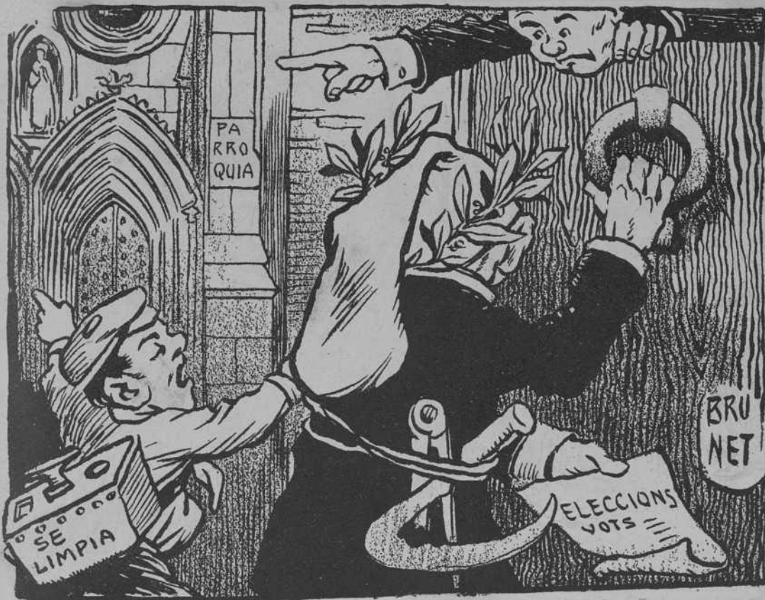
—Aquí, no: es á l' altra porta, germanet.