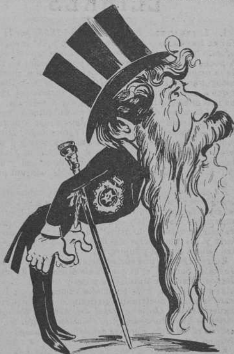
L' arribada del un.