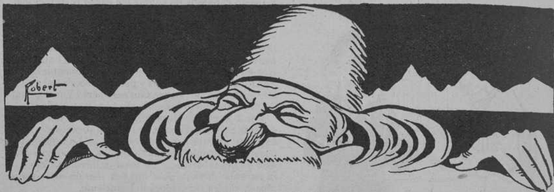
El fret comença a treure 'l nas.