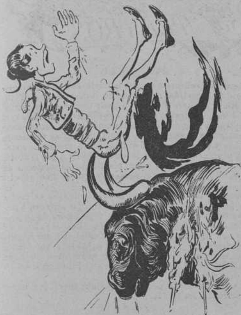
La cogida del Fuentes.