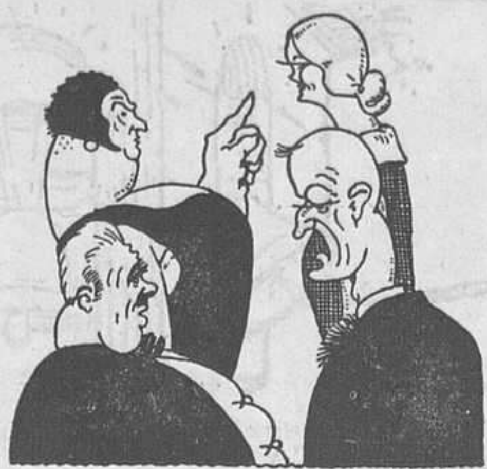
El futur sogre: —I amb què compta, vostè? El pretendent: —Com que el mataré aviat a disgustos, amb la seva fortuna.