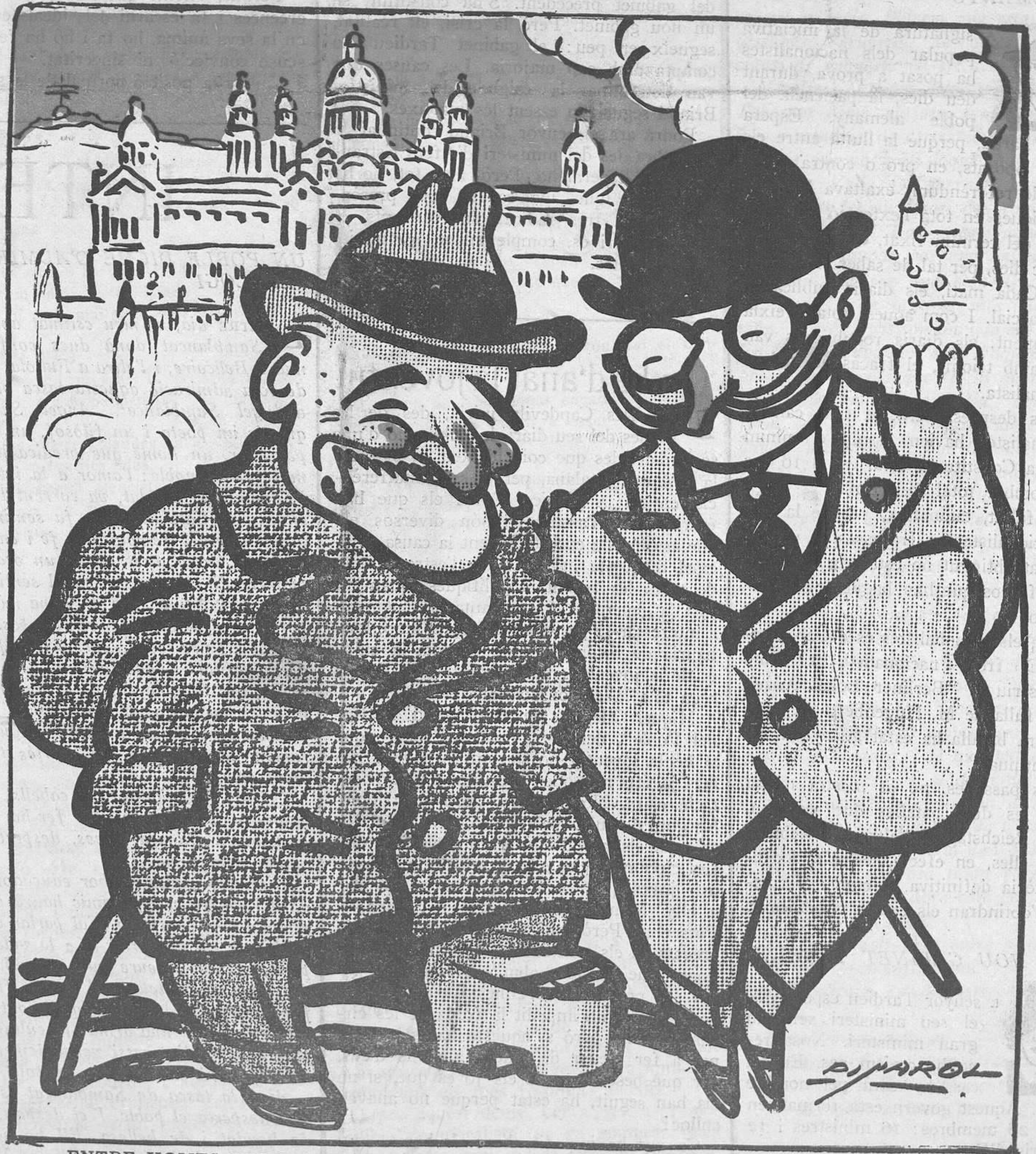
ENTRE HOMES POPULARS