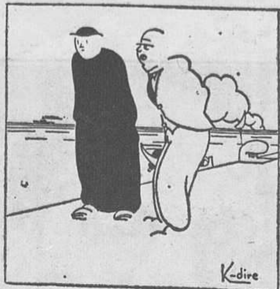
El metge: —Hi ha massa salut, en aquest poble; hauré de marxar.