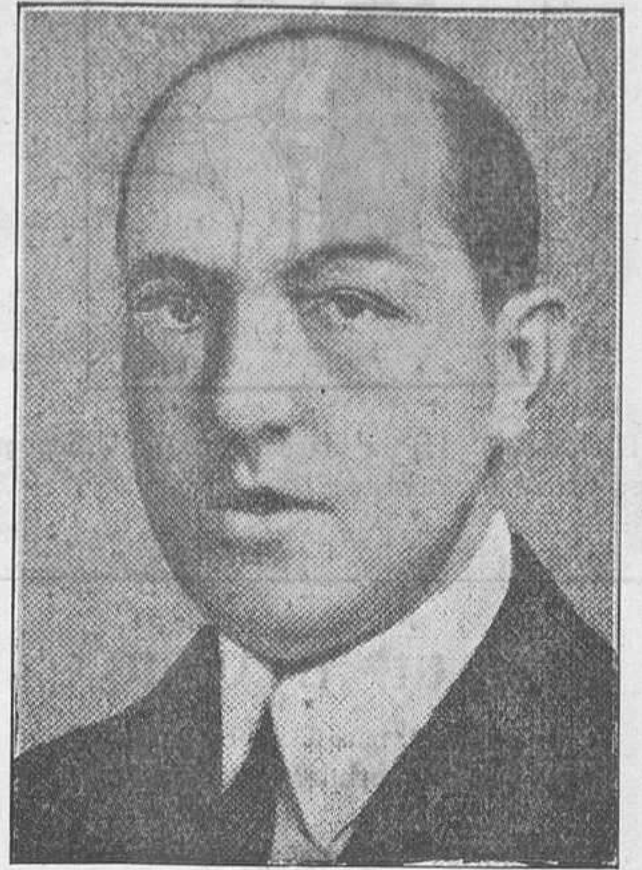
VALLS I TABERNER