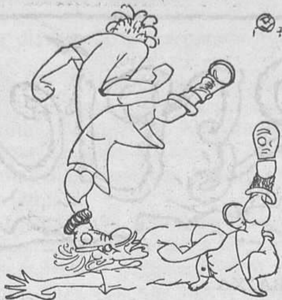
—No vaig voler fer-me boxador perquè no em trenquessin la cara, i té, ara m'ho fa un futbolista.