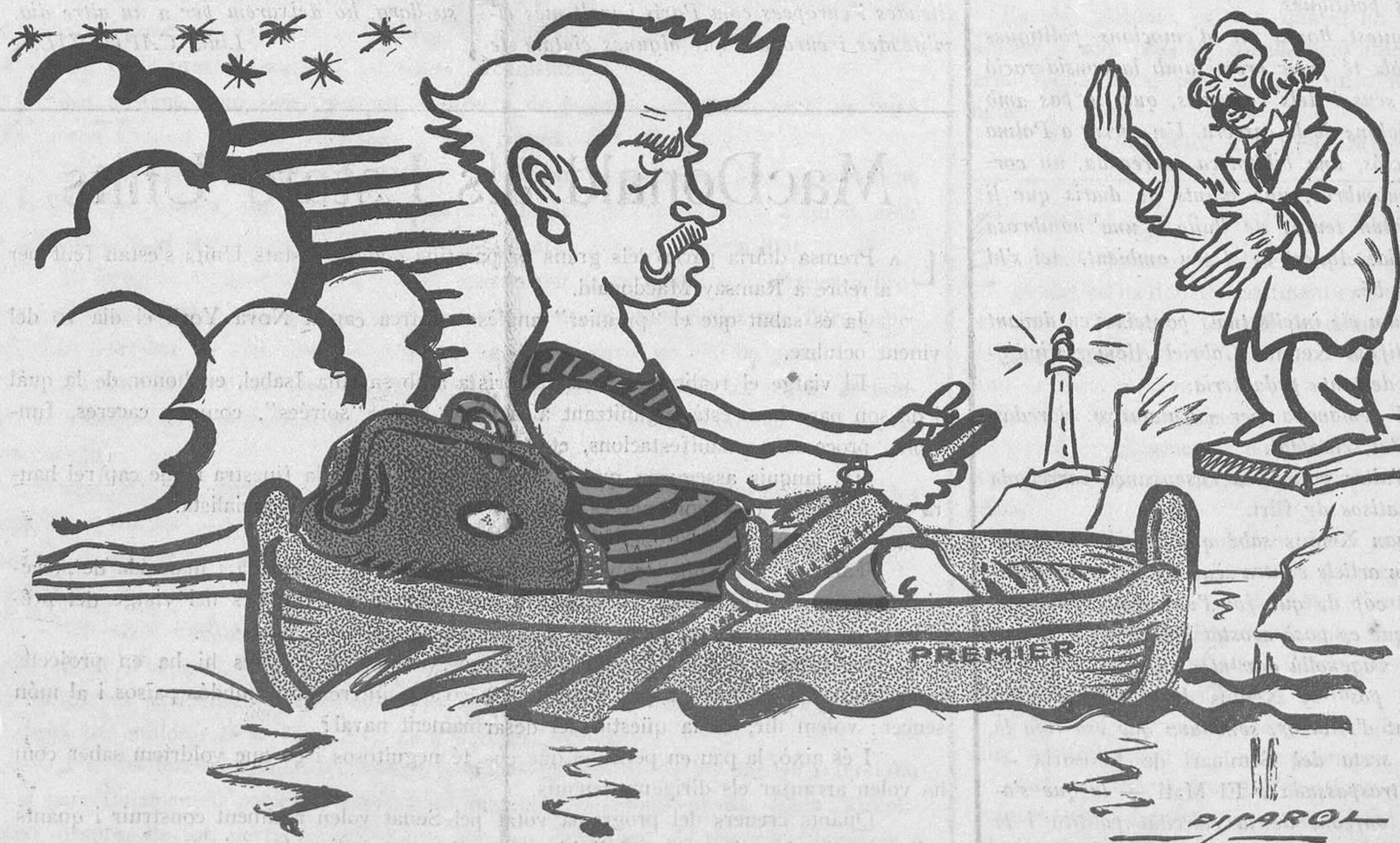
MacDonald a Amèrica

"Hi ha molts remeis — va escriure La Rochefoucauld — contra l'amor, però no n'hi ha cap d'infalible".