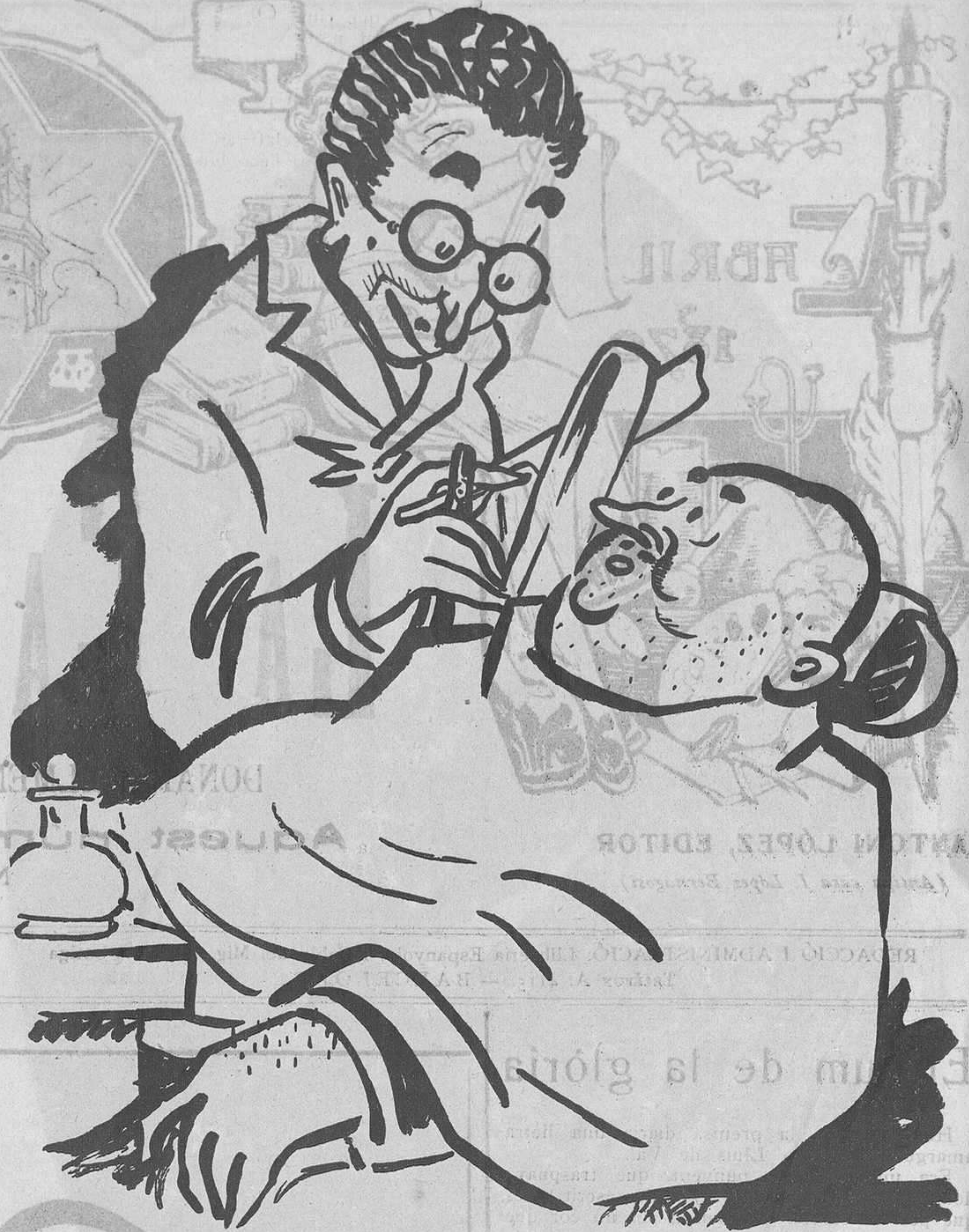
A CA'L BARBER

—... Perquè he d'anar a dinar amb el senyor.