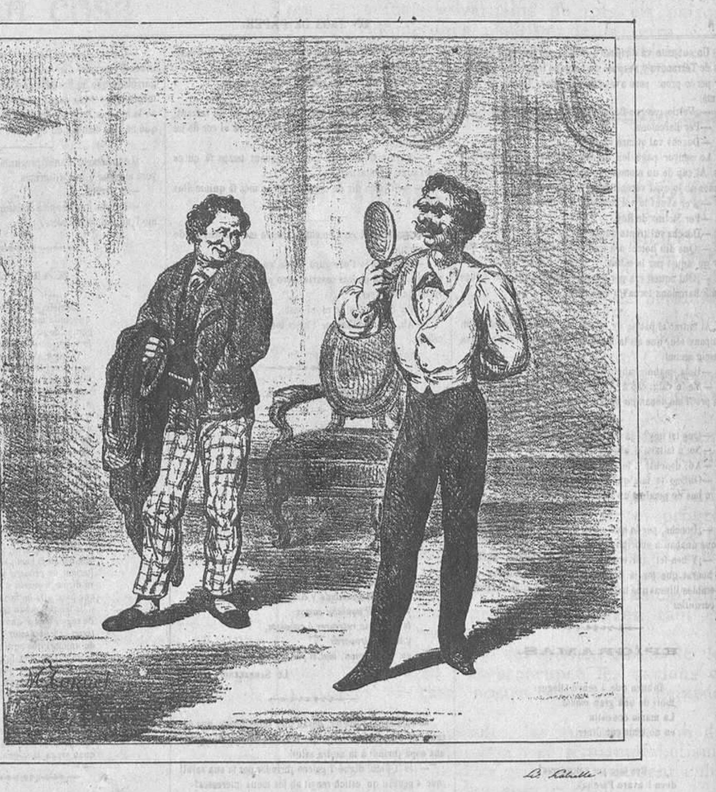
— Si un altre dia m portas un mirall que m fassis fer la cara tant lleija... i te despatxo! — Donchs ja m puch buscar amo

Per mi, ab allò que v' a dir lo advocat, y això de que us aném tornant cosas... y tot... ¡Vamos! jo pongo que aquell parell d animals era el Hipòlit i en Mariano, perquè essent vius, ab la rabia que s' tenían ja ho semblavan lo gat y lo gos... Y aquell bagulet me fá una por que no fés la Estrellaeta.