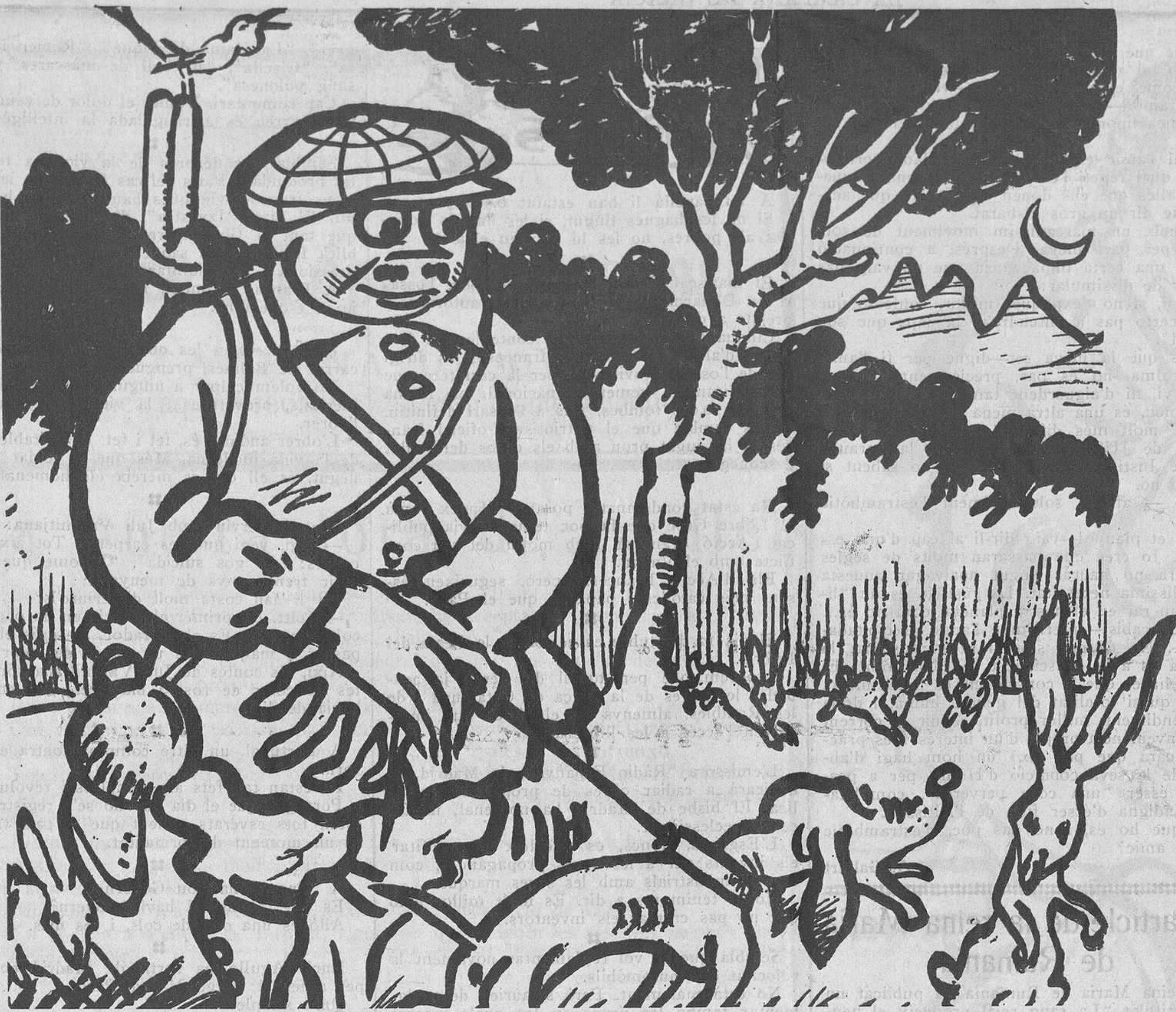
LA CACERA I LA CRISI

—I què en treuré de matar-los, si després tampoc tindrè carbó per a coure'ls?