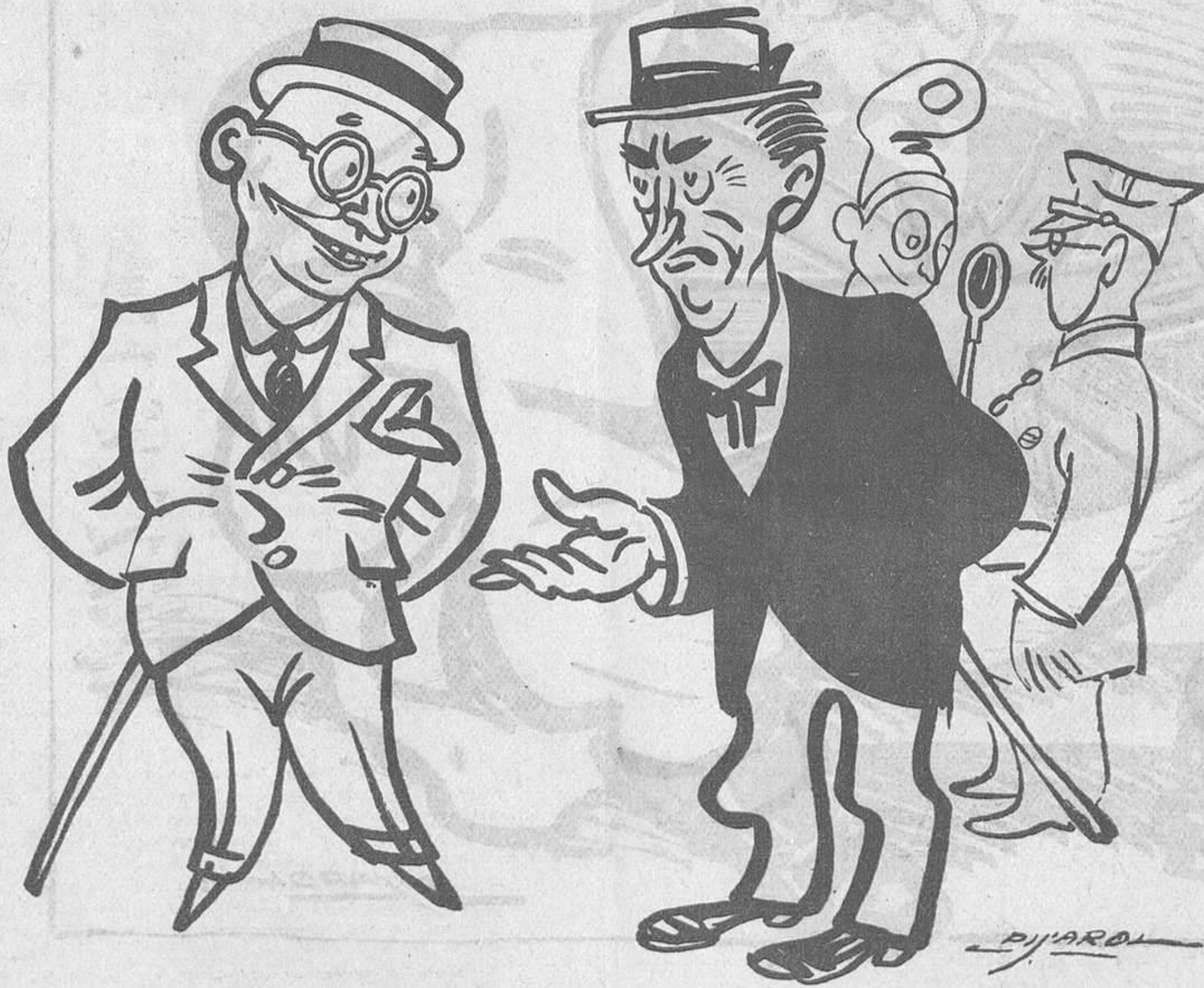
LA FAMOSA FALSIFICACIO

—Un bitllet de 100 demanes? Si que és estrany! —Per què? —Perquè ningú no els vol.