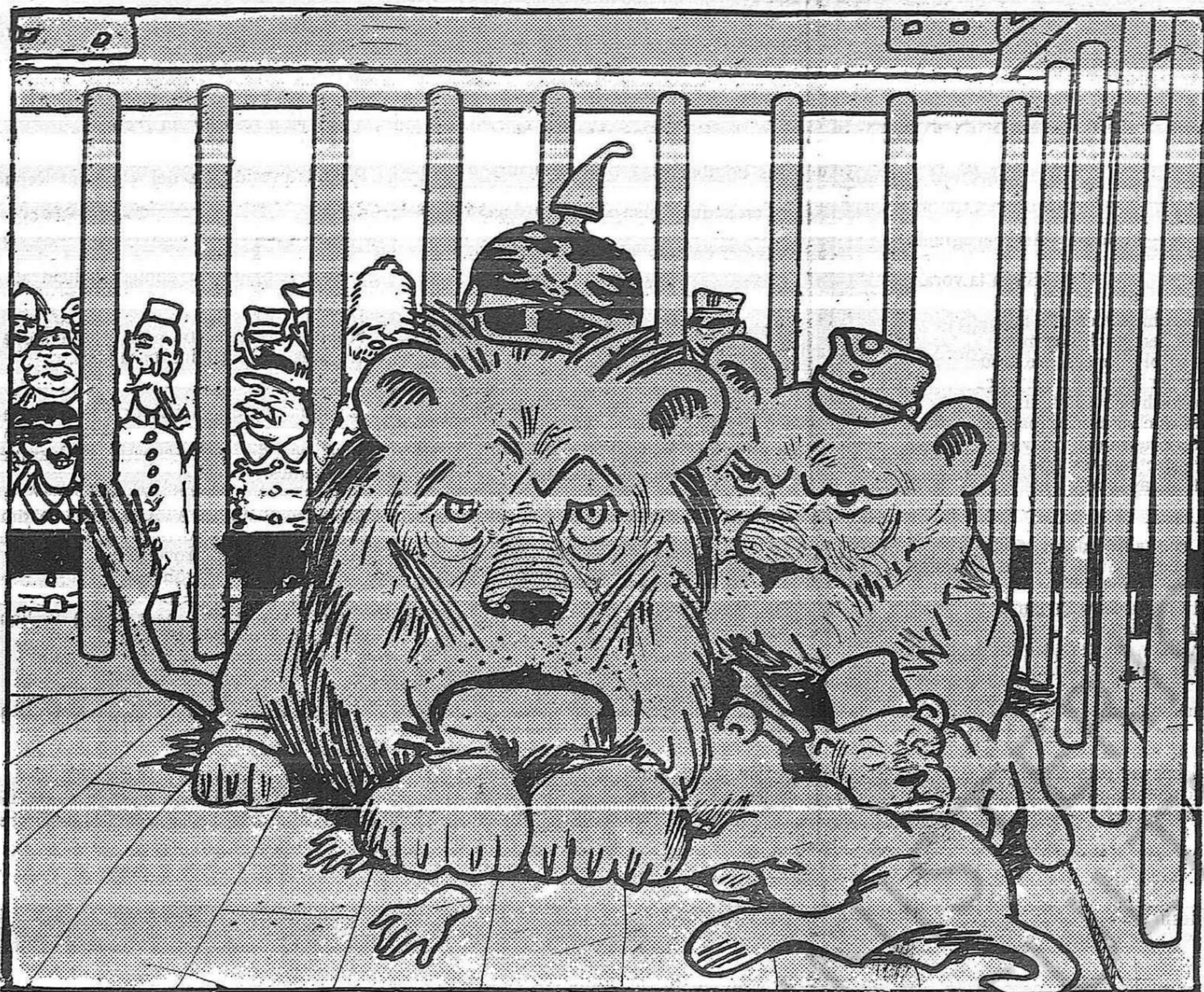
El Lleó, a la Lleona.—Guaita endarrera; mira-te'ls... Els veus entre barrots?... Tots són méus!... Tots els tinc engabiats!