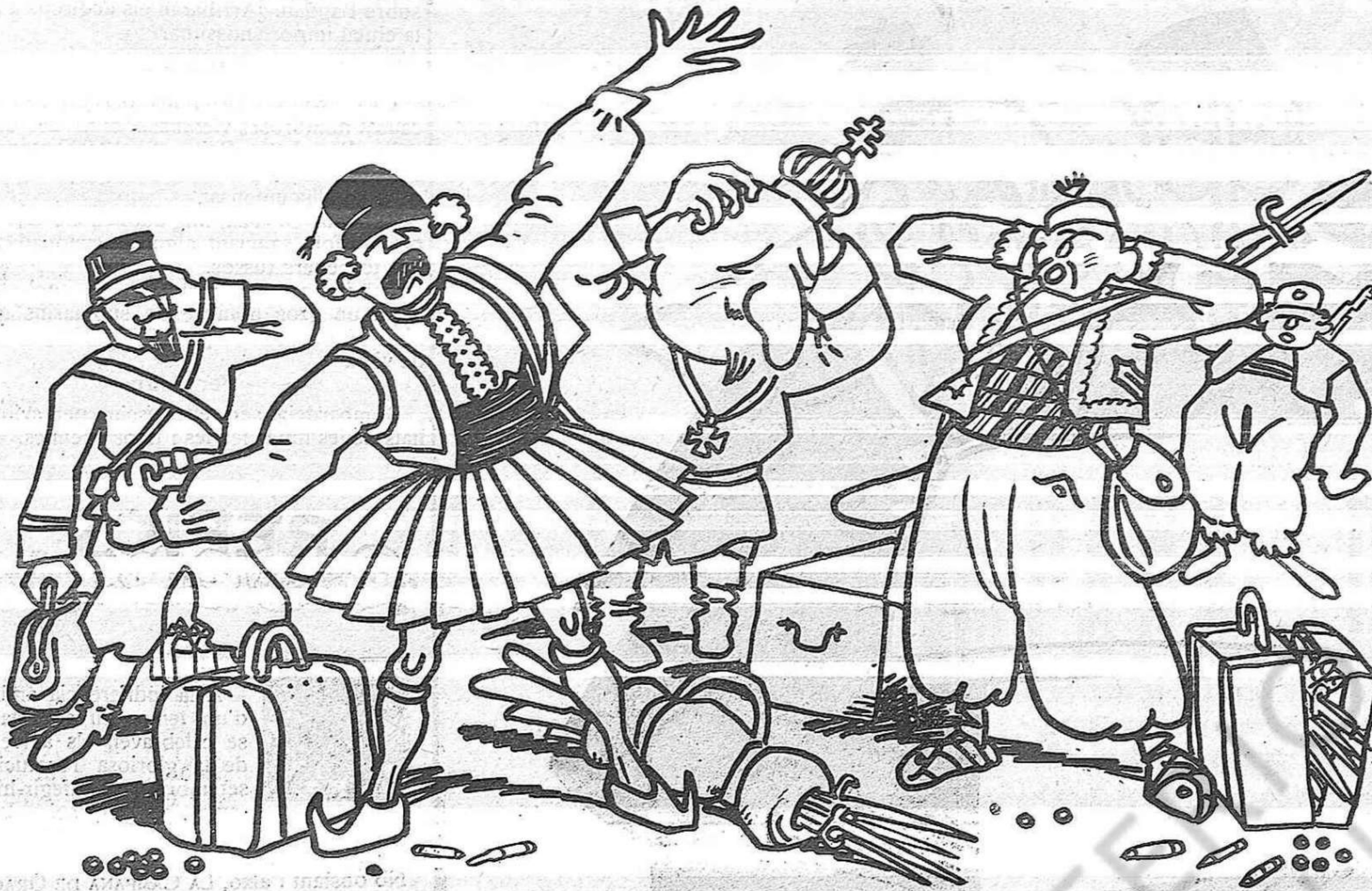
—Siguem-hi, minyons?... Siguem-ni!

verlo sin volverse loco y epiléptico y sin babear como un camello? ¿Y no exclama otro, hablando del suyo: O delices du premier désir qui gonfle ses oeufs enfantins? No se avergüence Muley Hafid de ser pederasta. Aquí hay ya tantos, que si Dios nos hiciese presentar el número de hombres puros y probos que exigía para librar a Sodoma del fuego, quizá no los encontraríamos.