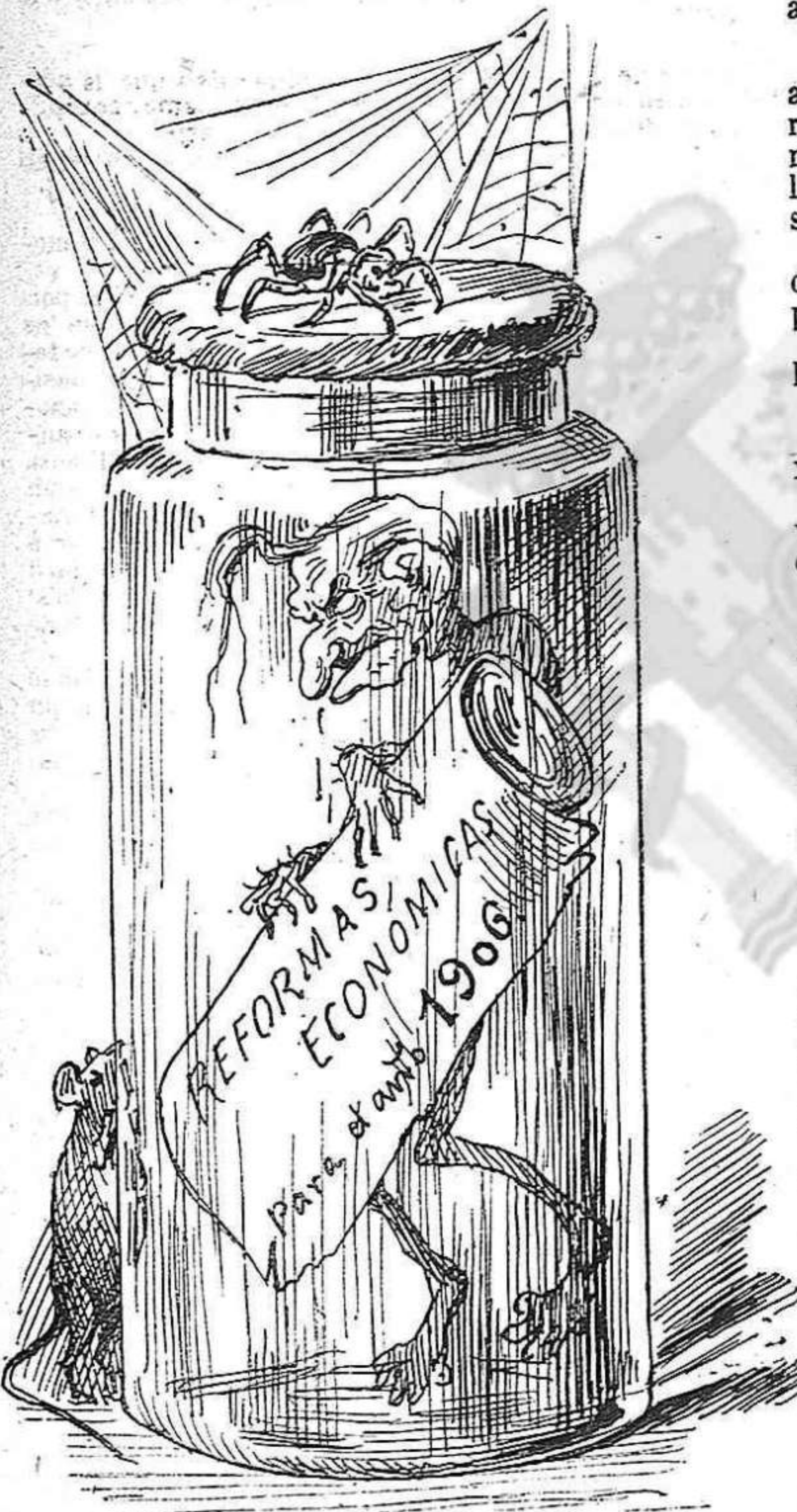
—Suprimirém los consúms, als deutes hi farém creu; pero tenim d' esperarnos fins d' aquí vuy anys ó deú.

rril, may siga sino per comoditat dels comissionats de apremis.