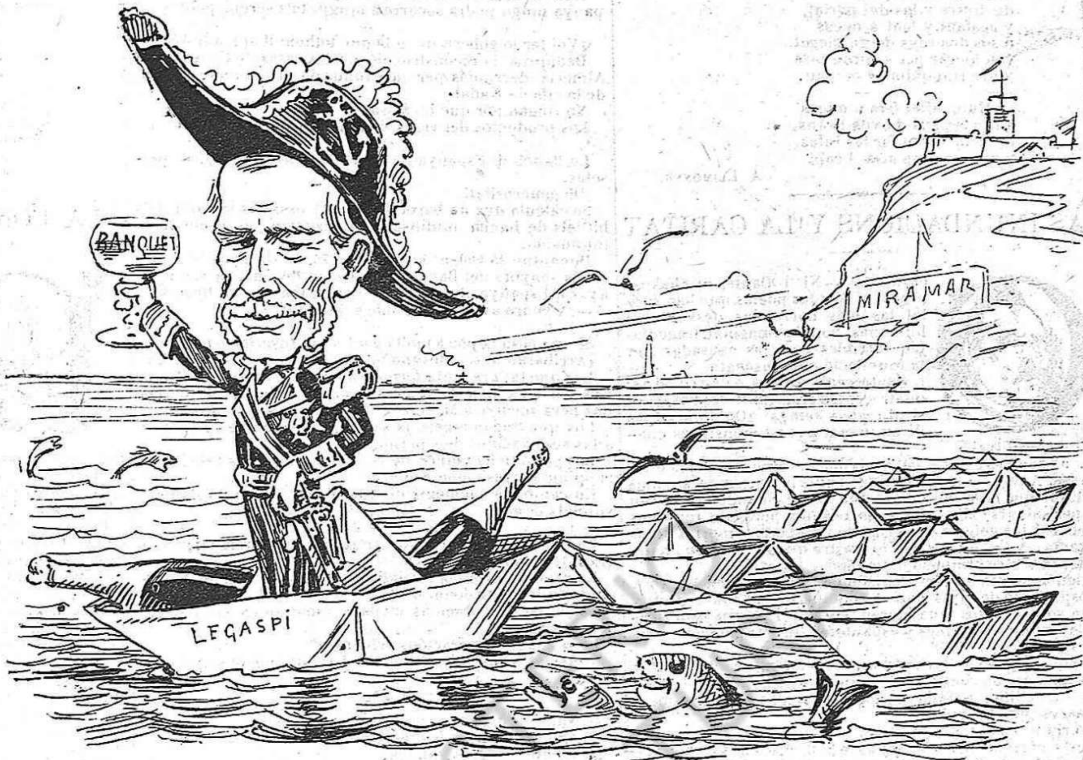
Mientras los fills de Consuegra pasan dia y nit plorant, en Beranger se passeja rihent y banquetejant.