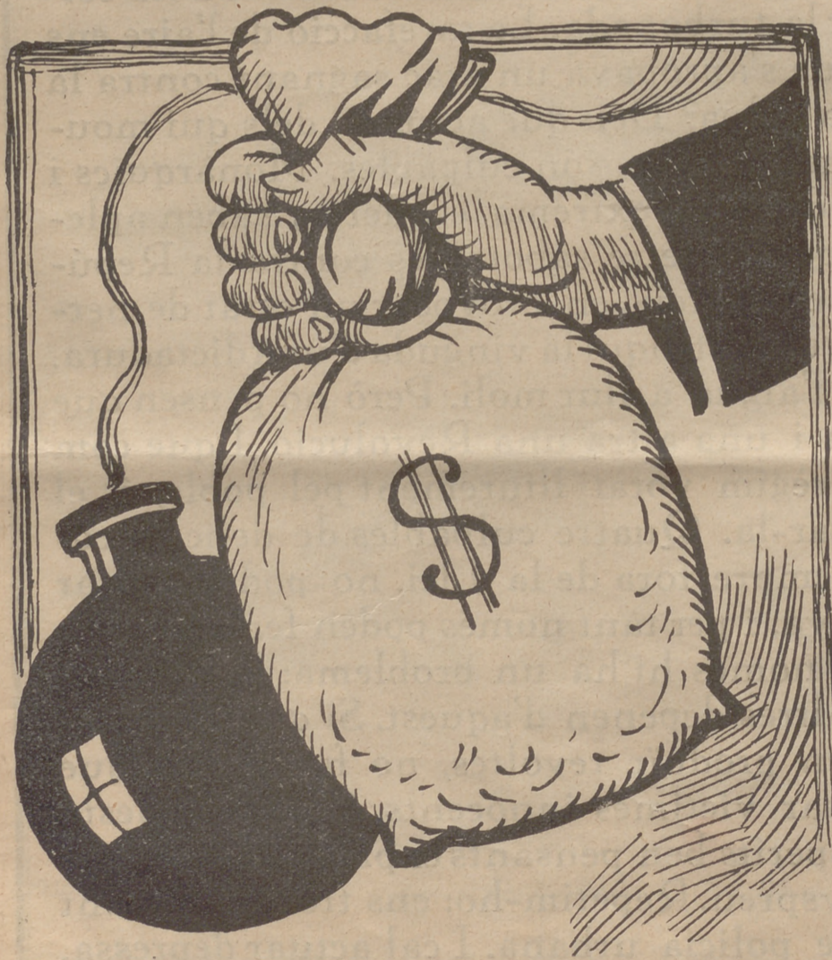
El que exigeix saber el poble