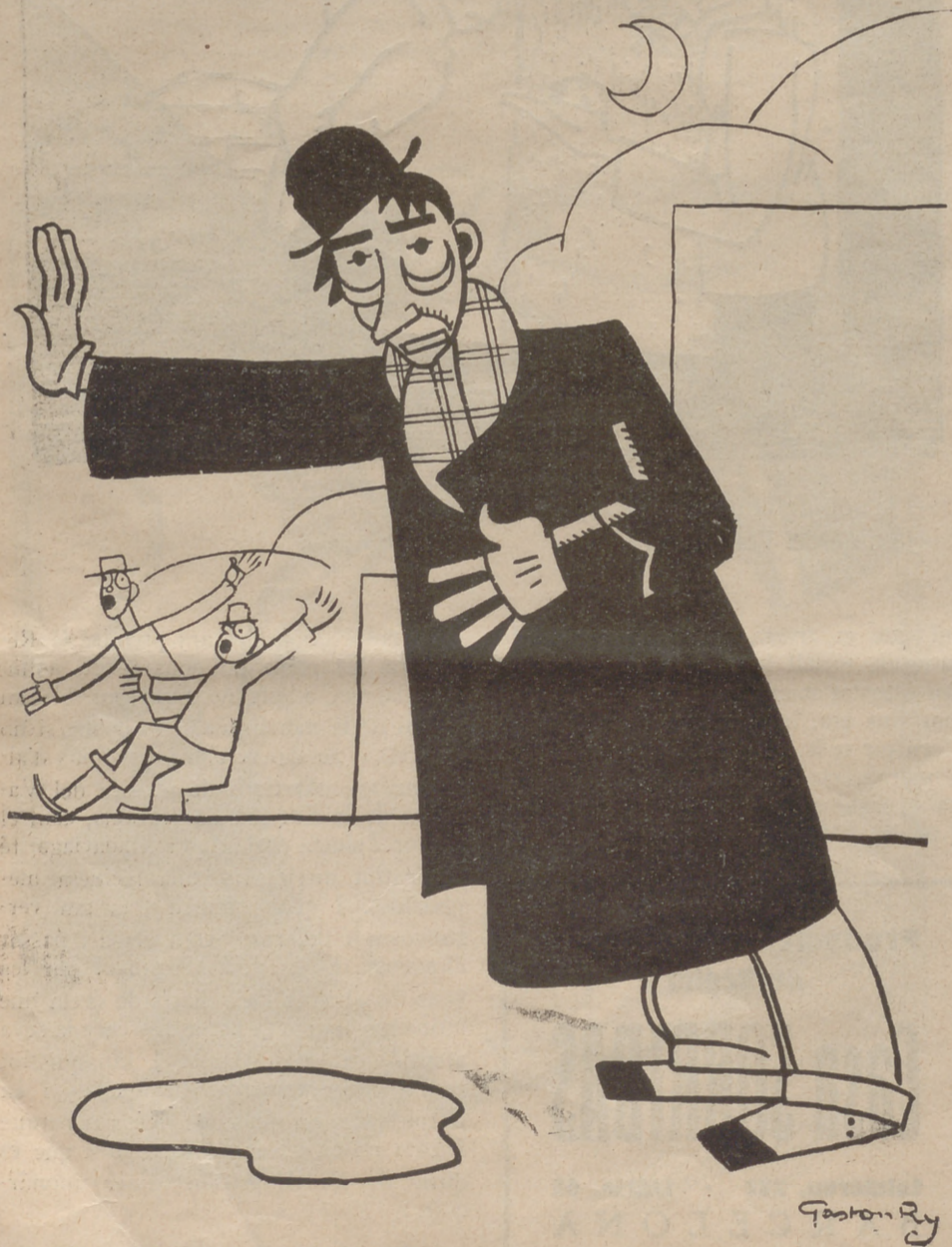
Els evadits de Villa Cisneros

"Dichoso aquel que tiene su casa a flote!"