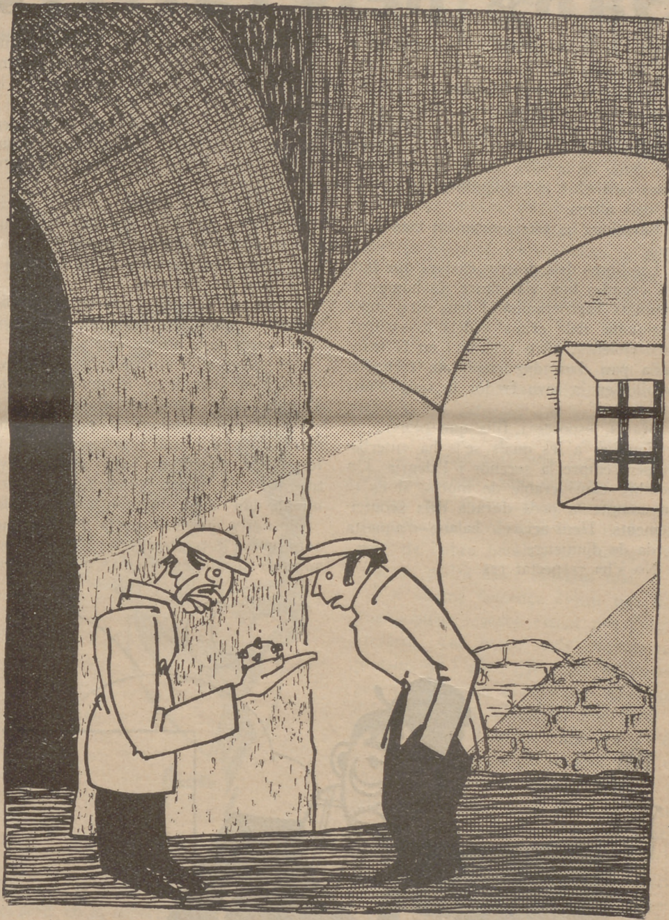
—I ja són de bona qualitat aquestes bombes? —Ja ho crec! Venen de París!

gut que es tracta d'una República de pasta de tortell i estan disposats — ho han intentat mantes vegades i, si seguim com fins ara, ho tornaran a intentar — a cruspí-se-la. Un avís, un consell: no la païran, els hi farà mal. Els hi farà mal, perquè no compten amb una cosa: el poble.