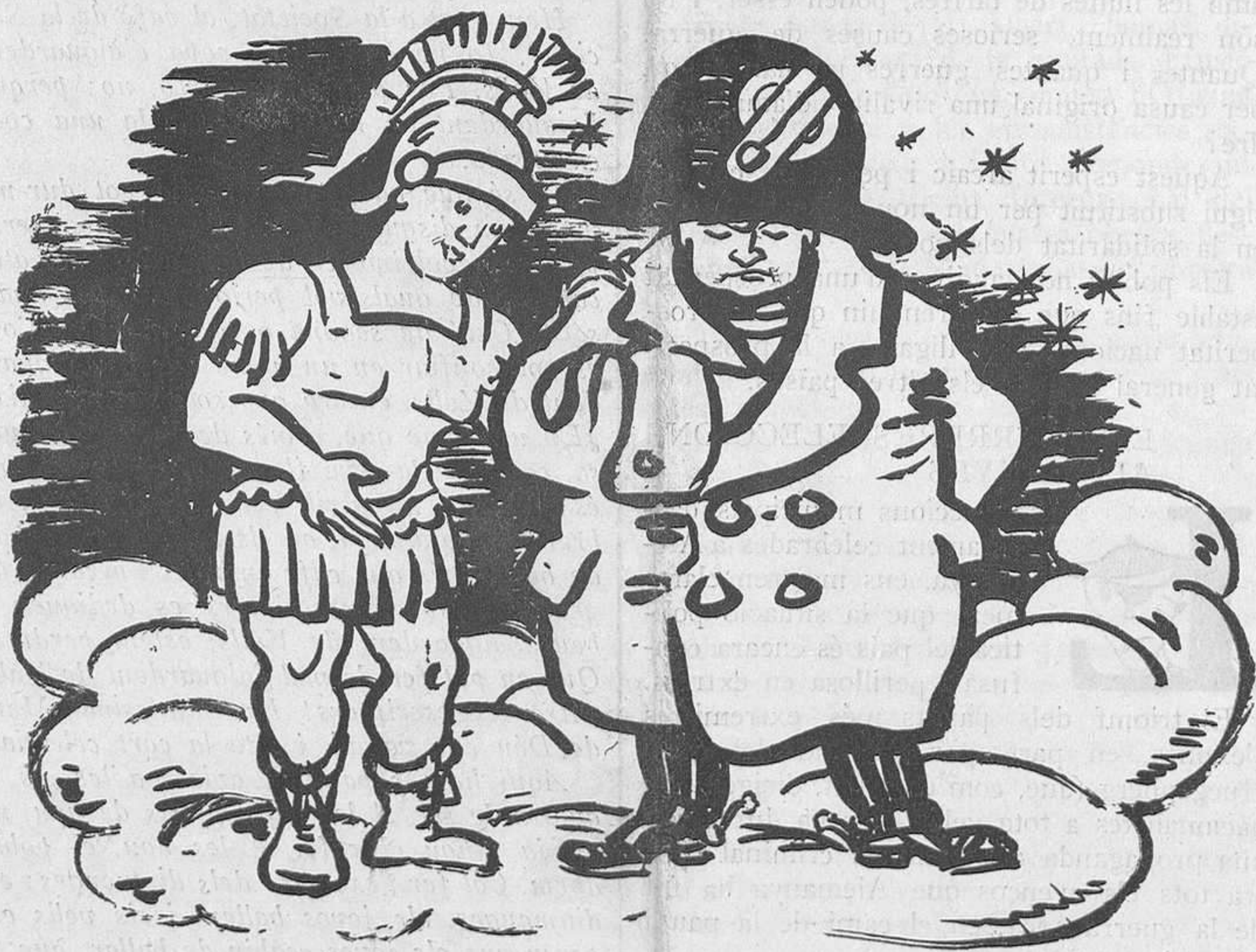
MARÇ A NAPOLEÓ

El temps, doncs, ens desfarà la incògnita que pesa sobre Rússia, i els fets es cuidaran de dir-ne la veritat.