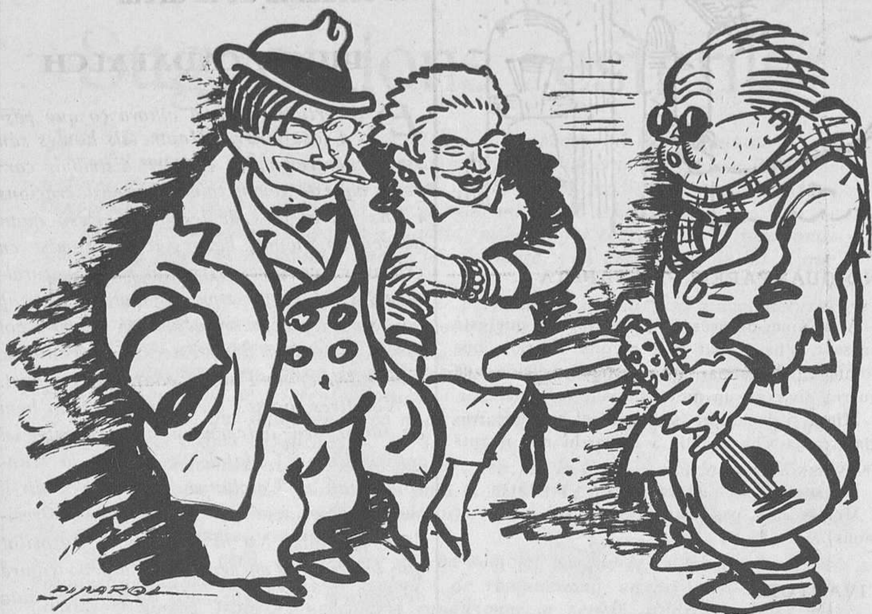
DE LA DIADA

—Déu li conservi la vista. —Gràcies; igualment.