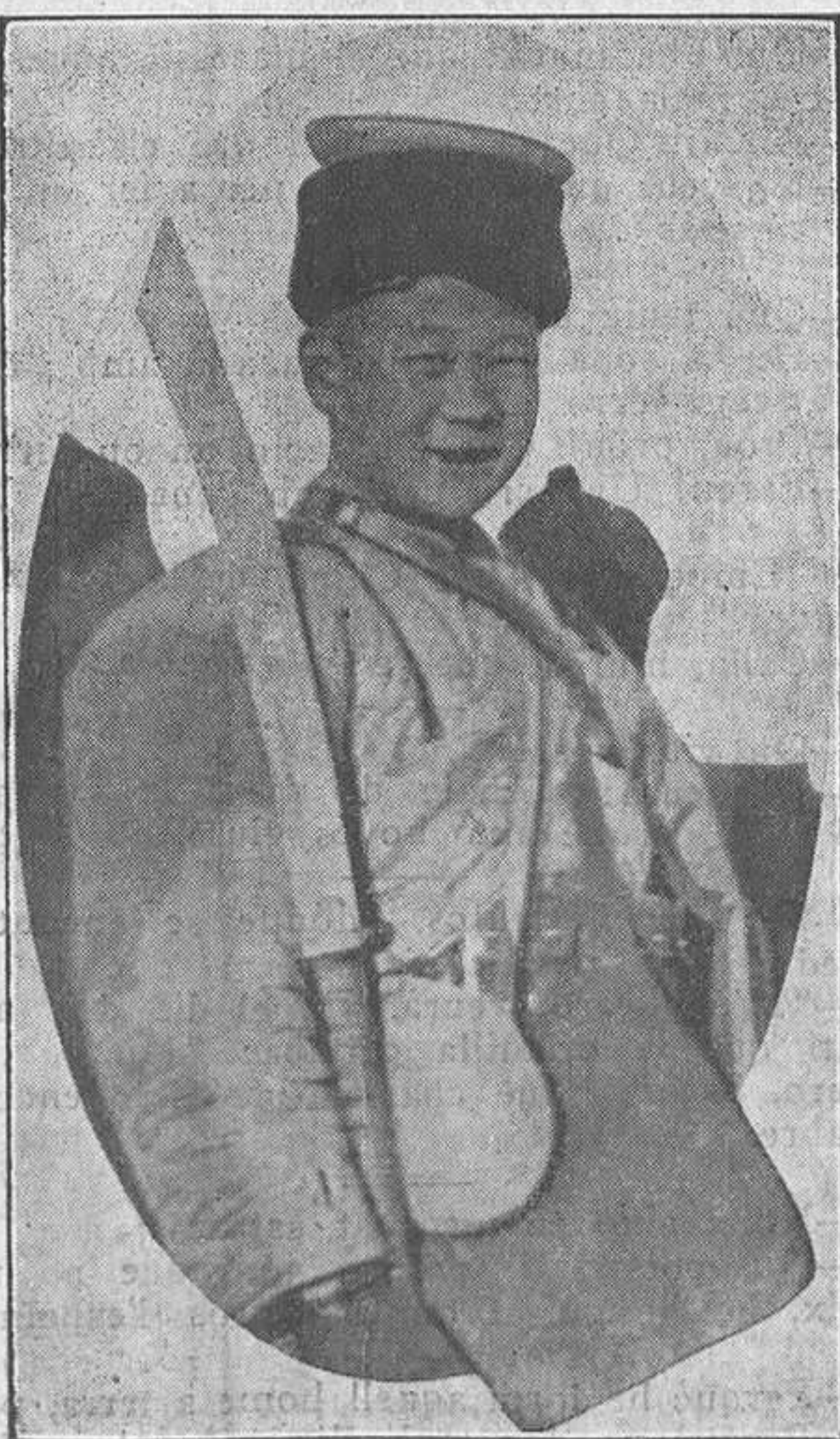
Qui ho diria que aquest jovenet somrient és un botxí.