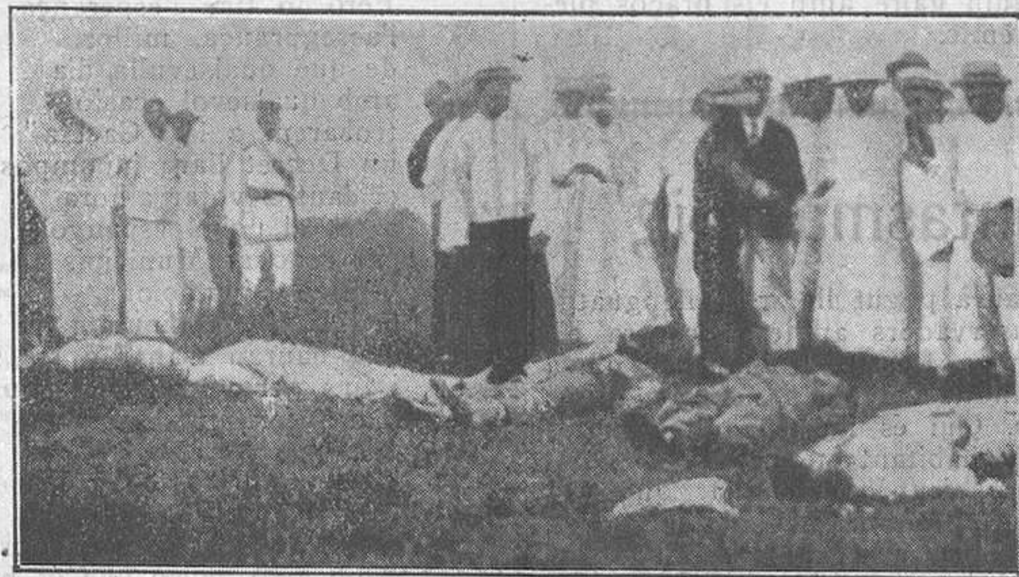
El trist epíleg de l'execució.