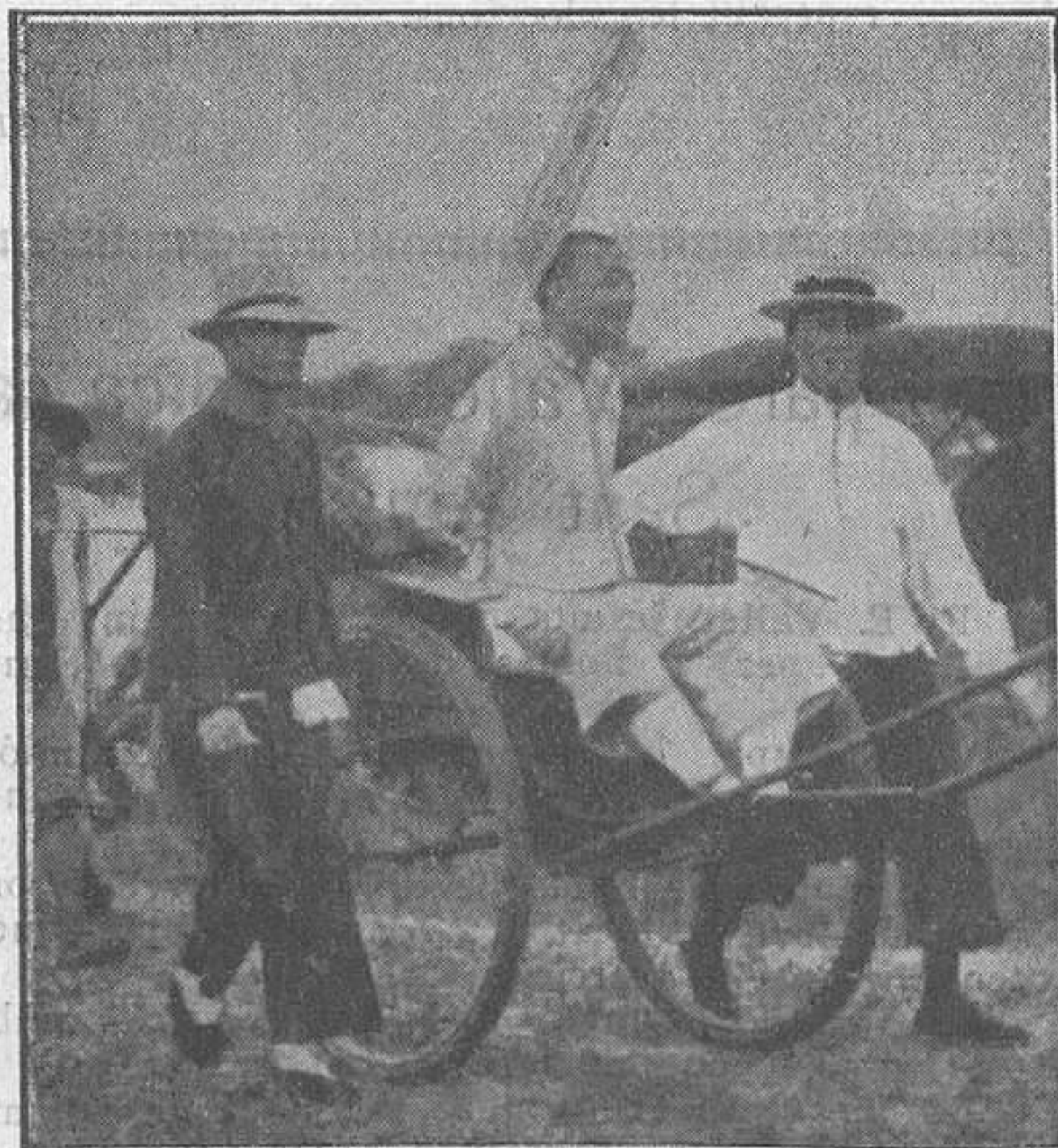
Un condemnat a mort, camí del suplici.