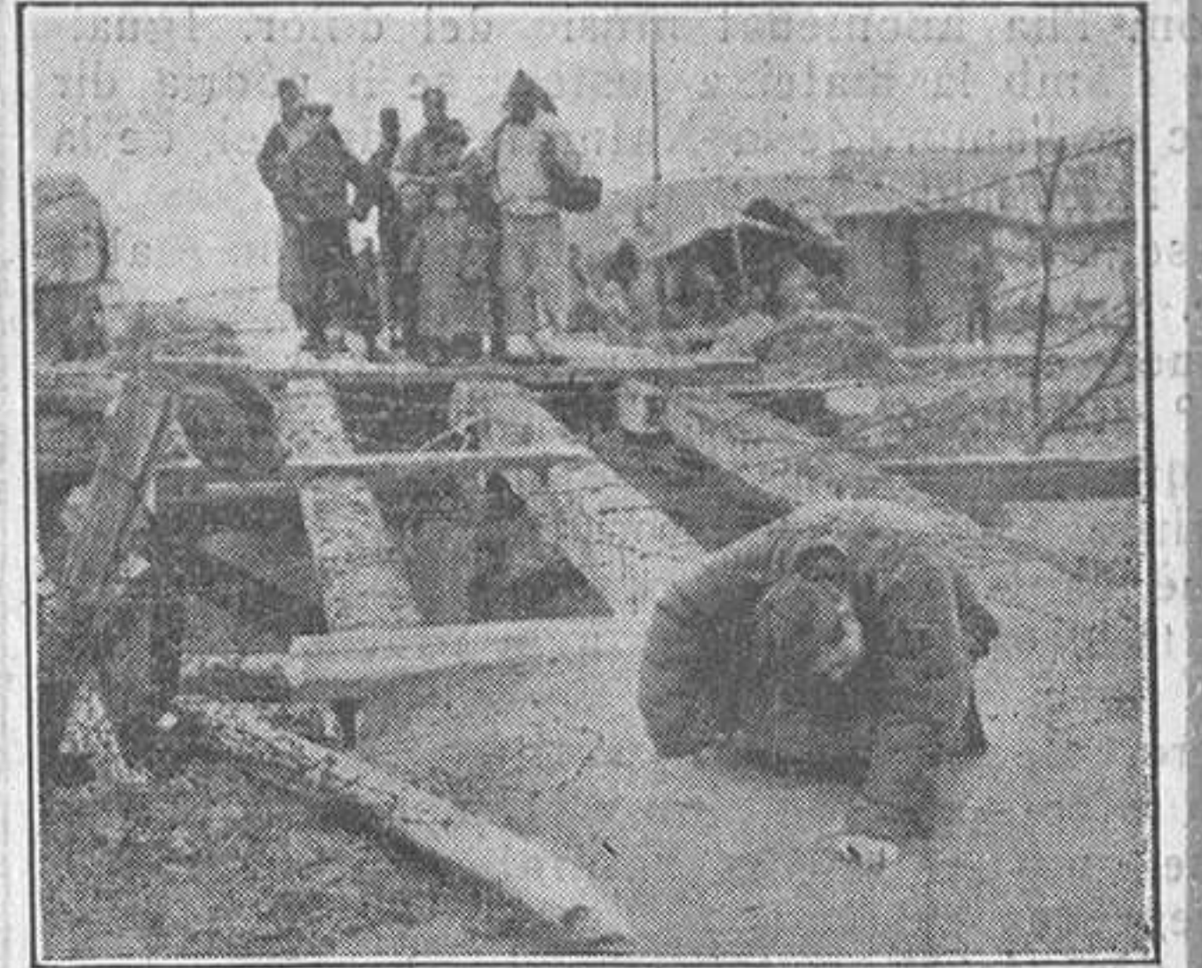
Alambrades d'una fortificació per a progir la concessió francesa.