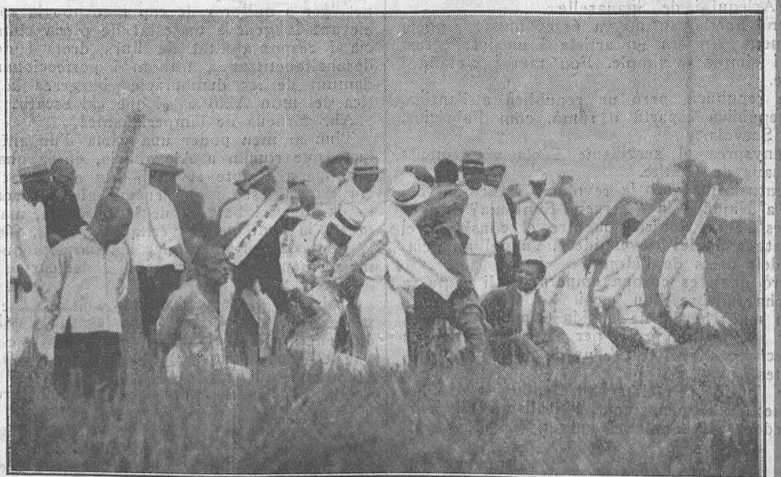
Tots els condemnats porten un rètol explicatiu de perquè se'ls castiga i de la pena que se'ls infligeix.