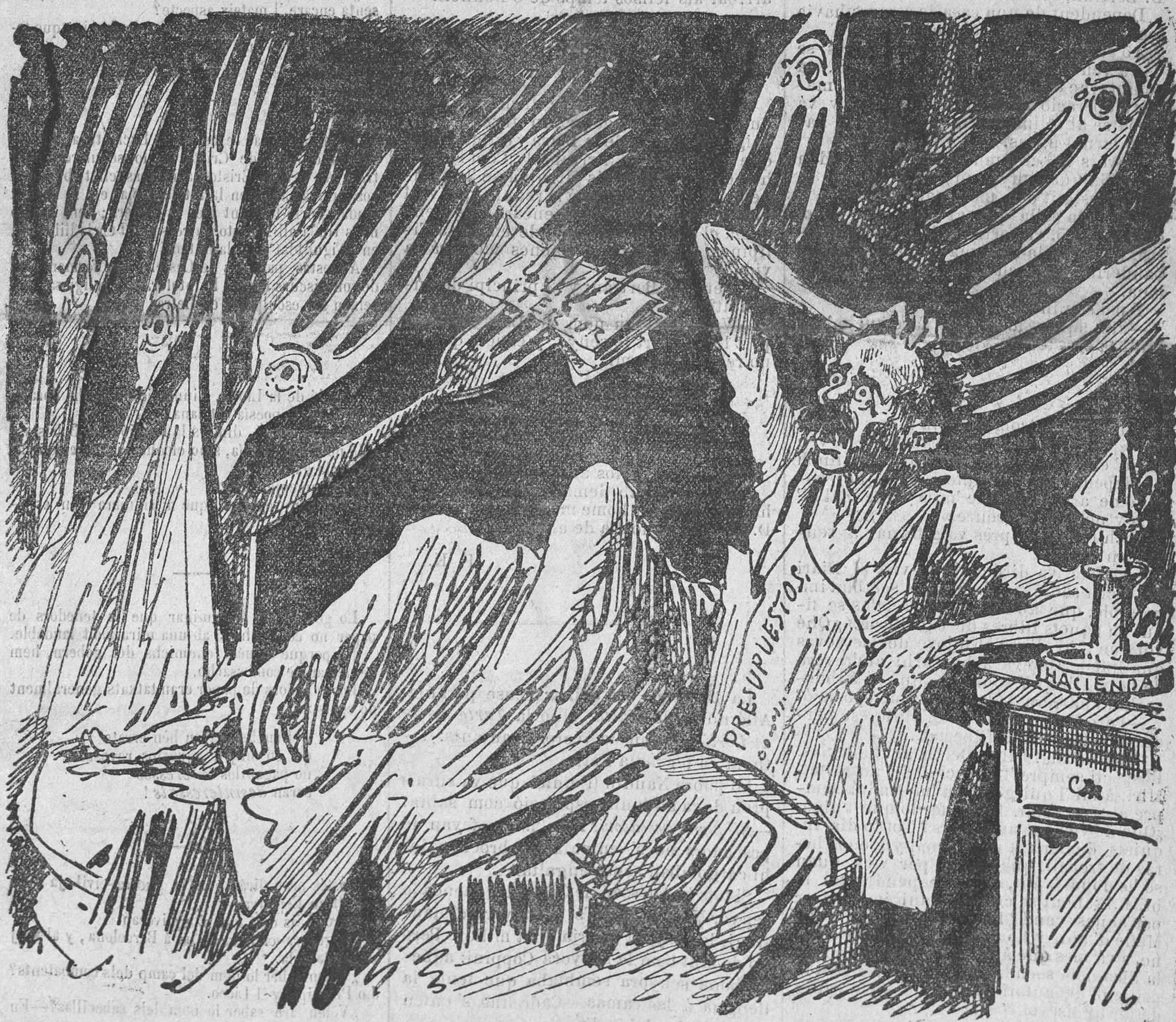
Los tenedores piden..... cuchara.

LAMINA EN GASTELLÁ PERQUE LA ENTENGUI QUI PUGUI