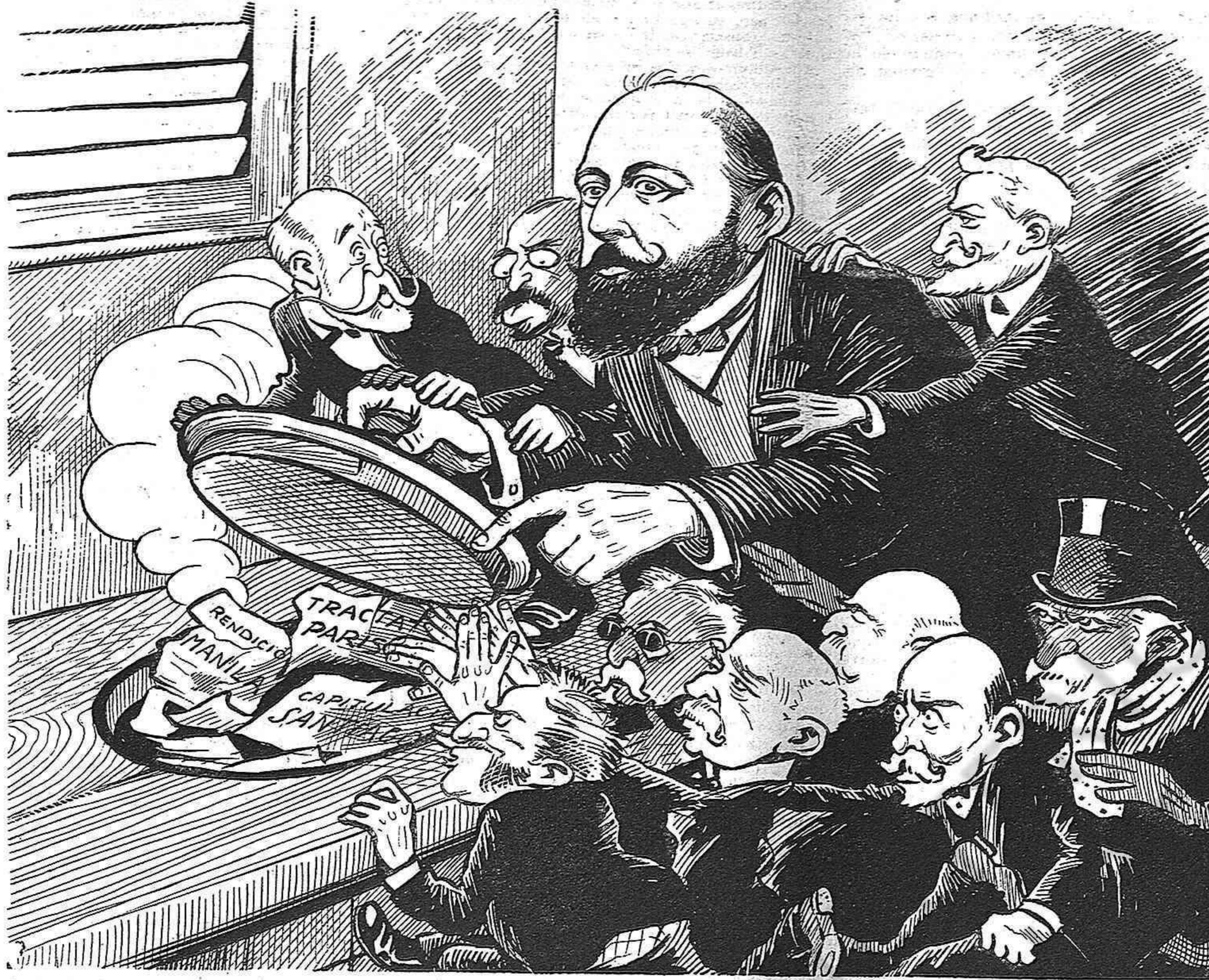
ELS ALUDITS: — ¡Tapa!... ¡Tapa!...

Vegi el general Luque com la lògica es partidaria acèrrima de la solució republicana.