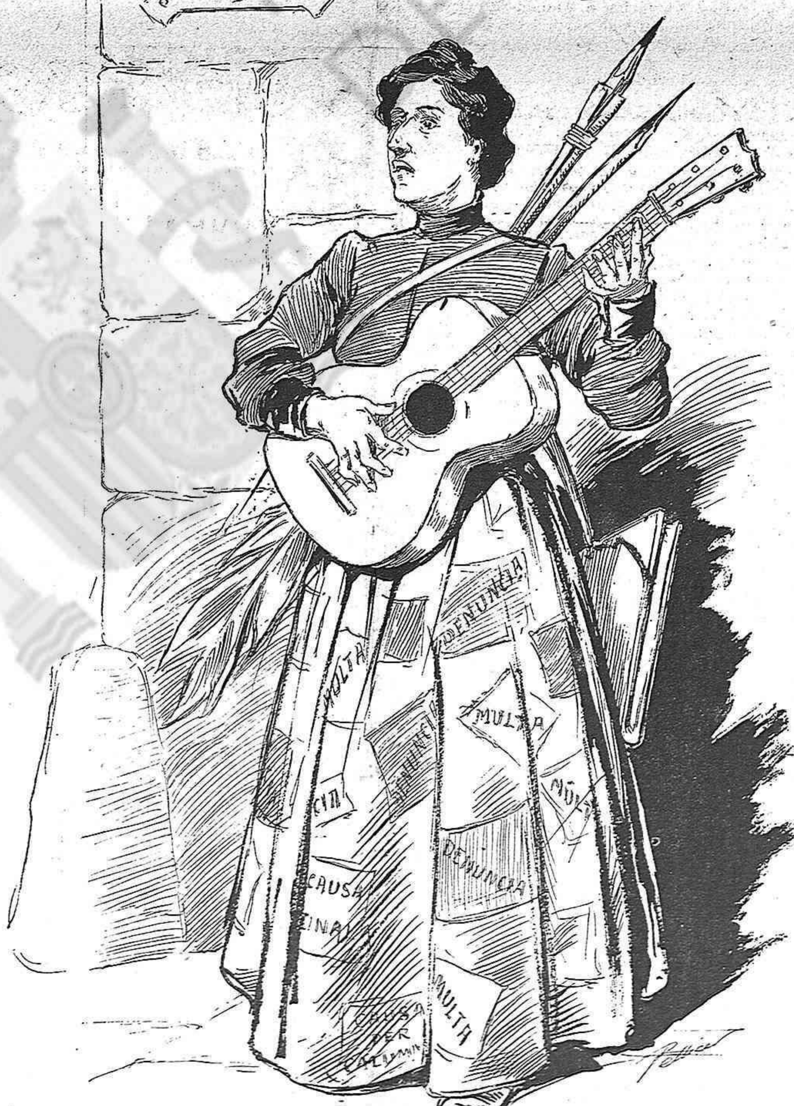
—¡Ay de mí! ¡Ay de mí! Si acabaré llorando...