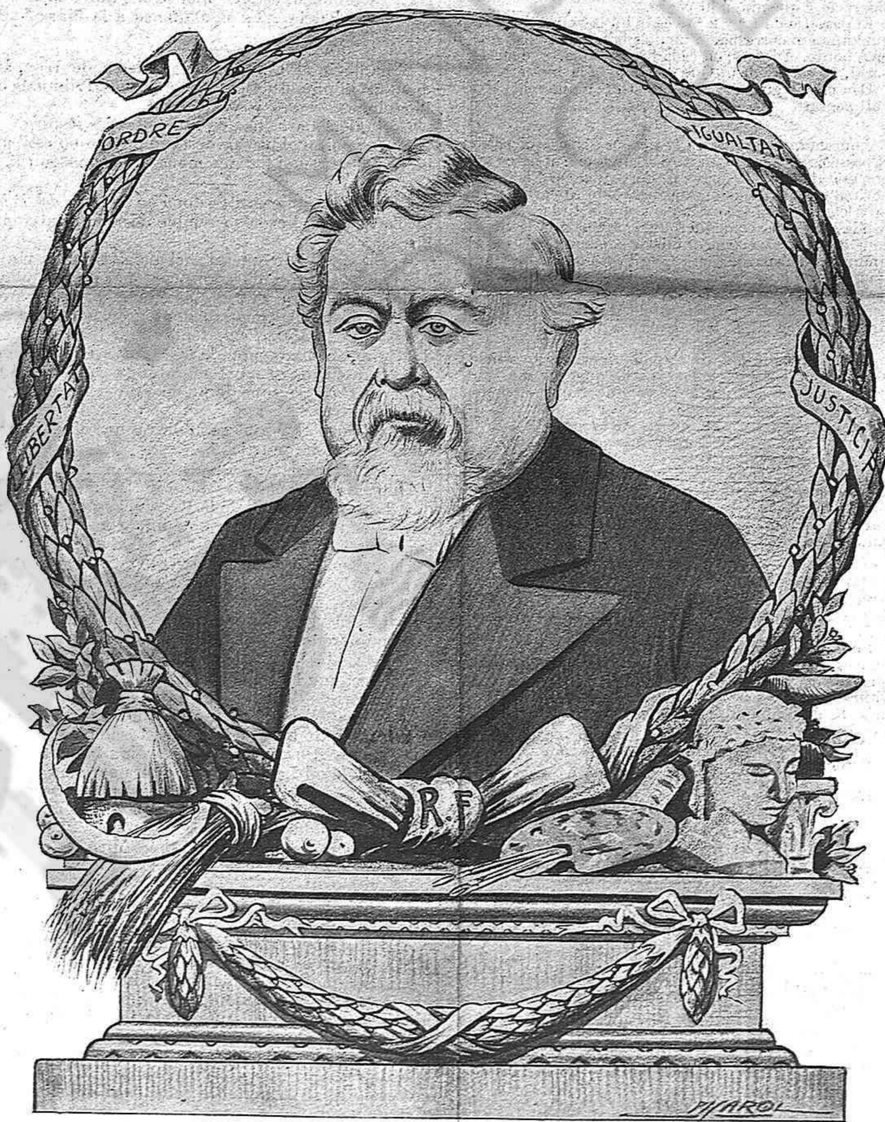
M. ARMAND FALLIÈRES