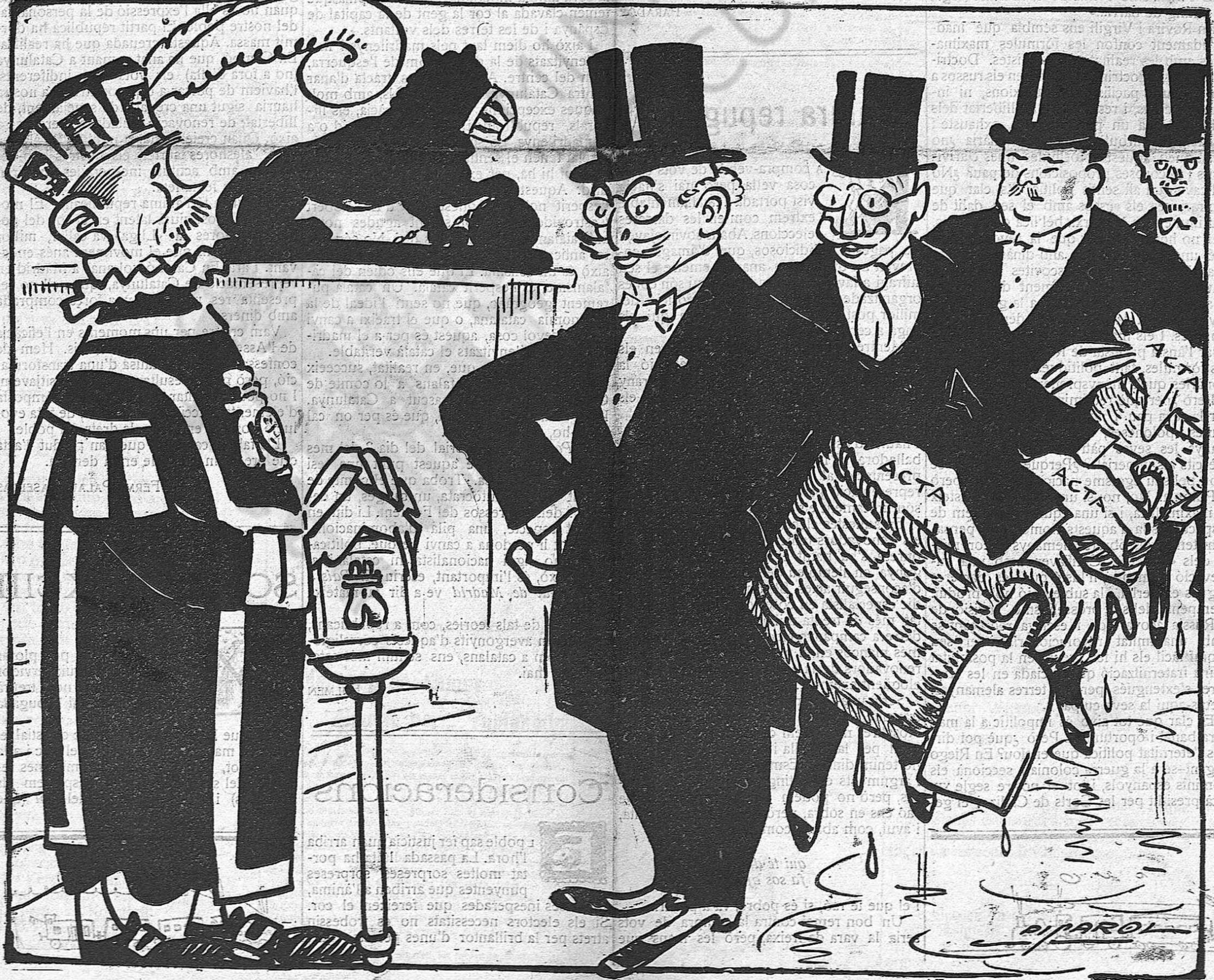
El porter.— Però, què s'han pensat d'aquesta casa?... Que's creuen que això és un safareig?...