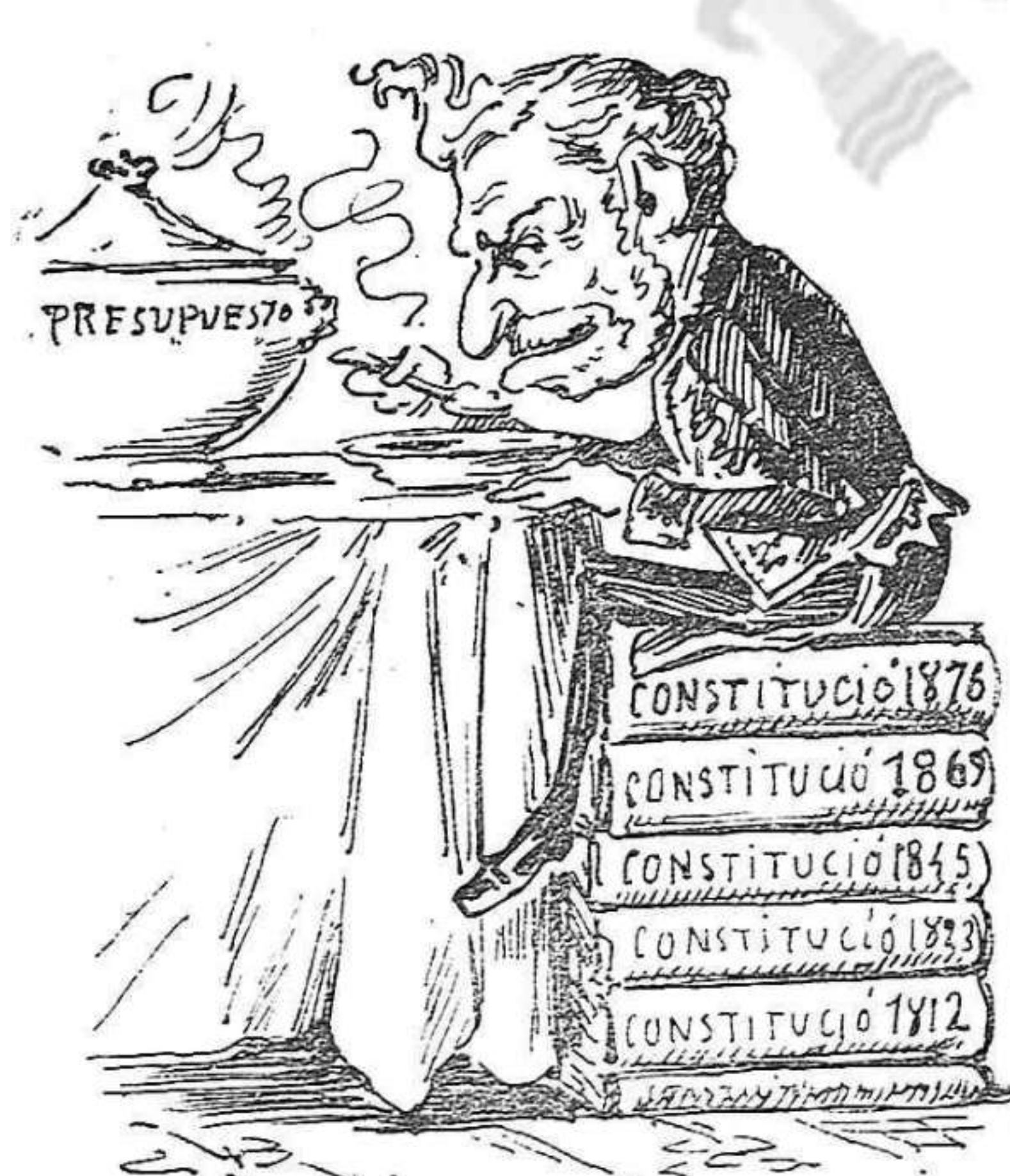
—Que digan lo que vulgan: per arribar á la taula del presupuesto, totas las constitucions son bonas.