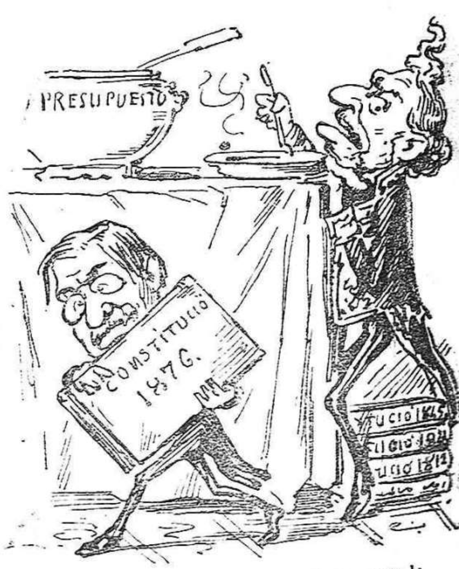
Y 'l Sr. Cánovas se n' hi emporta la de 1876, y ja no arriba á la taula.