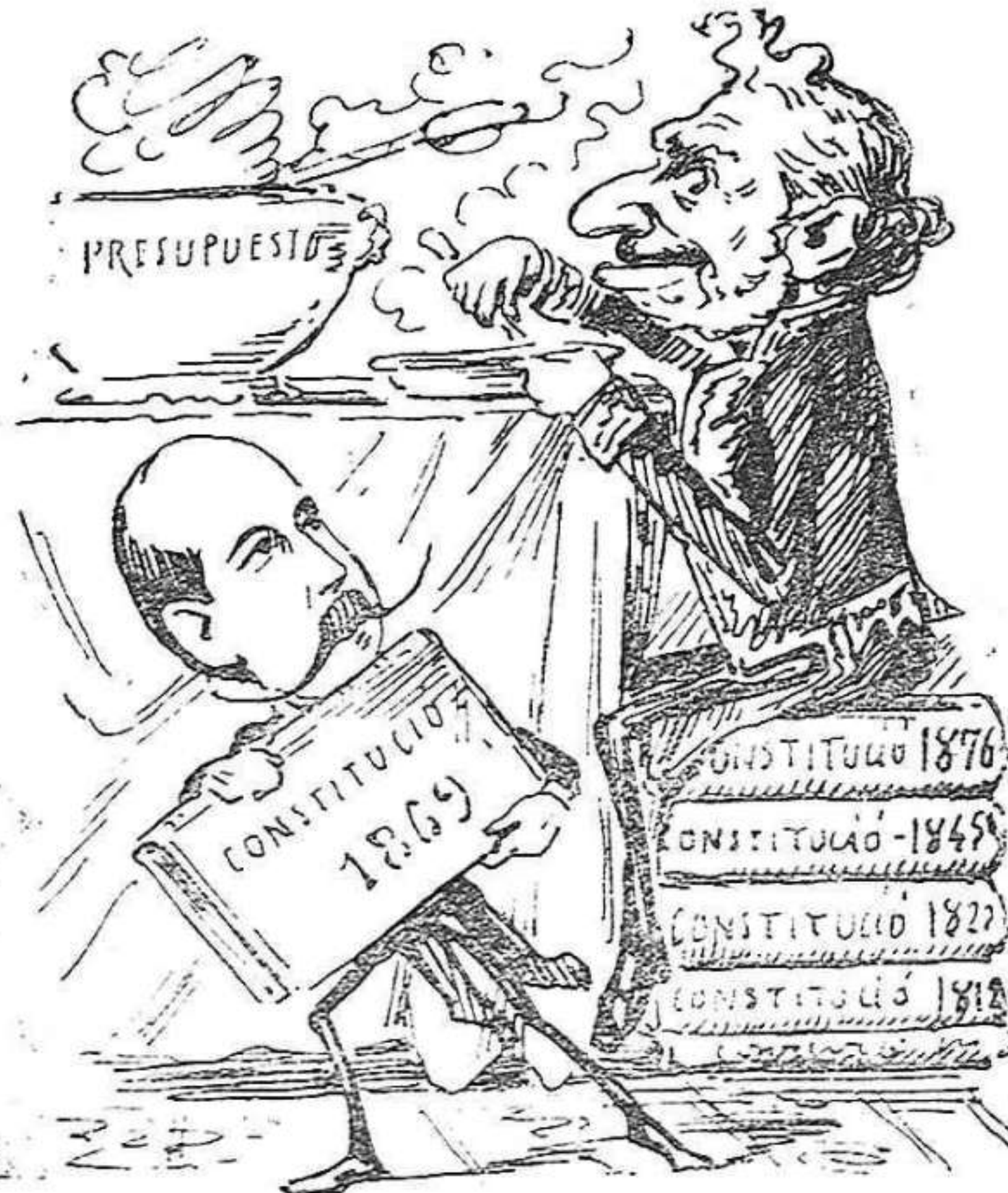
Y vels' hi aquí qu' en Moret se n' hi emporta la de 1869, y ja menja ab pena.